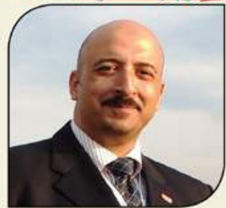
بقلم: أشرف كاره