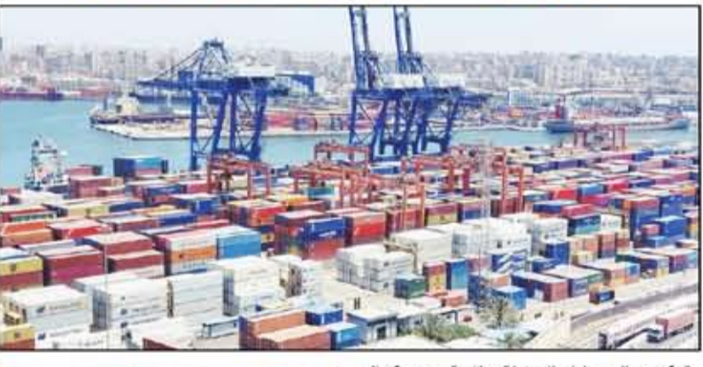
تمكن رجال جمارك الدخيلة برئاسة مجدى كمال الشهاوى رئيس الإدارة المركزية بالتنسيق مع معمد عبد الغنى مدير عام المركز اللوجيستى وأمل أحمد مدير عام الانشقيات من ضبط محاولة تلاعب وتزوير في المستندات للتهرب من سداد جزء من الضرائب والرسوم الجمركية بالمخالفة لأحكام قانون الجمارك رقم ٢٠٧ لسنة ٢٠٢٠ ولانتهه التنفيذية رقم ٤٢٠ لسنة ٢٠٢١.

أكدت السفيرة هيريو مصطفي غارغ، سفيرة الولايات المتحدة الأمريكية بالقاهرة، في تصريحات خاصة للسوق العربية، أثناء زيارتها لجامعة الإسكندرية، عن سعادتها بتواجدها في رحاب جامعة الإسكندرية، مؤكداً على سعيها لبناء العديد من الشراكات واليقات مع الجامعات المصرية خلال الفترة القادمة، كما فقدت السفيرة المركز الجامعي للتطوير المهني بكلية الأعمال جامعة الإسكندرية، واستمعت لتضمن النتائج التي حققها الطلاب الخريجين من المركز، كما أكدت أن الزيارة تأتي في إطار حرص السفارة الأمريكية بالقاهرة على التواصل مع طلاب المراكز الجامعية للتطوير المهني، فضلاً عن الإسهام لمقترحاتهم في تطوير النواتج والأنشطة التي يقدمها المركز لهم حتى يتسنى للسفارة تقديم الدعم اللازم لهم بالتعاون مع إدارة جامعة الإسكندرية، وأعلنت السفيرة عن إنشاء مركز رابع للتطوير المهني في المجموع الطبي لخدمة العملية التعليمية بالمجموع الطبي، وأشارت أن هناك مقترح لإنشاء مراكز لدعم النفس والصحة النفسية للطلاب، لافتة