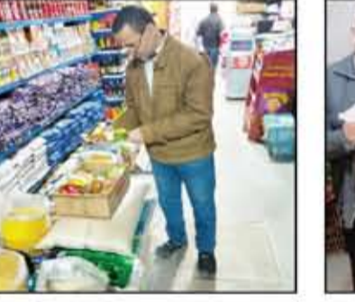
انشاء الحملات الرقابية على الأسواق والمخازن