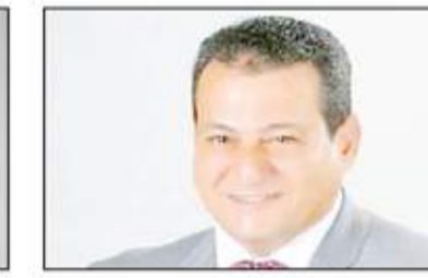
أبو العباس التركي

بكتدوينها بعيداً عن ذويم، مما يؤدي لاضطرابهم للهجرة خارج البلاد، لما يعانونه من قلة تقدير داخل بلادهم. وتابعت حافظ: كما تقدمت بطلب إحاطة بشأن نقص المستلزمات الطبية داخل المستشفيات، والتي يعاني منها شارك بها أطباء بتخصصات متعددة، وشركات أدوية تقوم بتوزيع عينات من الأدوية، ومعمل تحاليل لإجراء جميع التحاليل بالمجان لأي عدد من المواطنين المتواجدين وقت القافلة ويتم إرسال نتائج التحاليل عبر الواتس اب، كما يتم تحويل أي مريض بحاجة لإجراء عملية جراحية إلى مستشفى حكومي لإجرائها بعد تطبيق الكشف الطبي.