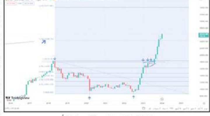
أداء المؤشر الرئيسى للبورصة المصرية مؤخرًا