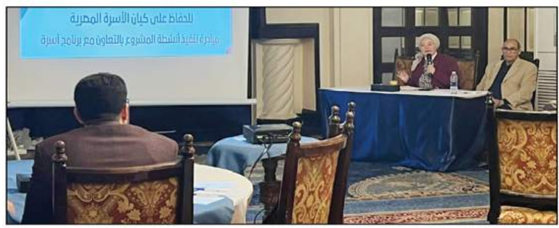
اللقاء على كيان الأسرة المهرية... تنفيذ أنشطة المشروع بالتعاون مع برنامج أسرة

والوعي لدى المقبلين على الزواج من خلال إكسابهم معلومات هامة عن مفهوم الزواج، وحقوق وواجبات كل طرف في الزواج، ومهارات حل التواصل الفعال، ومهارات حل المشكلات، واتخاذ القرارات، وإدارة الموارد المالية وتربية الأطفل بشكل ايجابي. كما تتناول الدورات توعية الشباب بأهمية إجراء الفحص الطبي للمقبلين على الزواج، والمناخ المختلفة لتنظيم الأسرة والمباعدة بين الولادات. ويأتي ذلك في إطار الجهود المستمرة من وزارة التضامن الاجتماعي للحفاظ على كيان الأسرة المصرية، لتأمين نسج مجتمعي قوى ومتناسك.