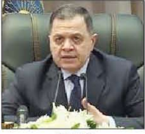
الواء محمود توفيق