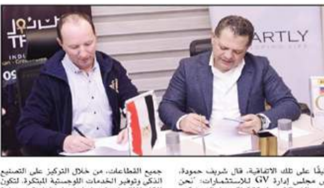
جميع القطاعات، من خلال التركيز على التصنيع الذكي وتوفير الخدمات اللوجستية المتكاملة لتكون المكان المثالي لتحقيق نجاحات استثمارية مستدامة في المستقبل.

العلاقة التجارية للشركة، وأشار إلى أن هذا التعاون سيسهم بشكل فعال في تعزيز الأبحاث والتطوير، والتي ستجري بالتنسيق مع مصر، مؤكداً أن هذه العليات ستعتمد على الخبرات والكفاءات الفنية المحلية، وستركز على استخدام التكنولوجيا الروسية بأيدٍ مصرية.