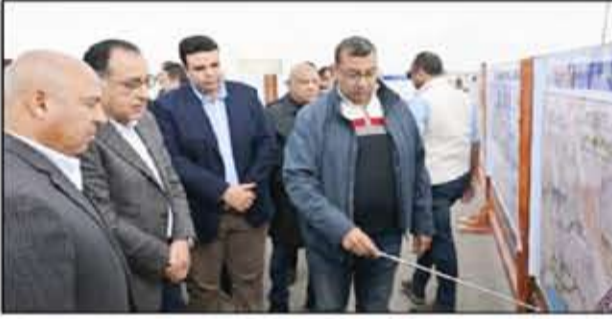
ومختلف أجهزة الدولة تعمل على بذل الجهد في هذا الملف، كونه يمثل مستقبل الدولة المصرية للتحول خلال المرحلة القادمة، منوهاً بأن الفترة المقبلة ستشهد زيارات كثيفة

للمشروعات الصناعية العملاقة والمشروعات التي من شأنها رسم خريطة للمستقبل لمصرنا الحبيبة. وأوضح أن زيارته التقديرية بدأت بميناء المنصورة، معتبراً أن ما نشهده في ذلك الميناء يمثل معجزة هندسية حقيقية، وأن ميناء المنصورة سيكون ضمن أكبر الموانئ على مستوى العالم، حيث يشهد إنشاء أرصفة بطول 1٨ كيلومتراً بالميناء تستهدف خدمة جميع أغراض عمليات النقل واللوجستيات. ولغيت إلى أنه في ظل أعمال تطوير البناء الجارية يتم كذلك التعاقد مع كبرى شركات الشحن وتجارة الحاويات في العالم، حيث شرعت تلك الشركات في استلام الأرصعة والمناطق المختلفة بالبناء من أجل بدء التشغيل، ما يعني أن عملية بناء الميناء وإنشائه تتم بالتوازي مع تشغيله، وذات الأمر بالنسبة للمناطق اللوجستية. وأكد أن البناء يتم التخديم عليه بشبكة متكاملة على أعلى مستوى من الطرق، إلى