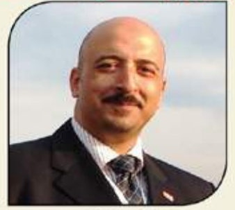
بقلم: أشرف كاره