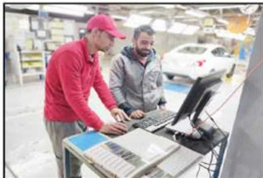
عمالة فنية مدربة على أعلى مستوى