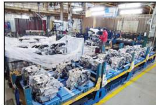
قسم المحركات ونواتل الحرك