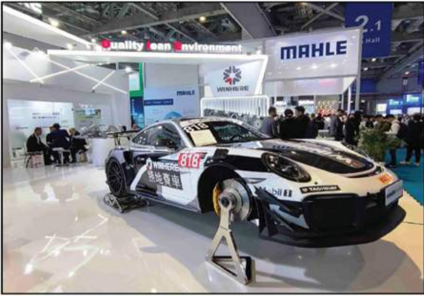
شركات قطع الغيار الرياضية كانت حاضرة بقوة

تهيمن على التحول في مستقبل صناعة السيارات، حيث تم تعيين أربع مناطق عرض لتغطية مجالات مختلفة من سلسلة التوريد التي تشهد نمواً وتطوراً قوياً.