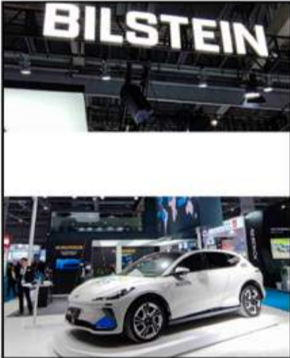
بشطين الصانع الأول عالمياً لأجهزة التعليق