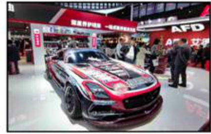
نشاط كبير للشركات الداعمة لرياضة السيارات المحلية والعالمية