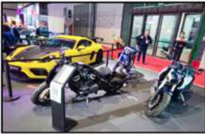
اهتمت شركات التعديل بالدرجات الثابتة أيضاً