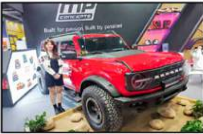
شاركت العديد من الشركات المتخصصة بتعديلات سيارات الدفع الرباعي