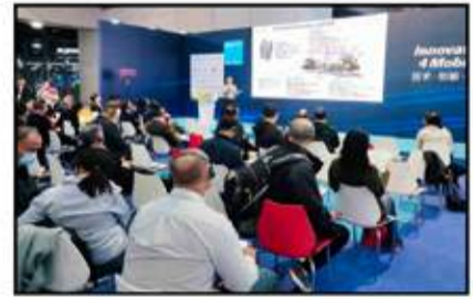
جانب من ندوات أكاديمية أوتوميكانيا