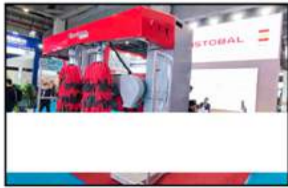
معدات سبيل السيارات بمحطات الخدمة