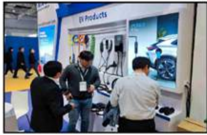
اهتمام كبير من الزوار بمستلزمات السيارات الكهربائية