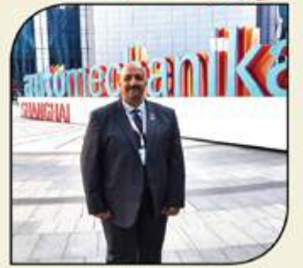
بقلم: أشرف كاره

ضمن رحلتي الأخيرة إلى (قارة الصين العظيمة) وبالتحديد لأحد أهم مدنها الصناعية والاستراتيجية "شانغهاي"، قمت بتسجيل العديد من الملاحظات التي أتمنى أن نستفيد من إيجابياتها بوطننا العربي بشكل عام وبمصر بشكل خاص والتي كان على رأسها: ● التوجه القوي للدولة الصينية في التحول إلى السيارات النظيفة وبخاصة العاملة بالكهرباء منها، حيث قمت بملاحظة ما يقرب من 50% من عدد سيارات (الركوب الخاصة) التي تسير بشوارع شانغهاي والتي تنتمي إلى السيارات الكهربائية وخاصة مع علامتي (BYD) و (TESLA). ● مدى الالتزام التام بالتقاعود والنظم المرورية بالسير، وهو ما انعكس على عدم وجود سيارات تعانى من آثار الجوارث أو الإحتكاكات كما اعتدنا أن نرى في مصر. ● الحضور غير العادي من الشركات بالمشاركة أو من الأفراد