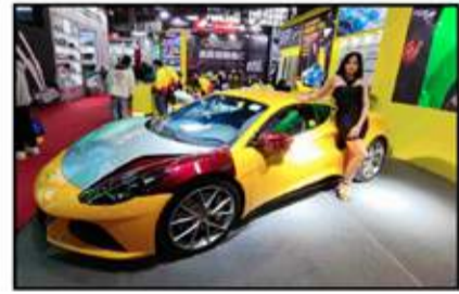
حضور قوى لشركات أفلام الحماية بالمعرض