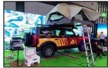
حضور قوى من شركات معدات ومستلزمات التحميم