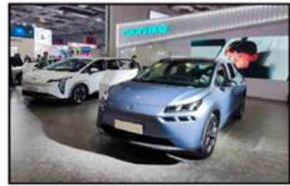
شاركت شركة آيون للسيارات الكهربائية بجناح متميز بالمعرض