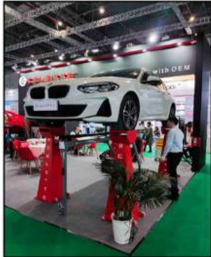
تميز المعرض بعروض قوية لمعدات الورش والجراجات