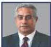
مهاجره وزير التعليم العالى