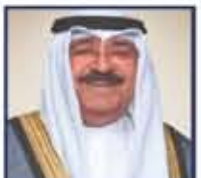
سعد الدين مشعل الأمين العام لحفظة الله رئيس الوزراء