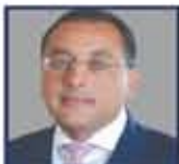
أحمد إسماعيل بهيواني رئيس مجلس الوزراء - جمهورية مصر العربية

يتقدم أحمد إسماعيل بهيواني بخالص الشكر والتقدير