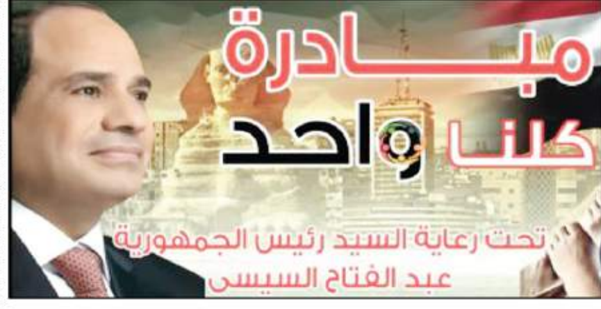
تحت رعاية السيد رئيس الجمهورية عبد الفتاح السيسي