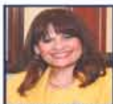
مهاجره وزيرة الدولة للتعاون الدولي والمغتربين والشؤون القانونية