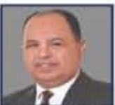
مهاجره وزير الداخلية