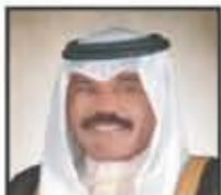
الكسيس بيدرو سانتشيز رئيس وزراء إسبانيا

يتقدم أحمد إسماعيل بهيواني بخالص الشكر والتقدير