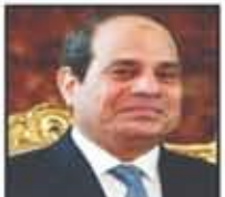
وقامته الرئيس عبد الفتاح السيسي رئيس جمهورية مصر العربية