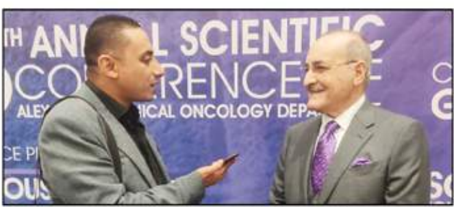
الشيخ عبد العزيز يتحدث لمحرم السوق العربية.

التي تعمل بها، وقد قطعت شوطاً كبيراً فى تحقيق الأهداف التى اختطت لها فى هذا المجال وفق رؤية واضحة المعالم بالتركيز على الاحتياجات الملحة للتنمية فى إطار من الشفافية الأخلاقية حتى أصبحت من المؤسسات الرائدة التى تبنت هذا الخط، وأكد أن المسؤولية الاجتماعية لمجموعة «روابى القابضة» لا تعنى مجرد المشاركة فى الأعمال الخيرية أو تنظيم حملات تطوعية فقط ولكن أيضاً المشاركة فى التنمية المستدامة، وأكد أن الشركة شاركت فى مؤتمر ACOD ٢٠٢٣ لأمراض السرطان إيماناً من دور الشركة بمسئوليتها الاجتماعية تجاه مرضى السرطان وترك بصمة فى علاج السرطان وترك بصمة تعود على المجتمع بخير أثر. ليكون خير الأثر، مشيراً أن مسئولية الإجتماعية جزء من القيم الأساسية لروابى القابضة.