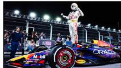
فيرستابن يواصل تحقيق أرقامه القياسية

مع إنطلاقة السباق النهائي الذي جاء مساء السبت بتوقيت لاس فيجاس وصباحاً بتوقيت منطقتنا العربية، تمكن فيرستابن من حطف المركز الأول من لوكايرك بعد أن اضطرت الأخير للخروج خارج المسار بسبب إغلاق فيرستابن الطريق عليه وهو ما حمل فيرستابن عقوبة 5 ثواني من المحكمين، بالوقت نفسه الذي شهد فيه السباق عدد من التصادمات بالإنطلاقة وهو ما غير من مواقع المتسابقين بالسباق وبشكل كبير، ولتبع ذلك الحادثة التي تعرض لها سائق ماكلارين لاندو نوريس وإنسحابه بعد إنزلاق سيارته خارج المسار وهو ما إستتبع دخول سيارة الأمان حتى يتم إزالة الأجزاء المتناثرة على سطح الحلبة، ومع انحصاف السباق وبالتحديد باللفة 26 من أصل 50 حدث تصادم بسيط بين بيريز الطائر بالسباق وسائق مرسيدس جورج راسيل وهو ما أدى إلى تآثر بعض أجزاء سيارتهما ولكتهما أكملتا السباق فيما تدخلت سيارة الأمان للمرة الثانية لإزالة تلك الأجزاء المتناثرة.. وبعد العديد من وفقات الصيانة لإستبدال الإطارات تمكن فيرستابن للعودة تدريجياً لصدارة السباق بعد أن تصدرها لعدة لفات كل من لوكايرك وبيريز على التوالي، ولتنتج المناهضة على المركز الثاني وبشراصة بين كل من بيريز ولوكايرك اللذان تبادلوا المركز حتى اللفة الأخيرة.. وليتمكن لوكايرك في الأمتار الأخيرة من حطف المركز الثاني من بيريز الذي قطع خط النهاية ثالثاً لينضم في النهاية إلى فيرستابن على منصة التتويج الجديدة من نوعها على أرض لاس فيجاس.