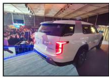
خطوط ضخمة وعصرية لخلفية توريس