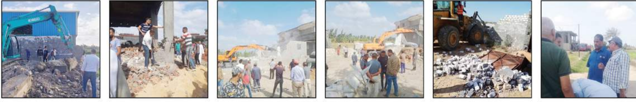
أثناء حملات وزارة الزراعة لإزالة التعديات

● إدارة حماية الأراضي بمديريات الزراعة تقبل درع الحماية للأراضي الزراعية من التعديات