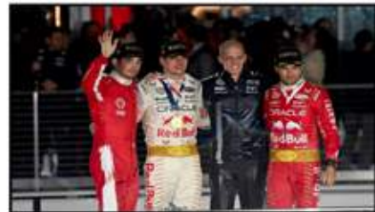
منصة فوز جائزة لاس فيجاس