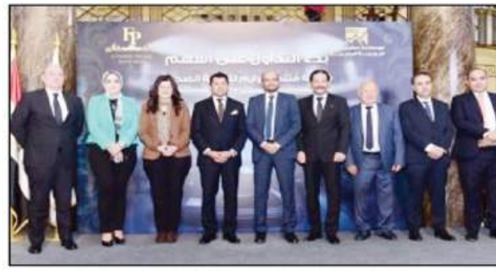
لجان العرض في سوق الأوراق المالية. وقال الدكتور أشرف صبحي، وزير الشباب والرياضة، إن الاستثمار الرياضى لم يعد ترفاً ولدينا خطط واضحة وطموحة للتحدث الشامل لكثير من المنشآت التابعة لوزارة والتطوير المستمر للخدمات المقدمة كما وكيفا.

وأضاف الشيخ، أن إدارة البورصة تعمل على جذب العديد من الشركات من قطاعات متنوعة للقيد في البورصة المصرية وذلك إثراء للسوق القطاعي للشركات المقيدة داخل السوق، مما يؤدي إلى تغطية أكبر عدد ممكن من القطاعات الفاعلة في الاقتصاد الوطني تدعيماً وتنمية