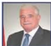
مهاجره مساعد وزير الخارجية والتعاون الدولي

كما نتقدم بخالص الشكر والتقدير لمهاجره الوزراء والمحافظين ورجال الصلك الديبلوماسية وأعضاء مجلس النواب المصري ورجال الأعمال والشخصيات الأدبية والفنية والرياضية وكذلك جميع وسائل الإعلام المصرية والكويتية والشخصيات الأديبة والثقافية والفنية والرياضية وذلك جميع وسائل الإعلام المصرية والكويتية كما نتقدم بالشكر والتقدير للزعماء والمشاركين من دولة الكويت وجمهورية مصر العربية حفظ الله مصر والكويت وشعبهما الكريمين