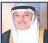
مهاجره مساعد وزير الخارجية والتعاون الدولي