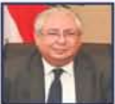
مهاجره مساعد وزير الخارجية والتعاون الدولي