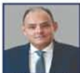
مهاجره وزير الخارجية والتعاون الدولي