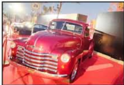
شاحنة شيفروليه الكلاسيكية الشهيرة