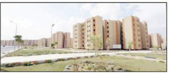
مشروع تطوير مدينة بدر وتحولها إلى مدينة ذكية بالتعاون مع مؤسسة كايند الكورية...