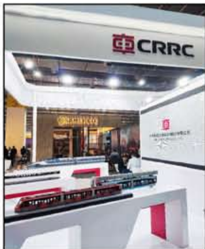
لوحدة قيادة مترو الأنفاق