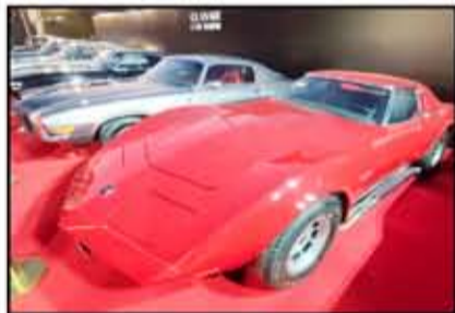
جانب من سيارات العطلات الأمريكية الكلاسيكية الشهيرة