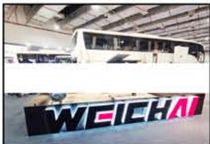
معرض جيوشى أحدث باصاتها العاملة بالغاز الطبيعي