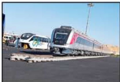
شهد المعرض المكشوف عرض القطارات الكهربائية العاملة