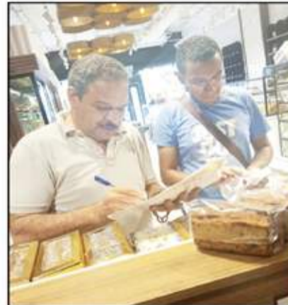
حملات الإدارة المركزية للسياحة على المنشآت