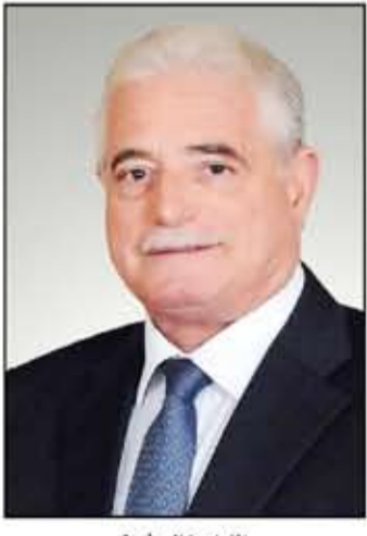
اللواء خالد فودة نجاحات خلال الدورات السابقة، وأكد اللواء فودة أن الأسبوع الكويتي في مصر يمثل جسراً

يحمل رياح الخير لكلا البلدين بما يرتبط به من اتفاقيات ونشاطات تجارية واستثمارية، وتطلع للمزيد من التعاون بما يسهم في توطيد العلاقات التجارية والاستثمارية والثقافية والإعلامية بين الكويت ومصر، ما يعد ترجمة حقيقية وانعكاساً لأفاق مستقبل العلاقات بين البلدين. وأضاف أن العلاقات بين مصر والكويت قوية ومتميزة ومتميزة وتشهد توافقاً وتطابقاً في جميع الرؤى على المستويات جميع، كما أنها تغطي جميع المجالات، بما يؤكد أن هناك نمواً مطرداً للتعاون، يأتي انعكاساً للإرادة المشتركة وللدفعة القوية التي اكتسبتها هذه العلاقات على مدار العقود الماضية، والجهد الذي لا يتوقف لتطويرها من جانب القيادة الحكيمة في كلا البلدين الشقيقين، وهناك تعاون وتكافل وتأزر في السراء والضراء.