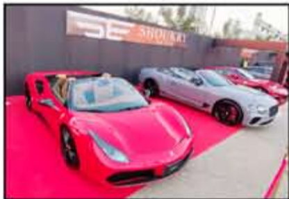
شركة شكري إيليت عرضت مجموعتها للسيارات السوبر رياضية