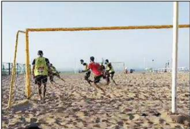
جانب من تدريبات المنتخب