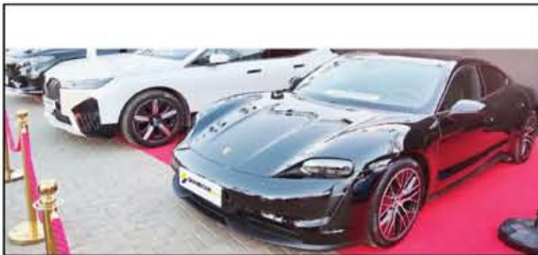
حضور قوي لشركة غندور أوتو مع السيارات الكهربائية