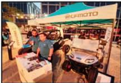
متجر قدمت أحدث سيارات ملاعب الجولف

استضافت كايرو فستيفال سيتي معرضاً لعدد من السيارات الفاخرة والسوبر رياضية (EXOTIC) وكذلك عدد من السيارات الكلاسيكية النادرة، في حدث يعد هو الأول من نوعه في مصر، بما يمثل تجربة استثنائية تعرض الأذواق المتنوعة للسيارات الفاخرة والنادرة في مصر. وجمعت فعاليات المعرض بين عشاق السيارات الفاخرة وأصحابها، إلى جانب مشاركة 10 من أبرز تجار السيارات بهذا القطاع، وذلك في أجواء مليئة بالحماس والتنافسية من خلال منح الحضور إمكانية التصويت في مسابقة أفضل أداء، أفضل تعديل، أسرع سيارة مع الفرصة للفوز بجوائز متنوعة. ويعد هذا المعرض إضافة مميزة لأنشطة كايرو فيستيفال سيتي