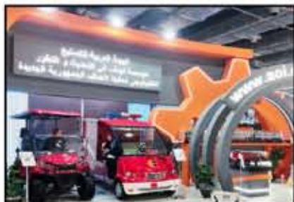
جانب من جناح الشركة الصينية للتصنيع