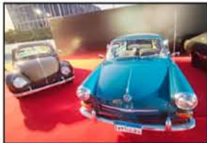
كلاسيكيات شركة فولكس فاجن