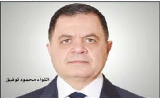
اللواء محمود توفيق

بدء الاختبارات 11 نوفمبر الجاري ويمنع المتزوجين.. ويحصل المتقدمين على مميزات أبرزها المكافأة الشهرية