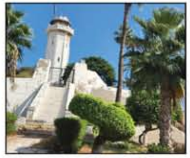
تسويق حدائق كوم الناصورة