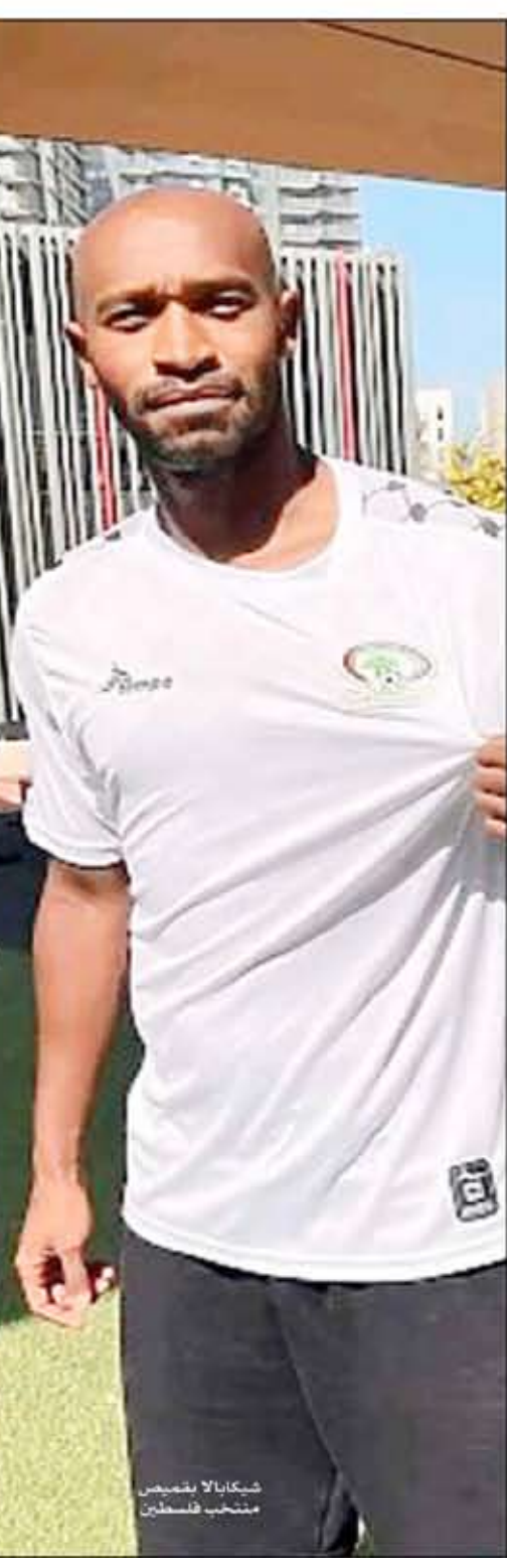
شيكايبالا قميص منتخب فلسطين