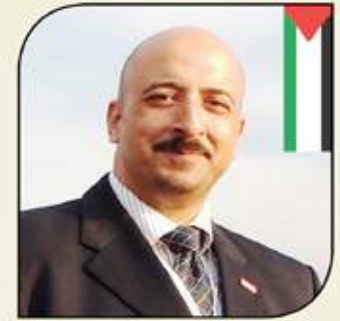
بقلم: أشرف كار

لا شك أن (كارثة) غزة الأخيرة بدولة "فلسطين المحتلة" قد أرخت بظلالها السوداء ليس فقط على الشعب الفلسطيني الأعزل، ولكن على جميع أقطار الأمة العربية والإسلامية والمسيحية على حد سواء، فمع تزايد نزيف دماء هذا الشعب المحتل لأكثر من خمسة وسبعين عاماً وتراخي المجتمع الدولي تجاه قضيته المتجددة في التعقيد.. باتت أزمة الشعب الفلسطيني بصفة عامة وكارثة غزة الأخيرة بصفة خاصة هي الشغل الشاغل لجميع أقطار العالم الباحثة عن مخرج لهذه الأزمة.. ليس فقط على المستوى الإنساني، بل وأيضاً على المستوى الاقتصادي الذي بدأ يضرب بدوره العديد من الاقتصاديات العربية وخاصة لدول الجوار لدولة فلسطين المحتلة.. ونحن هنا في مصر - الأقرب حدودياً لغزة - قد أصبحنا نعانى من تأثيرات ما يحدث هناك (خاصة على المستوى الاقتصادي) سواء على مستوى تأثر السياحة بوضع المنطقة الأمني أو توقف ضخ شحنات الغاز الإسرائيلي لمصر وتأثيره غير المباشر على الطاقة وانقطاع التيار