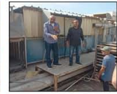
التجهيز للمرحلة الثانية لصيانة أوبرا