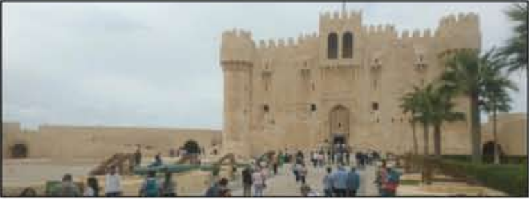
قايتباي تشهد إقبال كبير من السائحي