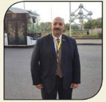
بقلم: أشرف كار

من خلال زيارتي الأخيرة للمعرض العالمي للباصات والحافلات وصناعاتها الغذائية "busworld Europe" والذي عاد إلى المشهد من جديد بالعاصمة البلجيكية (بروكسل) وبعد غياب دورته السابقة عام 2021 بسبب جائحة كورونا - من منطلق تنظيم دوراته مرة كل عامين - وبغض النظر عن ما شهدته المعرض من تطور هائل بتكنولوجيات صناعة وسائل نقل الركاب ومستلزماتها والتي يغلب عليها التحول - شبه التام - إلى المركبات النظيفة سواء العاملة بالكهرباء أو الهيدروجين.. بخلاف التي باتت تتحلى منها بالقيادة الذاتية (autonomous)، فقد كانت ملاحظتي الأهم ما يخص الشركات المصرية المشاركة بالمعرض من رؤيتهم الإيجابية ومقدار ما تم استثماره من أموال للإنفاق على تلك المشاركة. فمع مشاركة ثلاث شركات مصرية متخصصة بهذا القطاع وهي (MCV) لصناعة الباصات، (جيوش) لصناعة الباصات، و(تراست) لصناعة مقاعد الباصات والحافلات.. اتضح أهمية