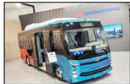
جانب من ترحيب الصينة أعلنت عن تحديثاتها الجديدة بعالم الباصات