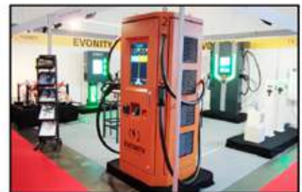
العديد من شركات المشاهير، شارك بالمعرض