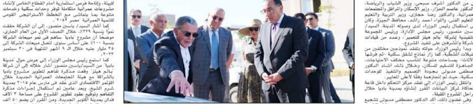
رئيس الوزراء يتفقد الأعمال النهائية للمرحلة الأولى من مشروع «مدينة باديا» بأكثوبر الجديدة، بحضور الدكتور مصطفى مدبولي، وزير الإسكان والمرافق والمجمعات العمرانية، وزير التخطيط الاقتصادي، وزير البيئة، وزير الصحة، وزير الزراعة، وزير التعليم، وزير الشباب، وزير السياحة، وزير النقل، وزير التموين، وزير الداخلية، وزير العدل، وزير الأوقاف والشؤون الإسلامية، وزير التعليم العالي والبحث العلمي، وزير الدولة لشؤون الإسكان والمرافق والمجمعات العمرانية، ووزير الدولة لشؤون التخطيط الاقتصادي.