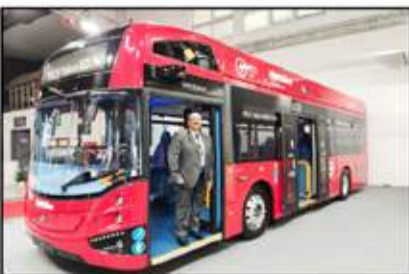
أحدث باصات إيس في - الفولفو الموجهة للأسواق الإنجليزية

شعب المعرض يومياً، كامله، للملابات الصحافية