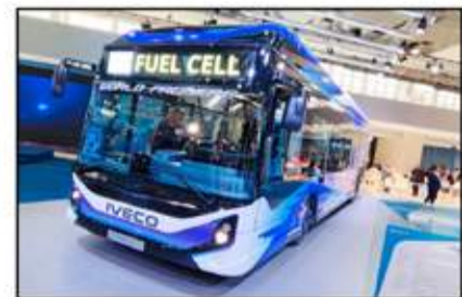
أطلقت إيفيكو حافلها الجديدة العاملة بالهيدروجين