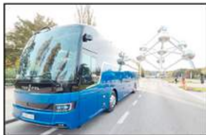
حائز من مشاركة باصات فاناما، بالمعرض، الكشف