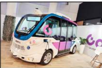
حضور وفد الباصات ذاتية القيادة