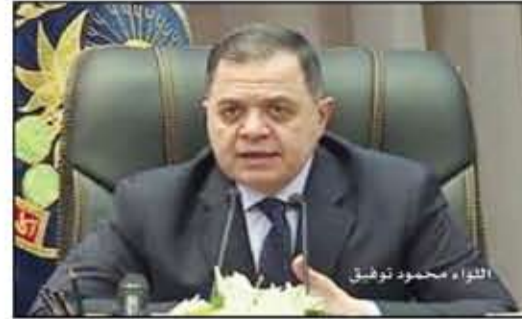
الوزير محمود توفيق

أعلنت وزارة الداخلية بدء قبول طلبات التقدم لأداء فريضة الحج لعام ١٤٤٥ هـ / ٢٠٢٤، على أن يتم إجراء قرعة الحج علنية من خلال البوابة المصرية الموحدة للحج لكافة المتقدمين بمديريات الأمن وفقاً للجدول الزمني الذي سيعلنه عن الإدارة العامة للشؤون الإدارية. وبدأ التقديم لـ حج القرعة والتي حددتها وزارة الداخلية اليوم الأحد ويستهدف الشروط التالية والتي حددتها وزارة الداخلية اليوم الأحد ويجب على المواطن أن يختار الجهة التي يريد الحج من خلالها (قرعة سياحة - تضامن)، في ضوء توحيد جهة تسجيل بيانات المتقدمين للحج، يكون التقديم لـ حج القرعة ٢٠٢٣ مرة واحدة فقط لأي من الجهات المنظمة للحج، وبمجرد غلق باب التقديم بعد الطلب مدرجاً ضمن قرعة تلك الجهة فقط ولن تقبل له طلبات أخرى على أي جهة منظمة للحج، ولا يجوز إلغاء الطلب والتقدم إلى أية جهة أخرى عقب إجراء قرعة الحج ٢٠٢٣.