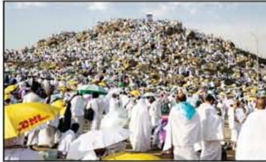
التكاليف تلغى فرصة الحج للمرافق.

ويتمدد في تحديد سن مقدم طلب الحج تاريخ ٢٠٢٤/٣/١ م وبالنسبة لطلب الحج الزوجي يكون المرافق لمقدم الطلب (من سن يوم فاكتر) ومن الأقارب حتى الدرجة الرابعة، ويشترط تقديم مستند صلة القرابة «حال الفوز بالقرعة» وفي حالة عدم إمكانية إثبات صلة القرابة بين مقدم الطلب والمرافق غير الوجوبي له، تلغى فرصة الحج للمرافق فقط دون أدنى مسؤولية على وزارة الداخلية، ويتم الإبقاء على فرصة الحج الخاصة بمقدم الطلب. في حالة عدم إمكانية إثبات صلة القرابة بين مقدم الطلب من ذوي الهمم والمرافق الوجوبي له يطلب من مقدم الطلب الفائز ترشيح مرافق بديل بذات الشروط، وفي حالة عدم إستيعابه ذلك يلغى طلب الحج كاملاً دون أدنى مسؤولية على وزارة الداخلية. - يسمح بسفر المرافق (الوجوبي) ممن تطبق عليه الشروط الواردة بالكتاب الدوري ولم يسبق له أداء الفريضة طوال حياته في حالة وفاة الأصيل، أما في حالة تنازل الأصيل عن فرصة الحج الفائز بالتزكية ضمن نسبة (٣٪) فيسمح فقط بسفر المرافق (الوجوبي) إذا كان التنازل بعد سدادهم للتكاليف، أما إذا كان التنازل قبل سداد