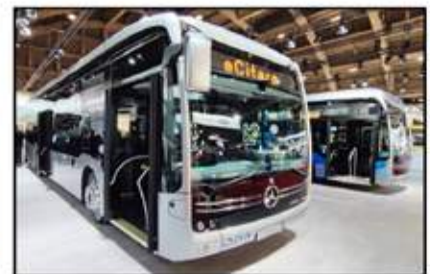
حافلة مرسيدس (إي سيتارو) الفائزة بلقب الأفضل لعام 2023