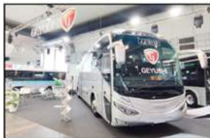
تصدر باص جيوش السياحي جناح عرض الشركة