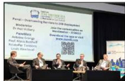
جانب من جلسات مؤتمر الباصات النظيفة