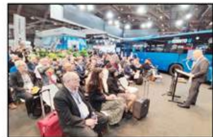
شعب المعرض يومياً، كامله، للملابات الصحافية