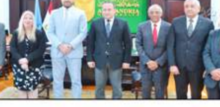
وفد السفارة الأمريكية مع رئيس جامعة الإسكندرية

دعم منظومة التنمية المستدامة، وتعمل الجامعة جاهدة للتعاون مع الجهات البحثية الكبرى وتيسر للمبادرات المختلفة لخلق اقتصاد منخفض الكربون zero emission. فيما أكد السيد وزير هارتوتيان حرص السفارة الأمريكية بالقاهرة على توطيد العلاقات مع جامعة الإسكندرية، لاسيما ولأنها تعد من الجامعات الرائدة في الشرق الأوسط ولديها برامج متخصصة علمية متقدمة، مضيفاً أنه سيتم عقد شراكات بين الجانبين في المجالات ذات الاهتمام المشترك، فضلاً عن تسهيل التبادل الأكاديمي على مستوى أعضاء هيئة التدريس والطلاب، وأكد أن السفارة الأمريكية بالقاهرة ستقوم بدعم ومساعدة الطلاب في دعم وتوطيد الاقتصاد القائم على المعرفة، وعقد بروتوكولات واتفاقيات تعاون في مجالات البحث العلمي والدرجات العلمية المزدوجة في مرحلتى البكالوريوس والدراسات العليا.