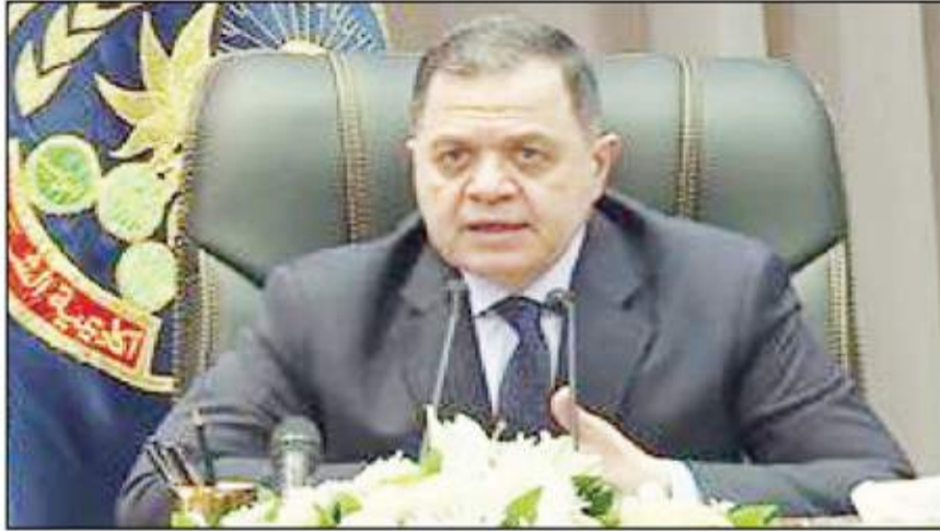
اللواء محمود توفيق

التوفيق والسداد ولمسيرة سيادتكم المعطاءة المزيد من التقدم والإرتقاء .. إننا إذ نحتفل بهذه الذكرى التي نستلهم منها قيم العطاء والتضحية والفاء التي علمنا إياها صاحب الذكرى العطرة صلى الله عليه وسلم حين سعى لتأسيس دولة الإسلام على ركائز الحق والعدل والمساواة .. لتؤكد على مواصلة رسالة الأمن ، والمساهمة بفاعلية في مسيرة الوطن المبدى نحو تحقيق التنمية والتقدم والرخاء .. كما بعث اللواء محمود توفيق ببرقية تهنئة للدكتور مصطفى مديولى رئيس مجلس الوزراء .. جاء بها - يسرني لى هيئة الشرطة في مناسبة الاحتفال بذكرى المولد النبوي الشريف أن أتقدم لسيادتكم بأطيب الأمنيات وأصدق التهاني .. إن إحتفالنا بميلاد سيد خلق الله المصطفى عليه افضل الصلاة والسلام يأتي تجسيدا للمشاعر الراسخة في وجدان أمنا الإسلامية لتأخذ من صاحب الذكرى العطرة الأسوة والقوة الحسنة في إرساء القيم السامية لدعوة الإسلام .. نسأل الله العلى القدير أن يبارك جهود سيادتكم ويسدد خطاكم للوفاء بمسئولياتكم الوطنية وأن يعيد هذه المناسبة الكريمة ومصر في تقدم وإزدهار . وكل عام وسيادتكم بخير .. كما بعث وزير الداخلية ببرقية تهنئة لفضيلة الإمام الأكبر الأستاذ الدكتور أحمد الطيب شيخ الأزهر .. جاء بها - يسرني لى هيئة الشرطة بمناسبة الاحتفال بذكرى المولد النبوي الشريف أن أعرب لفضيلتكم عن أخلص التهاني وأسمى الأمنيات داعياً المولى