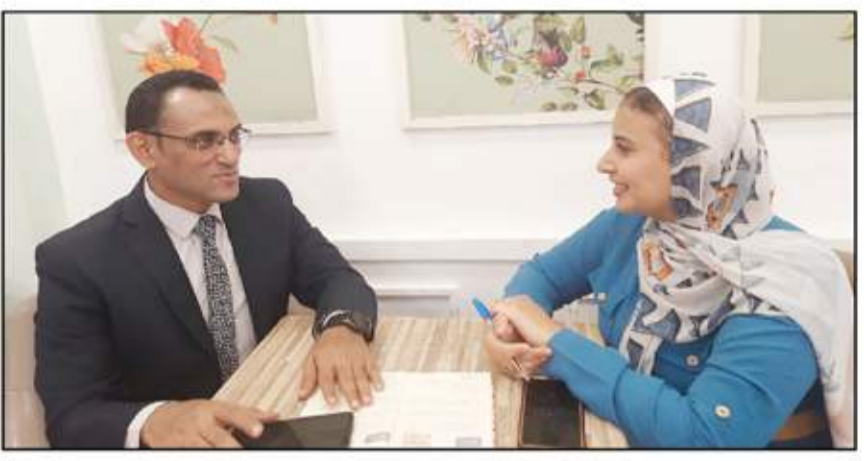
د. أحمد شوقي يتحدث لمحرة السوق العربية

الانضمام رسمياً إلى بريكس يفتح الأبواب أمام تساؤلات حول جدوى العضوية، وما ستجنيه مصر من هذه الخطوة، وهل سيكون انضمام مصر لمنظمة بريكس تأثيراً إيجابياً على الاقتصاد المصري، ويساهم في تعزيز الاستقلالية المالية والاقتصادية للدول الأعضاء، وذلك قامت جريدة السوق العربية بإجراء حوار مع أحمد شوقي الخبير المصرفي الدكتور أحمد شوقي، لتسلط على هذه الأمور، وما المكاسب التي ستعود على مصر بشكل عام والقطاع المصرفي بشكل خاص من انضمامها لبريكس، إضافة إلى ما تأثرت انضمامها أيضاً على السوق المالية، والذهب والأسعار، والعملية المحلية، وإلى نص الحوار.