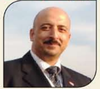
بقلم: أشرف كاره