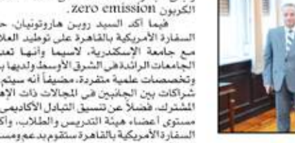
وفد السفارة الأمريكية مع رئيس جامعة الإسكندرية