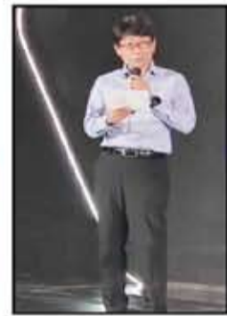
هيرانسان - ممثل سوزوكي اليابان