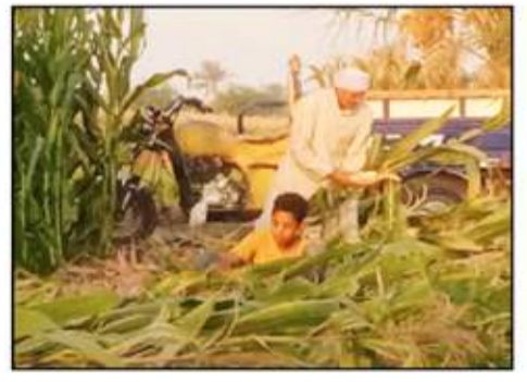
محررو السوق العربية مع الفلاحين وسط محاصيل الذرة الشامية