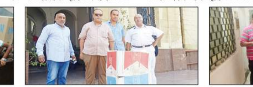
أثناء تحرير السجائر المضبوطة خلال حملات تموين الإسكندرية على المحلات