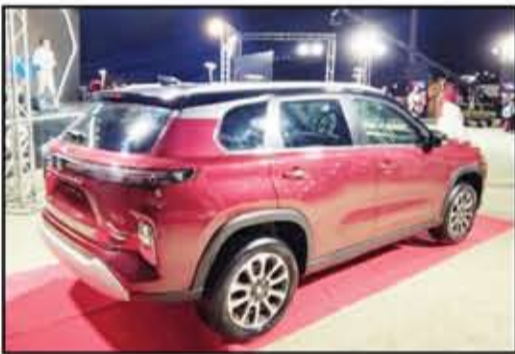
خطوط جراند فيتارا الخلفية