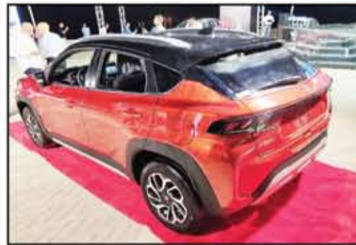
خطوط رياضية خلفية فرونكس