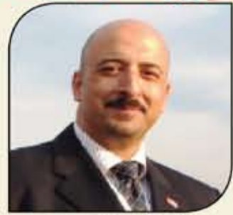
بقلم: أشرف كاره

فالبداية تأتي من بوابة مصر السياحية وهي المطارات... فقد أصبح السائح الواحد إلى مصر يعاني (الأميرين) .. إما أن لا يجد منظومة معترف بها للتاكسي الرسمي للدولة عندما يخرج من صالات مطارات