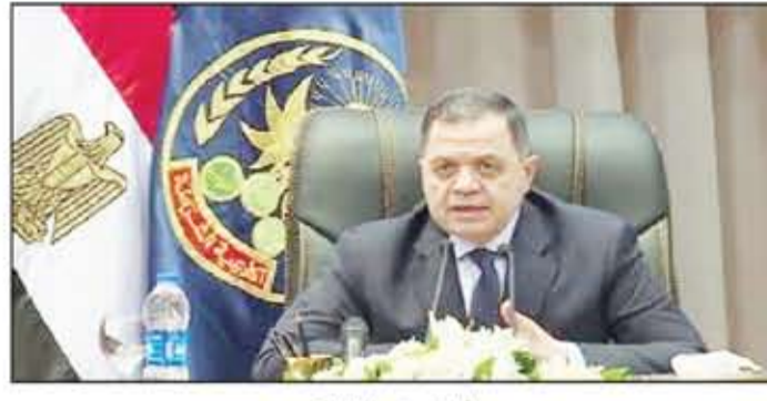
اللواء محمود توفيق