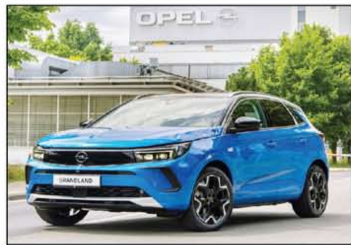
أويل جراند لاند

أطلقت مؤخراً شركة المنصور للسيارات جيلها الجديد من سيارة أويل SUV (جراند لاند) التي جاءت بتصميم أكثر شبابية ورياضية من الجيل السابق مع مجموعة من الخطوط التصميمية المميزة والتي قامت شركة أويل بإنتاجها مع جميع سيارات الشركة بالسنوات الأخيرة. وقد جاءت السيارة بأبعاد كبيرة في فئتها حيث بلغت قاعدة عجلاتها ٢٧٧٠ مم بينما بلغ طولها ٤٤٧٧ مم وعرضها ١٩٦٠ مم وارتفاعها ١٦٢٠ مم، فيما جاءت بخلوص (ارتفاع عن الأرض يبلغ ١٦٢ مم، في الوقت نفسه الذي جهزت فيه السيارة بمجموعة كبيرة من تجهيزات الفخامة والعمليانية. وعلى الجانب الميكانيكي، فقد جاء محرك جراند لاند رباعي الأسطوانات سعة 1.٦ لتر، قادر على استخراج طاقة قصوى تبلغ ١٦٢ حصان / ٥٥٠٠ د.و. ويبلغ أقصى عزم دوران له 2٤٠ نيوتن متر / ١٧٥٠ د.و. فيما جاء صندوق سرعات السيارة الأوتوماتيكي مع ستة سرعات، وتصل سرعة السيارة القصوى إلى 2٠٠ كم/س. فيما تتسارع من 0 - 1٠٠ كم/س خلال زمن لا يزيد عن ٨.٦ ثانية. وقد قامت شركة المنصور للسيارات بتقديم السيارة في فئتين، أولها حمل تسمية High Line وبسعر بلغ 1.٤٩٩.٩٩٠ ج.م، فيما جاءت الفئة الأعلى بتسمية Top Line وبسعر 1.٥٩٩.٩٩٠ ج.م.