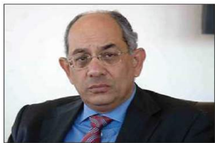
يوسف بطرس غالي

بإهدار المار العام والمعروفة إعلامياً بـ«فساد الجمارك»، وقضت المحكمة ببراءته وانقضاء الدعوى الجنائية بالتصالح بعد تسديد ٢٥ مليوناً و٧٩١ ألف جنيه وغرامة مساوية لقيمة هذا المبلغ.