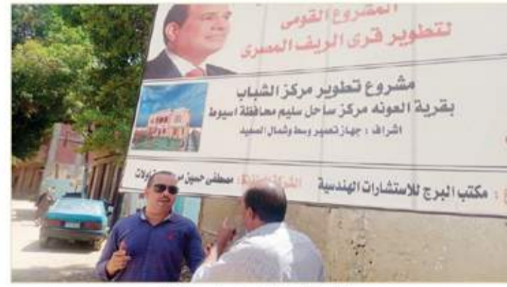
محرر السوق العربية يتحدث مع أحد المواطنين

وفي هذا السند قال اللواء هشام آمنة وزير التنمية المحلية انه على مدار ٩ سنوات منذ تولي الرئيس السيسي الرئاسة ودع صعيد مصر عنوة من الازمات والحربان والتهيش بفضل ثورة ٢٠ يونيو التي وضعت صعيد مصر على رأس اولويات جميع وزارات ومؤسسات الدولة، وامضى وزير التنمية المحلية قائلا : وتجسد ذلك بصورة كبيرة في المرحلة الاولى من المبادرة الرئاسية «حياة كريمة» والتي بلغت محافظات الصعيد المستهدفة فيها حوالي ٦٨ ٪ من المرحلة الاولى وتم تنفيذ مشروعات بها بحوالى ٢٤ مليار جنيه، بالإضافة إلى الاستثمارات التي نفذتها وزارات الدولة المختلفة في جميع القطاعات المعنية، كما أنه في لقاؤه الأول مع قيادات البنك الدولي منذ ثمان سنوات طلب الرئيس السيسي تعاون البنك مع الحكومة لتنفيذ برنامج هريد من نوعه يهدف لأحداث تنمية شاملة ومستدامة في محافظات الصعيد وتحولها من محافظات تطوّر تدهول تدهول تدهول تدهول والتنمية البشرية إلى محافظات قادرة على جذب الاستثمارات وتوفير فيها مقومات التنافسية والتنمية المستدامة.