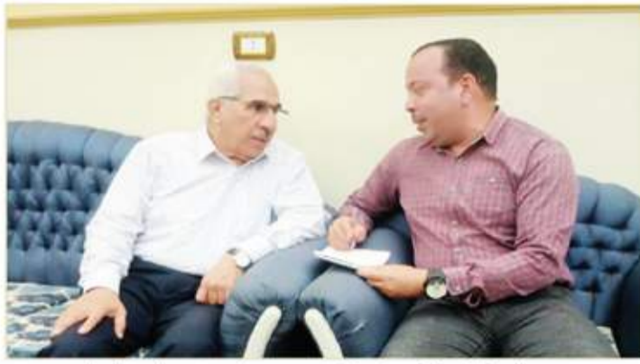
محرر السوق العربية يتحدث مع المهندس مجدى سليم عضو مجلس الشيوخ

بمجلس الشيوخ المهندس مجدى سليم ان المشروعات التوسعية التي تمت في الصعيد خاصة بانها اعجاز لم يشهده منذ خمسين سنة حيث شهدت محافظات الصعيد مشروعات قومية عملاقة وانجازات غير مسبوقة منذ تولي الرئيس السيسي رئاسة البلاد وتبقى المبادرة الرئاسية «حياة كريمة» مشروع القرن العملاق الذي حقق احلام اهالي القرى والريف .