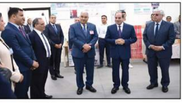
في تكنولوجيا لشغل وصيانة ماكينات الغزل والنسيج، وتكنولوجيا الجرارات والمعدات الزراعية، وتكنولوجيا الصناعات الغذائية، وتكنولوجيا السكك الحديدية، وتكنولوجيا المعلومات، وكافة

تكنولوجيا العلوم الصحية ببرامج في الترميز والمعدلة، وهي واحدة من ٧ جامعات تكنولوجيا جديدة بدأت الدراسة بها بمنطقة الجامعات ببرج العرب الجديدة بالإسكندرية، ضمن توجه الدولة لإنشاء جامعات تكنولوجية بأحدث النظم العالمية، لتأهيل الطلاب لتلبية متطلبات سوق العمل المحلية والإقليمية والدولية في القطاعات الأكثر تطوراً وتكنولوجياً. وأوضح الرئيس في كلمته خلال لقاءه بعدد من الأهالي والقيادات الشعبية بمحافظة البحيرة، على هامش افتتاح عدد من مشروعات حياة كريمة، في قرية الأمامية، إن الجامعات الجديدة التي تم إنشائها خلال السنوات الـ ٦ المقبلة، تكفي احتياجاتنا حتى عام ٢٠٥٠. وقال الرئيس السيسي، إن مبادرة قوائم الانتظار استماعت الوصول إلى ٢ مليون مواطن بكلفة ٢٠ مليار جنيه في ٤ سنوات. وتابع الرئيس السيسي: الأرض الزراعية في مصر كتر لازم نحميها. وأوضح أن التموين يمشي ٧٠ مليون مصري. متابعاً، الأرز اللي بيشره من الفلاحين بيروح للتموين. وفيما يتلقى بالفتح، قال الرئيس السيسي: الإنتاج في مصر ممكن يمشي ٨ أو ٩ أو ١٠ ملايين طن. وحد يتولّى أصل إحنا في ريف. عندنا التعم هي البيت بتعمل بيه مناسبات... التي خدناه لحد