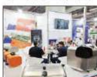
إقبال كبير لقطع الشاحنات مع توفير عجلات الورش الخاصة بها