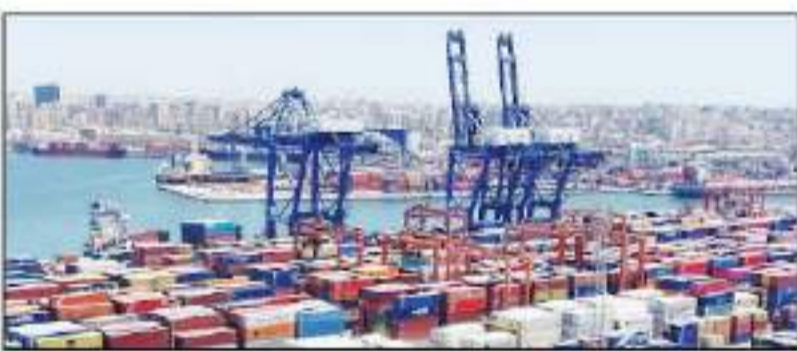
على الرصيف بطول السفينة لمنع حدوث التلوث أو أحداث تلوث بالرصيف، كما يتم وضع أوعية معدنية بمنطقة التجميع ومساحة إسفنجية لمنع حدوث التلوث أو إحداث تلوث بالرصيف، وأن تكون المنطقة خارج حرم الطريق.

البناء، وكذا عدم تحميل السيارة حمولات زائدة (عدم التصويب) ويتم تغطية وتشفيع السيارات على الرصيف قبل تحريك الشاحنات، وضعت التعليمات إلى ضرورة أن يتم عملية التنظيف السوية للأرصفة أثناء وطور الانتهاء من عملية الشحن والتفريغ لإزالة التربة الفحم والتأكد من سلامة الشاحنة وعدم وجود أي تسريب بها حتى لا تتساقط التربة على الطريق، وضرورة تنظيف السيارات بعد التفريغ داخل الميناء بأجواء منع تآثر الجسيمات على الطريق، وكذا التأكيد من عدم وجود بعض من البضائع على أرضية الرصيف أو ببناء أو على القنطرة، بالإضافة إلى الالتزام بأي تعليمات واشتراطات مستجد طبقاً للموقف.