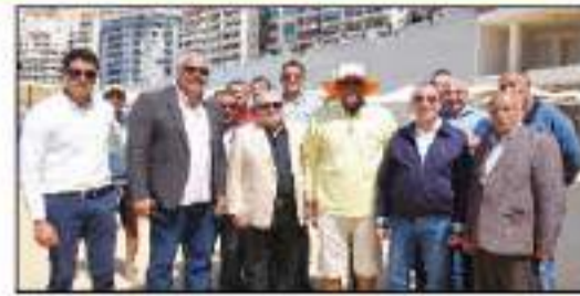
محافظة الإسكندرية وتفتتح شواطئ المطبخ الشرقي