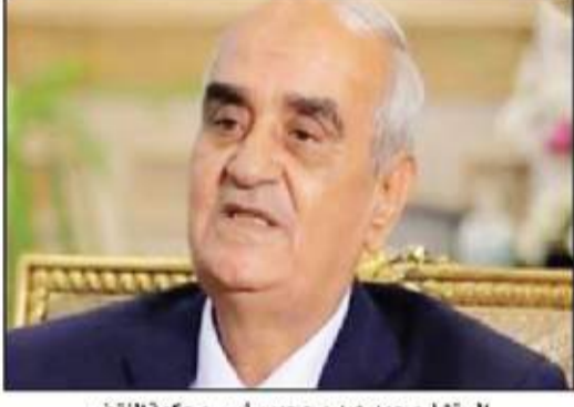
المستشار محمد عيد محجوب رئيس محكمة النقض