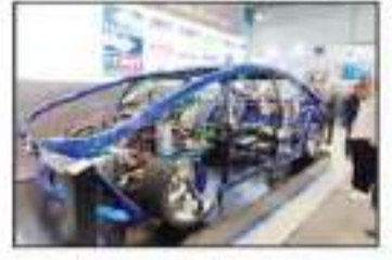
حضور واضح لشركات التكنولوجيا الخاصة بالسيارات