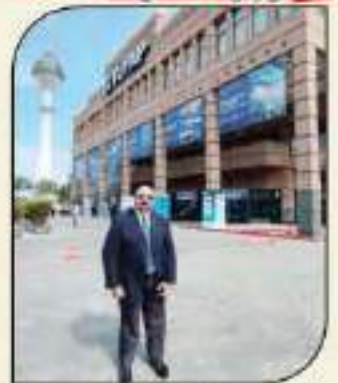
بقلم: أشرف كاره

لم تكن زيارة السنوية الأخيرة لمدينة إسطنبول التركية لحضور فعاليات المعرض الدولي السنوي لقطع الغيار والصناعات المعدنية للسيارات ومعدات الورش ومحطات الخدمة (أوتوميكانيكا إسطنبول - automechanika Istanbul) ... زيارة ذات رؤية أو نتائج تقليدية بحسب ما قد يعتقد البعض 13 يوم فالتشاهد والمتابع العامي لبطل هذه التوعية من المعارض يرى أنها مجرد تجميع تجاري لسدوي للشركات المحلية والعالمية العاملة بهذا القطاع لتبادل الخبرات والاستعراض الجديد من المنتجات ... ولكن المبرور أبلغ وأوقع من ذلك بكثير فمع نسبة نمو أعداد المشاركين بالمعرض تخطت نسبتها الـ 175% عن الدورة السابقة لعام 2022 بتخطي عدد الشركات المشاركة لرقم 1438 شركة عارضة، بخلاف نسبة النمو الإيجابية بعدد أجنحة الدول الوطنية، وذلك علاوة على نسبة الحضور والزيرة المتخصصة من العاملين والمتخصصين بالمجال والذين تخطوا حاجز الـ 58.000 زائر ... كذلك جيمه (واكثر) إنما يعنى مؤشراً إيجابياً لتحسين السوق التركي ومن خلفه