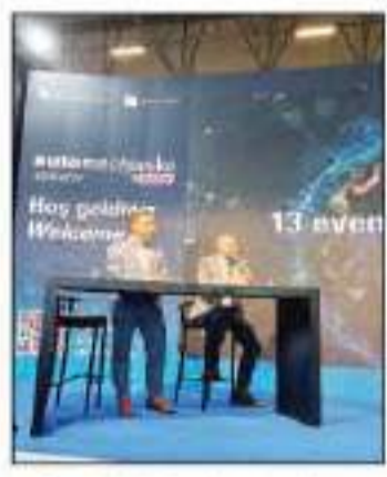
شهد المعرض عدداً من الندوات التثقيفية