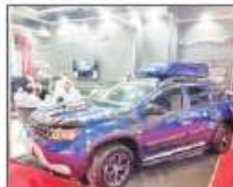
شركات إكسسوارات السيارات رعاية الانتعاش