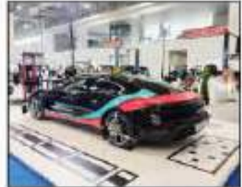
خدمات كبيرة لخدمات السيارات الكهربائية