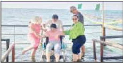
رئيس نادي الهيم