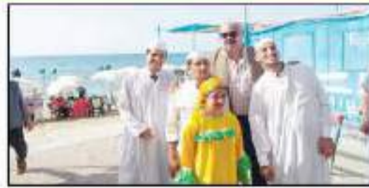
رئيس المركزية للسياحة يستقبل إحدى الجمعيات على شاطئ القندرا لمتاحي