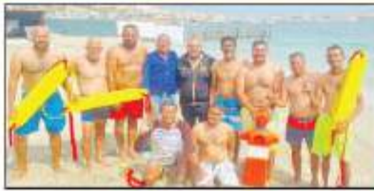
أثناء المبادرات التوعوية لرفع كفاءة المتدربين العاملين بالشواطئ