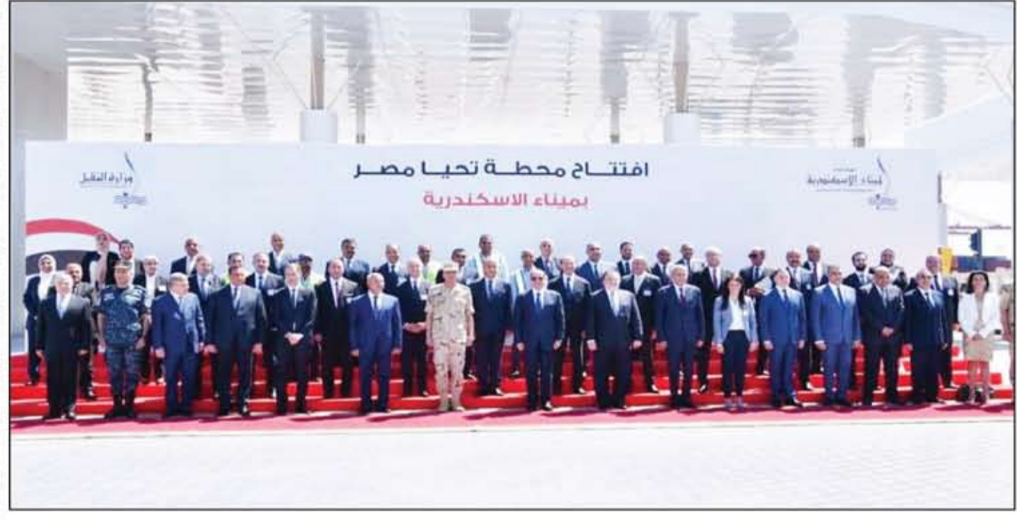
افتتاح محطة تحيا مصر بميناء الإسكندرية

الرئيس السيسي يشهد افتتاح محطة تحيا مصر متعددة الأغراض بميناء الإسكندرية