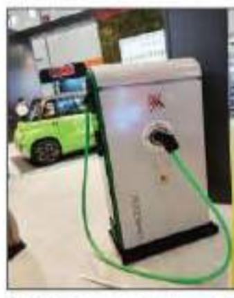
كان لقطع السيارات النظيفة وخدمات الشحن الكهربائية حضوراً واضحاً