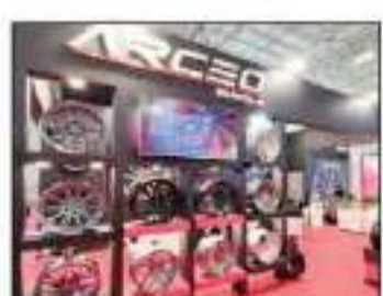
العجلات المتعددة الرياضية