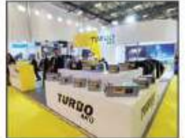
نجاح واضح لقطع بطاريات السيارات