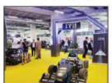
مناخة كبيرة من إقبال العرض لمنتجات طلبة كليات الهندسة