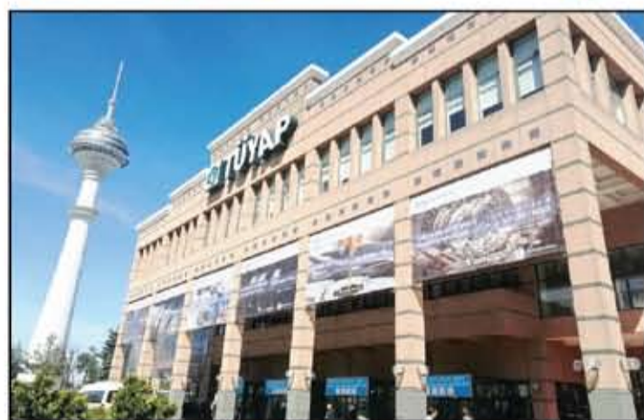
الدخل الرئيسي للمعرض