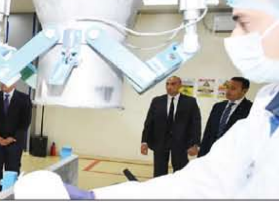
الرييس يتفقد مصنع الشرقية لسكر بمدينة الصناعية الجديدة

المشرفة من عمال مصر خلال الاحتفال بعيد العمال بمدينة الصناعية الجديدة بمحافظة الشرقية. خيراً، الدولة تبال مجهود كبير للحفاظ على المواطن من الأزمات العالمية.