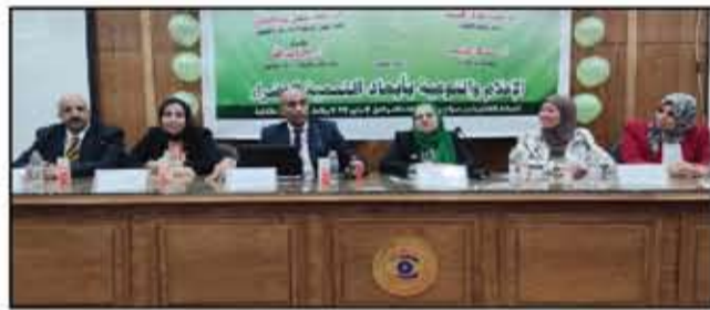
إنشاء مجريات الندوة