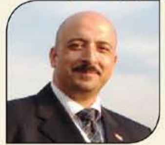
بقلم: أشرف كاره

لأحد أكبر منتصتين في مجالهما .. الأولى بمجال تصنيع الصواريخ ومنها الفضائية مع شركة (سبايس إكس - SPACE X)، والثانية مع منصة (تويتر) الضخمة للتواصل الإجتماعي، وما لذلك من فوائد إستراتيجية على المستوى الدولي بين الدول. اعتقد يا أستاذ/ أشرف، إن هذه الأخبار تستعديك للغاية وخاصة مع اهتمامك المستمر بالدعوة للانسارعة بوصول مصر للمصاف العالمية بقطاع السيارات .. بل والشوق عليها ، وهو ما أطمئنتك بأنه سيتم ترجمته في معرضكم المؤجل تنظيمه للعام المقبل 2024 (Green Mobility Technology Expo) - أو المعرض الدولي لوسائل النقل النظيفة والتكنولوجيا المستدامة) والذي سيحظى بدعم وعرض باكرة هذا المشروع الإستراتيجي الكبير، بخلاف ما سيتبعه من مشروعات مشابهة لاحقة. هنا انتهت هذه المقالة غير العادية، والتي كانت من أفضل المقالات الهاتقبة التي قمت بتلقيها في حياتي. وما هي إلا ساعات بسيطة لاستيقظ من هذا "الحلم الرائع" بعد ليلة مليئة بالأرق تشكيراً في ردود أفعال الحضور بالندوة التي حاضرت بها بجامعة القاهرة، ومدى تفاعل الحضور الإيجابي مع الأفكار والتوصيات التي تم طرحها بتلك الندوة، واستمراري بالتفكير فيما إذا كان هذا الحلم (القابل للتطبيق وبسهولة) من الممكن أن يدخل لحيز التنفيذ قريباً؟