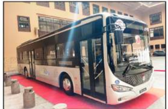
باص جيوشى الكهربائى الجديد طراز - زد ٢٠٧ إي في