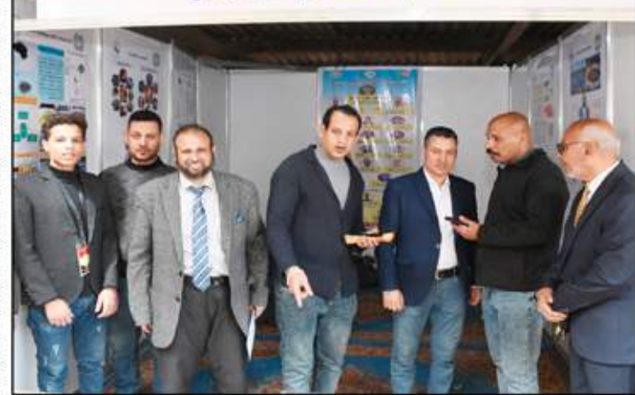
جولة محروى السوق العربية داخل المعرض

المادة التبرجينية التى تكون سامة بالنسبة للأسماك الموجودة فى المياه يكون فيه أحواض يتقع فيها الأسماك والسمك يتغذى على الأعلاف ويوجد مانور فى المياه لرفع المياه داخل المواسير يقوم النباتات بالتخلص من هذه المواد ويمتصها وينمو عليها ويستخرج بعض النباتات الورقية والخضراوات مثل الجرجير واللفل.. النموذج الثانى «الياقوت» هو بكتيريا هوائية وتنمو عندما نضيف لها مصدر غنى الكبريتيدرات، وعندما تنمو هذه البكتيريا يكون لها فائدتين تنمو هذه البكتيريا النسبة العالية من الكبريتيدرات التى تكون فى بعض المواد مثل الشئ والملابس وخلة القمح وغيرها نضيفها للمياه وتنمو وتقتضى على المواد الموجودة فى المياه، وتعتبر غذاءً بالنسبة للأسماك وكذلك من الأغذية المعروضة نبات «الازولا» يعتبر غذاءً للأسماك وهو على وجه المياه ويقضى على المواد الضارة بالمياه أيضاً لدينا الكيدفيس «القرموط الأفرقيسى» ومنه أنواع كثيرة وهو سمك ممتاز يعتمد على الوسط الذى يعيش فيه لو المياه نظيفة تكون سمكة نظيفة لو المياه ملوثة تكون سمكة سيئة