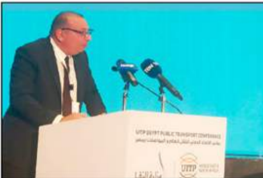
د. هشام طه - رئيس مواصلات مصر