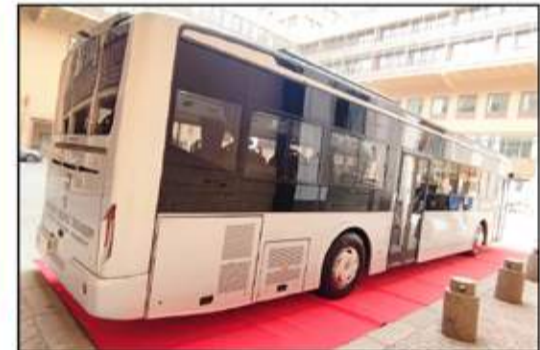
تصميم متطور لباص جيوشى الكهربائى الجديد