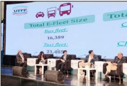
جانب من جلسات المؤتمر