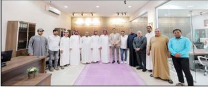
افتتاح الفرع الجديد في القصيم

العقاري أصبح ضرورة يفرضها التوسع العمراني الذي تشهده مصر حالياً، والتوسع في تنفيذ مشروعات مصرية بمواصفات عالمية تتناسب مع اختيارات العميل الأجنبي، مشيراً إلى أن الشركة تعظم لتحقيق نسبة مبيعات قوية لمشروعاتها من خلال هذا الفرع الجديد. وأوضح أن فرعي القصيم والإحساء سيكونا بداية امتداد الشركة خارجياً أخرى، سيتم افتتاحها قريباً، وذلك ضمن خطة محددة قائمة على شقين فروع جديدة في المناطق التي يوجد بها طلب من العملاء، أو تستهدف الشركة جذب عملاء جدد من منطقة أو دولة معينة تتوافر بها القدرة على شراء العقار، لافتاً إلى أن الشركة تتخذ كافة قراراتها بناء على رؤية استراتيجية قوية ودراسات سوقية مدروسة بعناية.