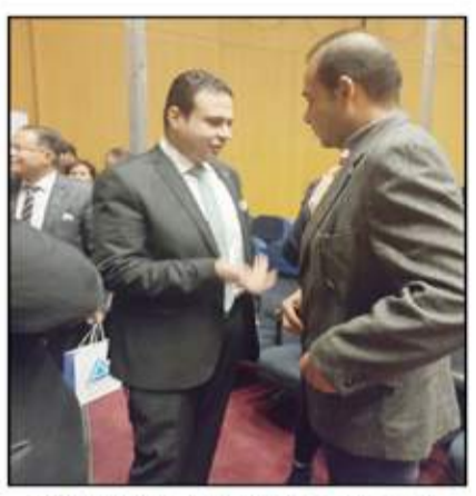
النائب عبد المعتمد إمام يتحدث لحرر السوق العربية

بعد أن كثر الحديث عنها مؤخرا أصبحت قنبا ومالها هدف لبعض الخلفاء على قيمة ما يملكون من أموال، وأصبحت مصدر ثقة للمستثمرين القدامى لتلبية أمالهم، تجد هناك من يضارب تيموا المكسب وأخر لا يعرف أسرارها وينتظر، وبعد ما عادت لتستوى، إنها البورصة المصرية التي تعتبر مصدرا جيدا لتمويل الشركات والشروعات ودعم الاقتصاد المصري، ربما بعد ارتفاع أسعار الذهب وعدم قانونية المضاربة والإنجاز بالعملة خارج قناتها الشرعية تنقبى من المبالاة الأخير، برغم طبيعة البورصات عموما كاستثمار مرتفع المخاطر ولكن يبقى لنا مهنه أسرارها ومشاكلها وسنأشعها. في هذه المسطور نرصد بعض الحقائق عن موقعها القني وأدائها وكيف استقبلت العام الجديد وأيضا مشاكلها التي يسعى الجميع لإيجاد حلول لها على أرض الواقع، الجلوس مع المتخصصين والعمل على إيجاد حلول لمشاكلها ونشر الوعي الاستثماري قد يكون له نتائج إيجابية في حديث خاص لجريدة السوق العربية قال النائب عبدالمعتمد إمام نائب رئيس لجنة الخطة والموازنة بمجلس النواب، أن وزارة المالية تعمل على توفير وتعظيم موارد الموازنة العامة للدولة والتي تعود بالنفع على المواطن المصري ولكنه رأى أنه يجب على الوزارة عند العمل على فرض ضريبة على سوق المال النظر إلى نظرائه من أسواق المال المجاورة، باعتبارها أسواق منافسة، وأشار إلى أن فرض ضريبة الأرباح الرأسمالية على سوق المال المصرية تنفذ السوق حياوية وتنافسية مقارنة بالأسواق الأخرى المجاورة مثل السوق السعودي والبورصة التركية.