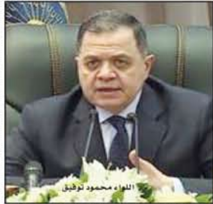
اللواء محمود توفيق