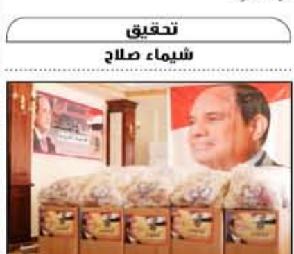
تقديم الدعم للعراس المقيلات على الزواج