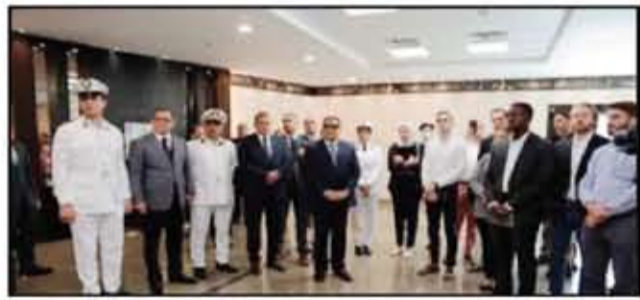
وفد الكونجرس أشاد بالنموذج المصري في تطبيق السياسة العقابية

عيون مصر الساهرة رجال باتوا يضحون بأرواحهم في سبيل الوطن. يبذلون جهود مضنية لخدمه الشعب بكافة طوائفه. يحافظون على أمن واستقرار البلاد. يستحدثون خدمات للراحة المواطنين. يقدمون مساعدات للمحتاجين... ليأكدوا في عيدهم الـ ٧١ أنهم على العهد باقين... وراعين شعار قد المسؤولية