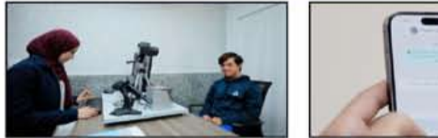
الرد الآلي في استفسارات «الواتس اب»