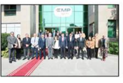
بمبادرة من إدارة وإشراف مؤسسة يحي عرفة الخيرية للأطفال يبلغ ٤٥ مليون جنيه، ويوجد سنويا حتى تاريخه، على عام ٢٠١٧، ارتفعت نسبة تمويل الجراحات الجراحية من ١٠٠ إلى ١٠٠٠، وهو ما يعكس الاهتمام المتزايد من القطاع الخاص بتمويل الخدمات الصحية للأطفال.