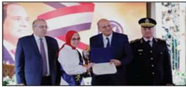
تكريم أبناء الشهداء لتفوقهم الدراسي