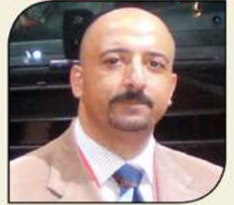
بقلم: أشرف كاره