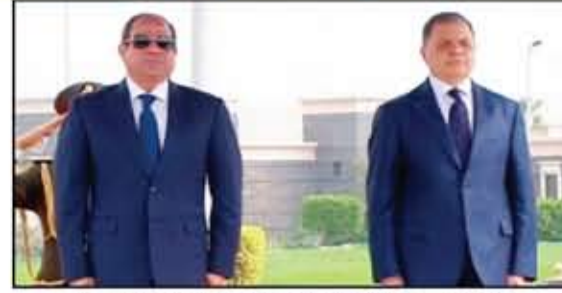
الرئيس السيسي ووزير الداخلية خلال الإحتفال بعيد الشرطة