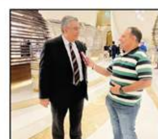
مجاهد يتحدث لحرر السوق العربية

معينا منذ اليوم الأول للاجتماع لمجلسة الكرة المصرية وعينها كاتبتها الطبيعية التي تستحقها بين الاتحادات القارية الأفريقية بل والعالمية وتجاوزت ما تبص الأزمات التي واجهت الكرة المصرية في تلك التوقيت. وما أهم الأعمال التي قامت بها خلال فترة عمل اللجنة الثلاثية؟ الاتحاد الدولي كلفنا لجنة ثلاثية بإعداد رؤس الاتحاد المصري لكرة القدم في ١٨ ديسمبر ٢٠٢٠ ثم قرر يوليو ٢٠٢١ قبل أن يرد بعدها مرة أخرى حتى ٥ يناير ٢٠٢٢ وهنا خلال تلك الفترة بالعديد من المهام المهمة وبعثت في مقدمتها الاهتمام بالمنتخب وعلى رأسها التوقيت المصري الأول واقدمنا مع مدرب عالمي في هذا التوقيت وهو البرغلي كارلوس كيروش ولم نتأخر في صرف مليم واحد وأرى مستحقا لتأجيل طوال تلك الفترة فضلا عن الاهتمام بالبحكم على كل الدرجات وسرف للتخليقات بانتظام وإقامة القمة بحكم مصرين وعنه أهم قرارات في إدارة الاتحاد وأتمنيا العمل في مركز التخليقات ورئيس الاتحاد في مشروع الهدف في احتفالية حضرها رئيس