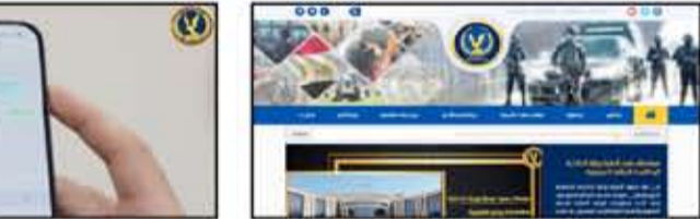
أول مرة لإستخراج تأشيرات العمل