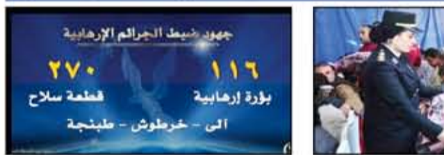
جهود أمنية متواصلة لمكافحة الجرائم