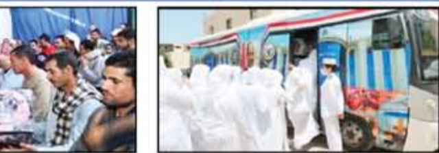
زيارات استثنائية لنزلاء مركز التأهيل والإصلاح