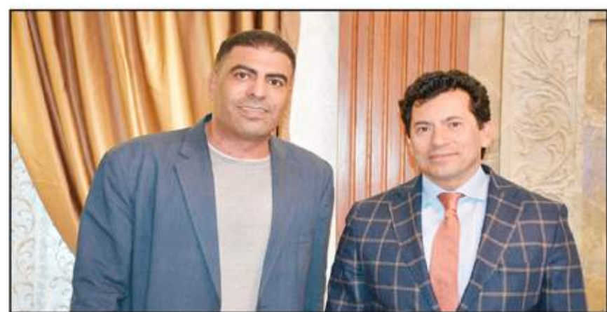
وزير الشباب والرياضة مع محضر السوق العربية