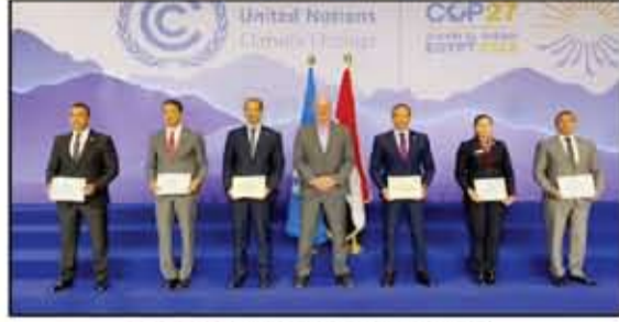
الأمم المتحدة تكرم رجال الشرطة على جهودهم