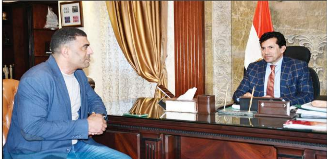
وزير الشباب والرياضة يتحدث لمحضر السوق العربية