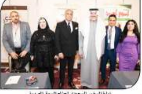
زيارة السفير السعودي لجناح السوق العربية