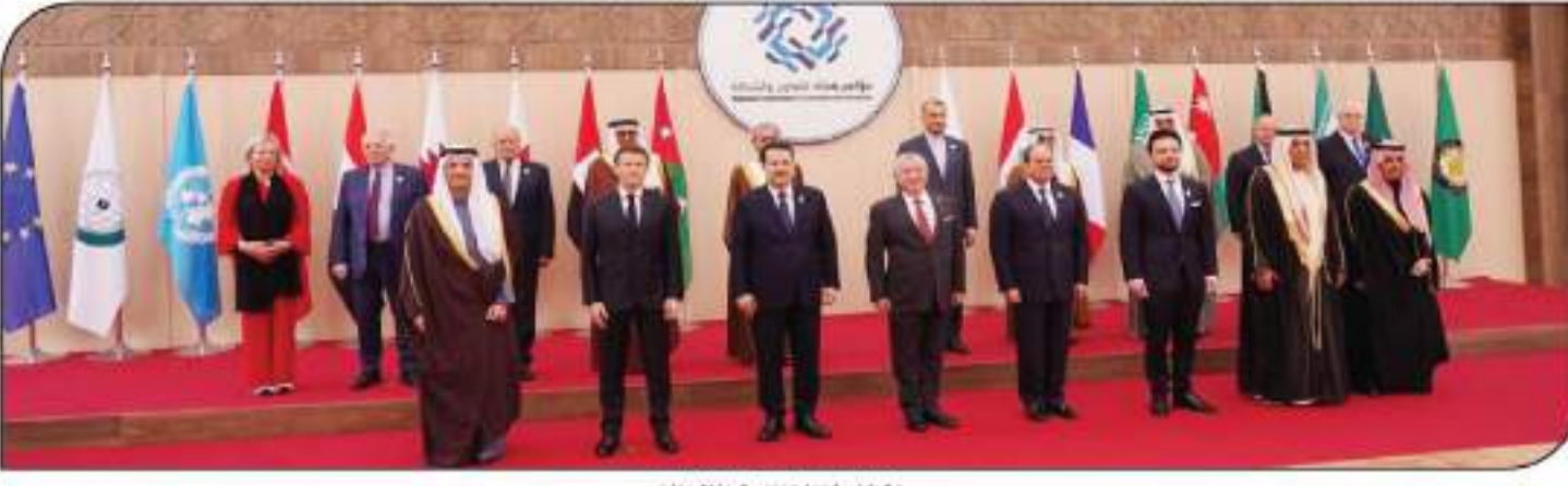
صورة تذكارية لقادة القمة خلال المؤتمر