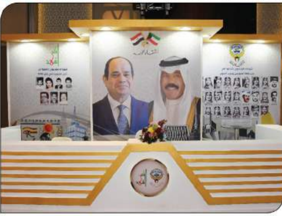
مصر والكويت لهما شأن إلى الأبد