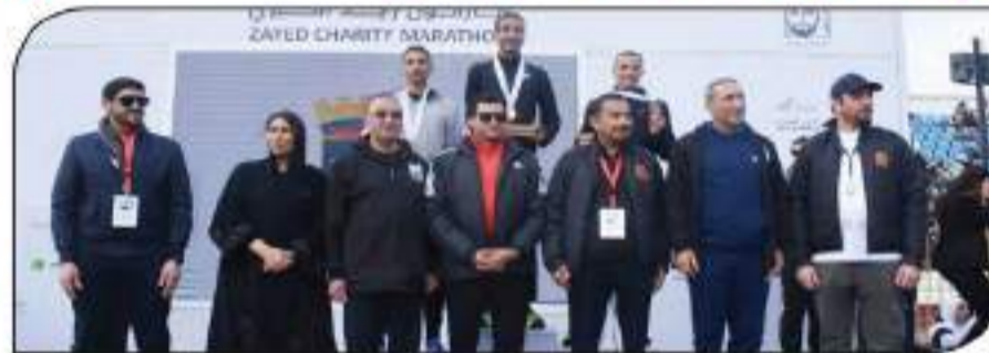
انطلاق ماراثون زايد الخيري بالإسكندرية

التي تنهدها المنطقة والعالم. من جانبه قال الدكتور أشرف صبيح، وزير الشباب والرياضة، إن ماراثون زايد الخيري يعد حدثاً رياضياً كبيراً وحدثاً إنسانياً يعكس قيمة العمل الخيري والمساهمة المجتمعية بين الجانبين