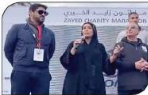
سفيرة الإمارات تلقي كلمة خلال الماراثون

المصري والإماراتي، مشيراً إلى أن توزيع الجوائز للمشاركين سوف يتم عبر البريد المصري وفق سياسة الدولة نحو الشمول المالي والتحول الرقمي. وأعلن صبيح عن أنه بالتعاون مع الجانب الإماراتي ظهر منح 10 شخصاً فرصة لأداء مساهمة العمرية، ويتم السحب عليها بشكل إلكتروني. وأمر اللواء محمد الشريف محافظ الإسكندرية عن سعادته وفخره باستضافة الإسكندرية لماراثون زايد العالمي في نسخته السابعة، بمشاركة 20 ألف متسابق من جنسيات مختلفة وعدد كبير من ذوي الهمم، مشيراً إلى أنه سيتم تخصيص العائد من الماراثون لمستشفى أهل مصر لضحايا الحريق والحوليات. وأوضح الشريف أن استضافة هذا الحدث الرياضي المهم تعد رسالة الرئيس عبدالفتاح السيسي بوضوح على عمق وقوة العلاقات المصرية الإماراتية، مشيراً إلى أنه تم الاستعداد للماراثون بشكل يضمن خروجه بصورة طيب بالحدود وقيمة ومكانة البلدين الشقيقين، لافتاً إلى أن الماراثون الخيري يحمل رسالة إنسانية نبيلة تتعلق بمم الخير والعطاء.