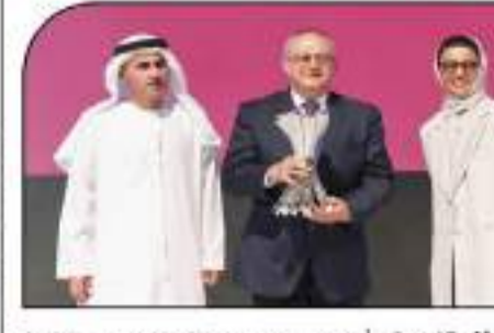
التكريم في أبوظبي

كرمته قمة اللغة العربية في دورتها الأولى وللجنة في منارة السمديات بأبوظبي، مكتبة الإسكندرية باعتبارها شخصية القمة لهذا العام، وذلك لتقدمها للجنة الثقافية العربية واللغوية.