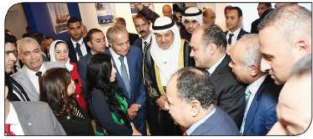
السفير الكويتي والوزراء في جولة بالعرض