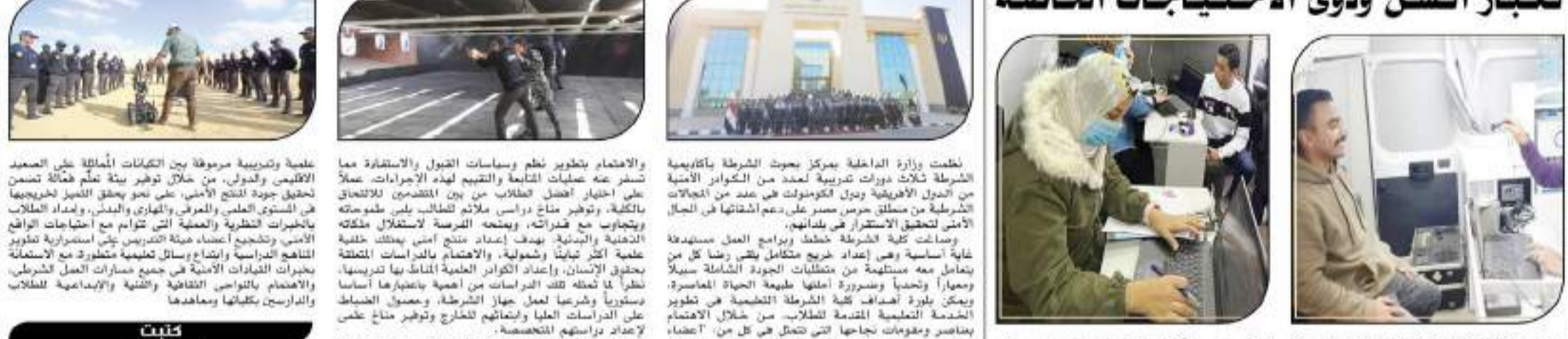
أسست الإدارة العامة للجوازات والهجرة والجنسية اتخاذ الإجراءات التي من شأنها التسهيل والتيسير على المواطنين والراغبين في استخراج التصاريح بجميع المواقع الشرطة، كأحد الثوابت الجوهرية التي تركز عليها الخدمات والمستخدمات الشرطة بما يتماشى مع إحترام حقوق الإنسان، وذلك من خلال رصد الحالات الإنسانية من المترددين على جميع الأقسام التابعة للإدارة بالمحافظات المختلفة، لتقديم جميع التيسيرات لهم، قامت أقسام الإدارة المختلفة على مستوى الجمهورية باستقبال عدد من الحالات المرضية والإنسانية وكبار السن بمقرات الأقسام، وتم إنهاء الإجراءات الخاصة بهم، وتؤكد الوزارة على مواصلة اتخاذ جميع الإجراءات