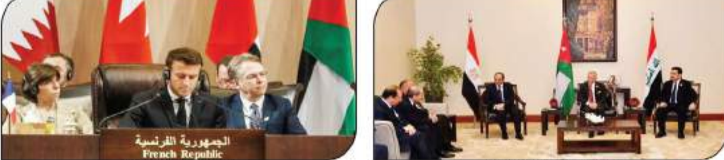
قمة ثلاثية بين مصر والأردن والعراق