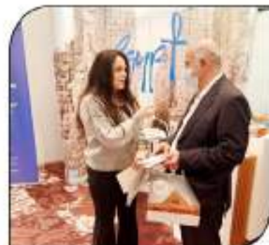
مخبرو السوق العربية في جولة داخل الأسبوع الكويتي في مصر