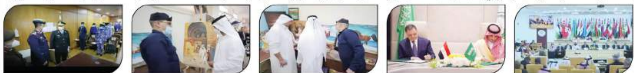
تمت صياغة الاتفاقية لمكافحة الجريمة في السعودية مقررة توجيهاً في السياسة العقابية تحت إشراف وزارة الداخلية تحت إشراف اللواء محمود توفيق وزير الداخلية الاحتفال بيوم الشرطة العربي وذلك تكفيها الدور التعاون الأمني بين مصر والسعودية العرب في جميع مجالات العمل المشترك لتنفيذ الأمن وتحت إشراف وزارة الداخلية على المشاركة في اجتماعات وزراء الداخلية العرب واللجنة المشتركة ومختلف الأجهزة المختصة وبمطورات الشرطة المصرية وتنشيطاتها إنفاذاً للشهداء، الأمر معاني الطولات التي رسمت دعوات الأمن والاستقرار في الوطن، وفنت على الإرهاب وقوله، ووجهت معها شريكات لجميع أشكال الجريمة، وبشكل التعاون بين وزارة الداخلية المصرية، وتطورها في الدول العربية وكيزة أساسية في مواجهة الجرائم العابرة للحدود، والتحديات الإرهابية التي تحاول النيل من مقدرات الأوطان، وهي عمتها جلب وتهريب المواد المخدرة والهجرة غير الشرعية، واتمكت تلك على تصاميم حثقتها الشرطة المصرية، من إحباط مخططات عبر شعنت من وراء الحدود عبر أراضيها إلى الدول العربية، وباتت القنصلية المصرية

التصدي لعصابات جلب وتهريب المواد المخدرة وأباطرة الهجرة غير الشرعية.. و ٢٢٢ منحة دراسية للكوادر الأمنية العربية