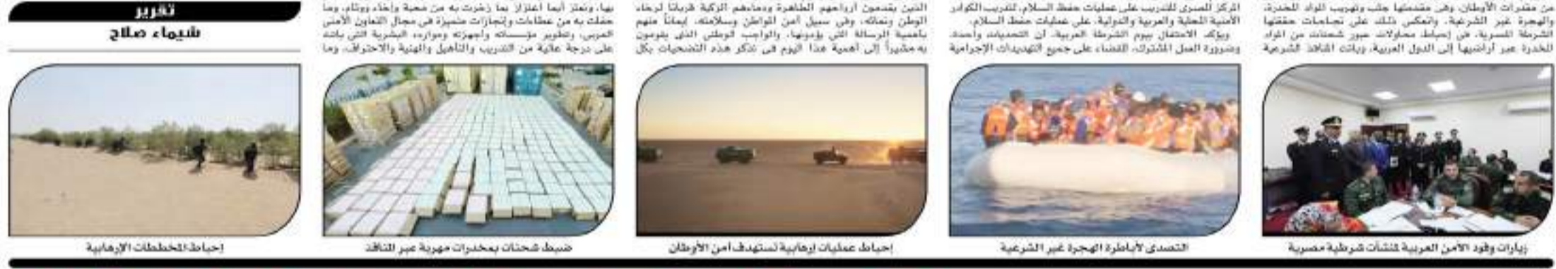
تصدي لإباطرة الهجرة غير الشرعية ضبط شحنات بمخدرات مهربة عبر النافذة إحباط عمليات إرهابية تستهدف أمن الأوطان زيارات وفد الأمن العربية لقنصليات شرطة مصرية