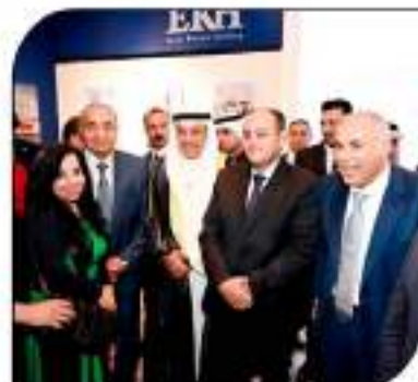
الوزراء في جولة داخل المعرض