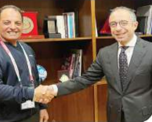
محمود السوق العربية مع شير مصر في قطر

حضور الرئيس مباراة الافتتاح رسالة واضحة وصريحة عن عمق العلاقات بين البلدين