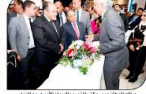
صلاح العرفان مدير مكتب الشهدا بالديوان الأميري مع الوزراء