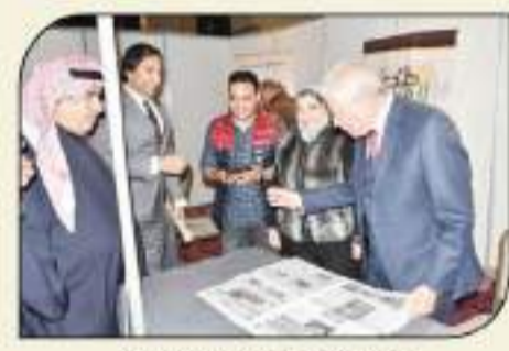
اللواء خالد فودة في جناح السوق العربية

شارك معالي الوزير اللواء خالد فودة محافظ جنوب سيناء في فعاليات الأسبوع الكويتي حيث أكد أن الأسبوع الكويتي الـ ١٢ في مصر، يأتي في ظل علاقات تاريخية متميزة، ومستمرة في التقدم والأزدهار في مختلف المجالات، وهناك الكثير من المحطات التي تعاون فيها البلدان الشقيقان، وما زالت تمار التعاون وتزدهر بروح طيبة وخطوات ونياحة تبناء المستقبل. وأكد اللواء فودة أن الأسبوع الكويتي في مصر يمثل جسراً لترسيخ التعاون لكلا البلدين بما يرتبط به من اتفاقيات وشهادات تجارية واستثمارية، بما يساهم في توطيد العلاقات التجارية والاستثمارية والثقافية والإعلامية بين الكويت ومصر، ما يعد ترجمة حقيقية لقوة العلاقات التاريخية التي تجمع دولة الكويت وجمهورية مصر العربية على جميع الأصعدة بالإضافة إلى الكويت لها مكانة كبيرة في قلب كل مصري.