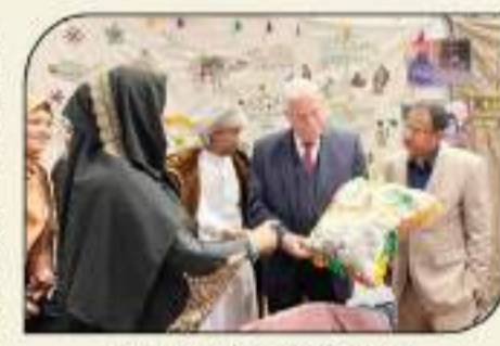
اللواء خالد فودة في جناح أبناء جنوب سيناء

شارك معالي الوزير اللواء خالد فودة محافظ جنوب سيناء في فعاليات الأسبوع الكويتي حيث أكد أن الأسبوع الكويتي الـ ١٢ في مصر، يأتي في ظل علاقات تاريخية متميزة، ومستمرة في التقدم والأزدهار في مختلف المجالات، وهناك الكثير من المحطات التي تعاون فيها البلدان الشقيقان، وما زالت تمار التعاون وتزدهر بروح طيبة وخطوات ونياحة تبناء المستقبل. وأكد اللواء فودة أن الأسبوع الكويتي في مصر يمثل جسراً لترسيخ التعاون لكلا البلدين بما يرتبط به من اتفاقيات وشهادات تجارية واستثمارية، بما يساهم في توطيد العلاقات التجارية والاستثمارية والثقافية والإعلامية بين الكويت ومصر، ما يعد ترجمة حقيقية لقوة العلاقات التاريخية التي تجمع دولة الكويت وجمهورية مصر العربية على جميع الأصعدة بالإضافة إلى الكويت لها مكانة كبيرة في قلب كل مصري.