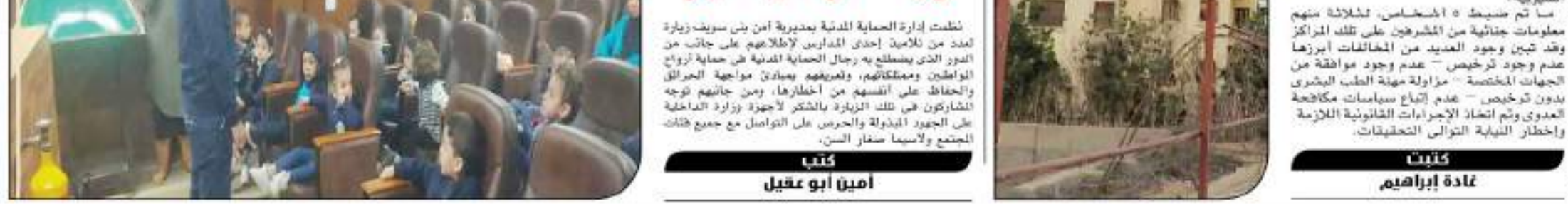
قامت إدارة الحماية المدنية بمديرية أمن بنى سويف بزيارة لعدد من المدارس لإطلاعهم على جانب من الدور الذي يضطلع به رجال الحماية المدنية في حماية أرواح المواطنين وممتلكاتهم، ولعريفهم بمبادئ مواجهة الحرائق والحفاظ على أنفسهم من أخطارها، ومن جانبهم توجه المشاركون في تلك الزيارة بالشكر لأجهزة وزارة الداخلية على الجهود المبذولة والحرس على التواصل مع جميع فئات المجتمع والاسما سفار الكس.