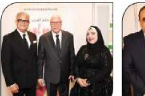
د. أماني الموجي مع السفير الفوض أحمد الباز

بين الاستثمار بين البلدين وحلقة وصل بين الشركات الكويتية والمصرية والبنوك والسياحة في مصر ويعمل على نمو الاقتصاد والبقاء الضوء على مشاريع الاستثمار وعرض أفكار جديدة تساعد على النمو الاقتصادي في مصر والكويت وتوثيق العلاقة بينها وإتاحة الفرص أمام المستثمرين ورجال الأعمال.