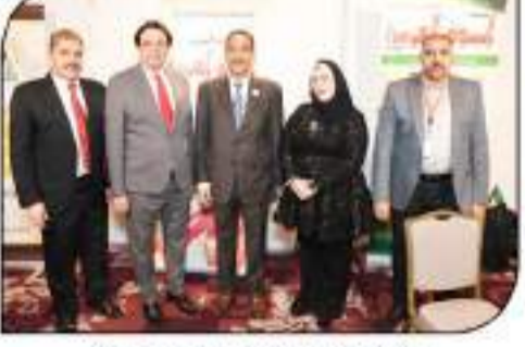
سفير سلطنة عمان داخل جناح السوق العربية