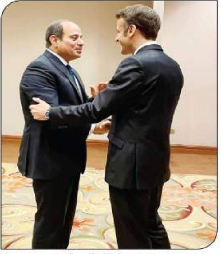
الرئيس السيسي يلتقي الرئيس الفرنسي ماكرون