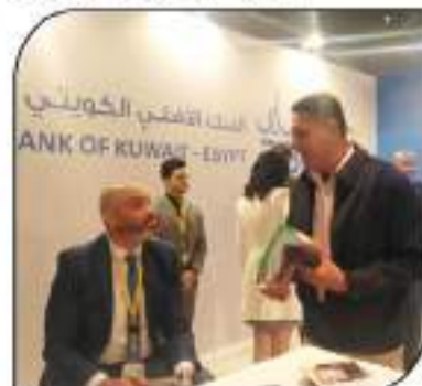
مخبرو السوق العربية في جولة داخل الأسبوع الكويتي في مصر