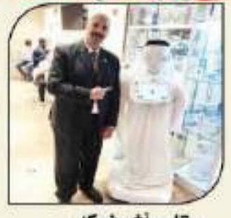
بقلم: أشرف كاره

ضمن زيارتى الأسبوع الماضى لمعرض أوتوميكانيك دبي (العالمى) - أحمد أكبر معارض منطقة الشرق الأوسط بقطاع الصناعات الغذائية للسيارات وقطع غيارها ومعدات ومستلزمات الورش ومراكز الخدمة - والذي تستضيفه مدينة دبي (العالمية) ... ومع مشاركة أكثر من 1,145 عارض من ما يزيد على 53 دولة عالمية ... أخذت الأفكار تدور برأسى وكذلك العديد من الأسئلة والتساؤلات ... ■ لماذا لم تحصل مصر بمعارضها المتخصصة بهذا القطاع إلى نصف أو ربع هذا الحجم؟ ■ لماذا لا تتبنى الدولة المصرية من خلال أجهزتها المختصة مثل هذه التوعية من