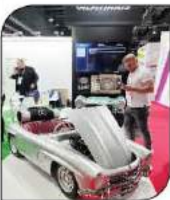
نموذج لصفي سيارة مرسيس الغلاسيكية لتسبيات بي إل