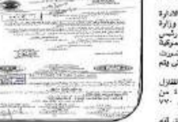
صنعت مسجلة المبرمج منشور رقم ٥٢ لسنة ٢٠٢٢