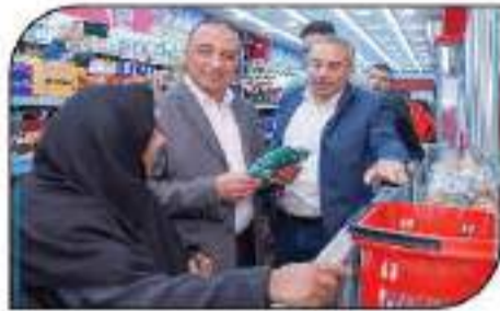
محافظ الاسكندرية خلال لقائه بالبراعة