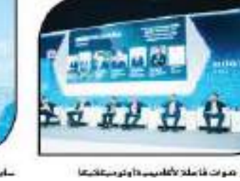
عروض قاعة أكاديمية أوتوميكانيك