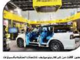
معرض لقط من طراز بوليفيا المتخصصة العتامة للسيارات