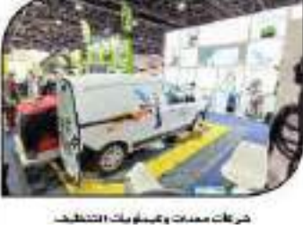
شركات معدات والبيانات المتخصصة