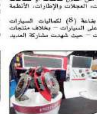
شارك بالمعرض بريسيو - الصانع الأول فى العالم فى قطاع