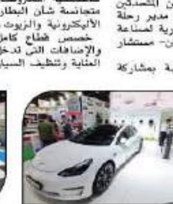
عرضات (أول) مجموعة متهير من طراز السيارات الكهربائية