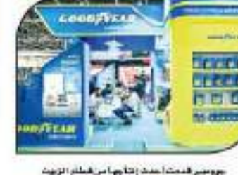
نموذج معدات أحدث إنتاجها من طراز الزيت