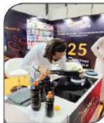
عرض صافية للعتامة وأجسام السيارات