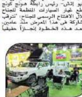
معرض لقط الترميم مستلزمات السيارات المصرية