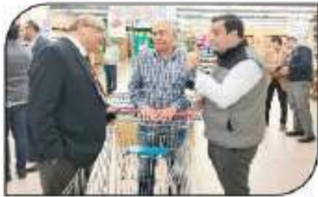
وكيل وزارة التموين يستمع لآراء المواطنين