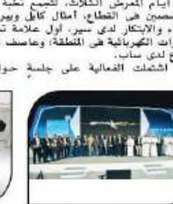
من حفل جوائز أوتوميكانيك - دبي