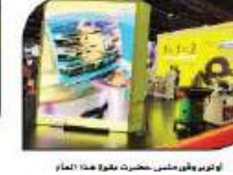
أوتوموفيل ميس حشرت بقوة هذا العام