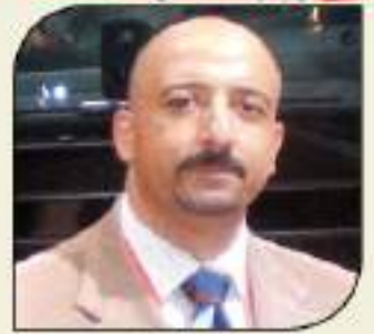
بقلم: أشرف كارم