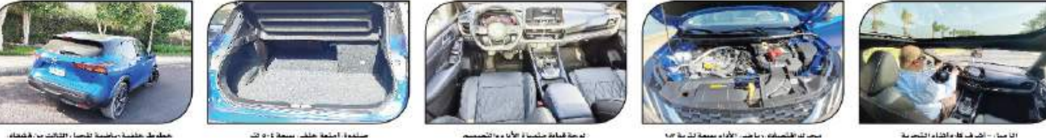
خطوط خلفية خفيفة خاصة لتساقط الثلج من سقفها - صندوق أمتعة خلف سعة 5٠٤ لتر - لوحة مفاتيح شاشة الأمان والتصميم - مصباح ليد الخلفية - ما جاء من الأداء بمساحة 1٥٣