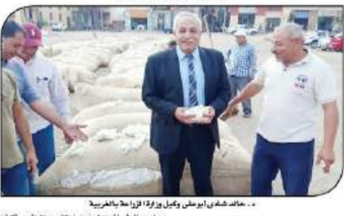
د. خالد شافي أبوغوي وكيل وزارة الزراعة بالغبربية