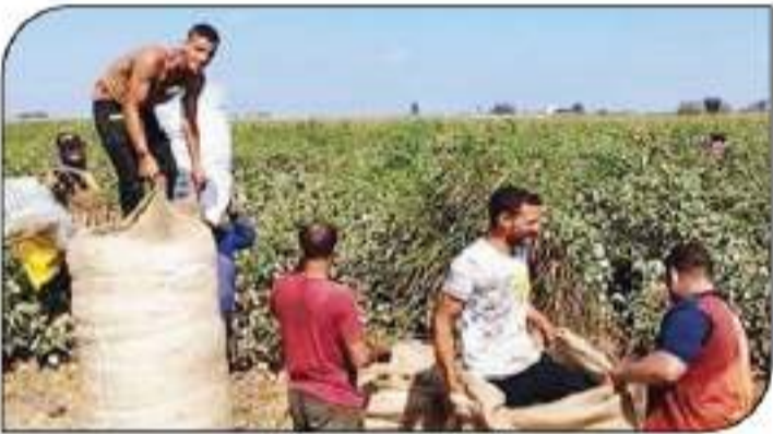
الزارعون في موسم حصاد القطن