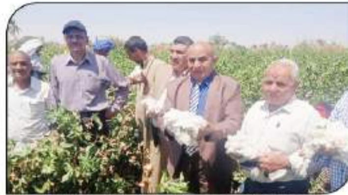
وكيل وزارة الزراعة ومدير عام القطن الزراعية أشتهاء حصاد القطن