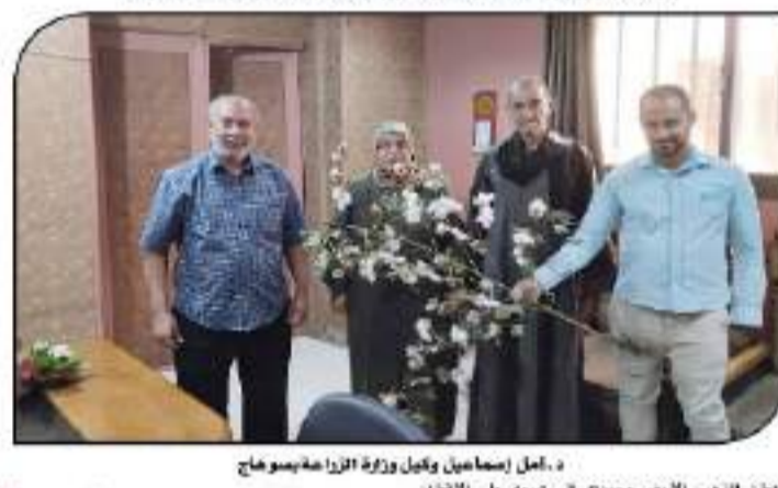
د. جمال إسماعيل وكيل وزارة الزراعة بمسوح