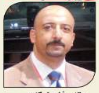
بقلم: أشرف كارر