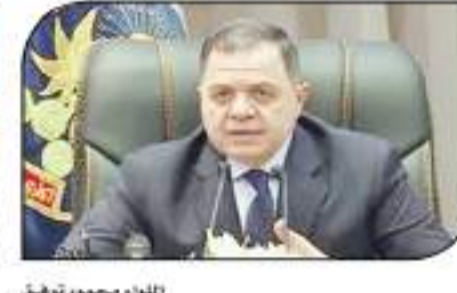
اللواء محمود توفيق