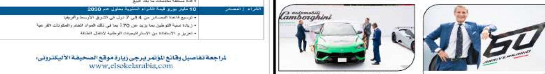
أوتوموبيلي لامبورجيني تكشف عن طراز أوريوس برفورمانتي في فعالية

كشفت أوتوموبيلي لامبورجيني (Automobili Lamborghini) مؤخراً عن طراز أوريوس برفورمانتي (Uras Performante) بشكل معيار جديد كراء القيادة الشارقة للمركبات الرياضية متعددة الاستخدامات (SUV) الكهفية وذلك خلال فعالية A Monoposto The Quail Gathering العالمية برياضات السيارات، وتعتبر أوريوس برفورمانتي النسخة الأحدث والأكثر تطوراً حتى هذا التاريخ من الناحية التقنية ضمن عائلة مركبة أوريوس الرياضية متعددة الاستخدامات الكهفية، والتي تعد الآن أسرع SUV إنتاجية في سباق هبة "أيكس بيكا (Pikes Peak) برسولة زمامتة 10 دقائق و33.016 ثانية كسرته بذلك الرقم القياسي السابق لتسجل تلك الشهيرة والتي حطقت في العام 2014 مركبة "لنلي بنتانيا (Bentley Bentayga) مع زمن 10 دقائق و19.94 ثانية. تعتبر أوريوس برفورمانتي بكونها عرض القابض فيما يتعلق بالمرات الرياضية والأداء العالي مع التركيز على التوازن التجميعية التي تمكن قوة أوريوس الجديدة على الطريق والحملة والتفاني من نحو المعدل أيضاً وتتمتع أوريوس برفورمانتي بخلافة تيار 330 حصان مع تحاشن في الوزن بمتار 17 كغ (37.5 رطلاً) مما يجعلها معدل الوزن - إلى - القوة الأفضل