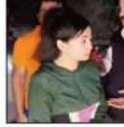
فهدم التحاليل ضابط شرطة