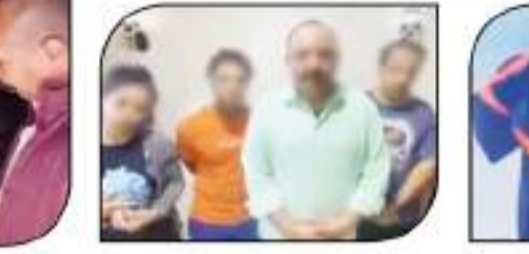
مصورو فهدم التحاليل ضابط شرطة