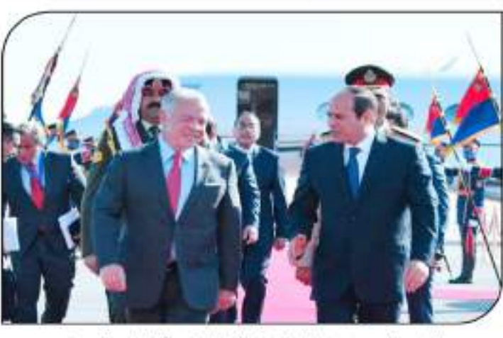
الرئيس السيسي يستقبل ضيوف مصر الكرام بشهر الرئاسة بالعلمين