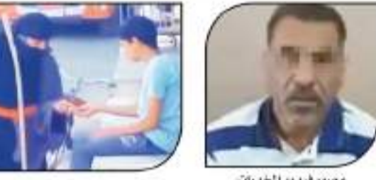
فهدم خفط الأطلاق