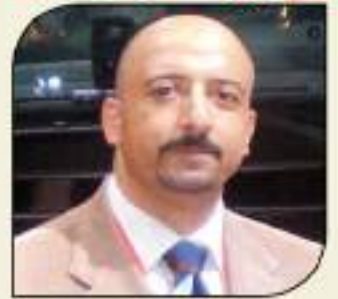
بقلم: أشرف كاره