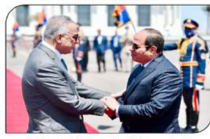
الرئيس السيسي يستقبل ضيوف مصر الكرام بشهر الرئاسة بالعلمين