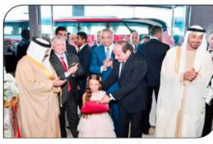
السيسي وضيوف مصر الكرام يشقون مدينة العلمين ومشروع ريجال هايلس