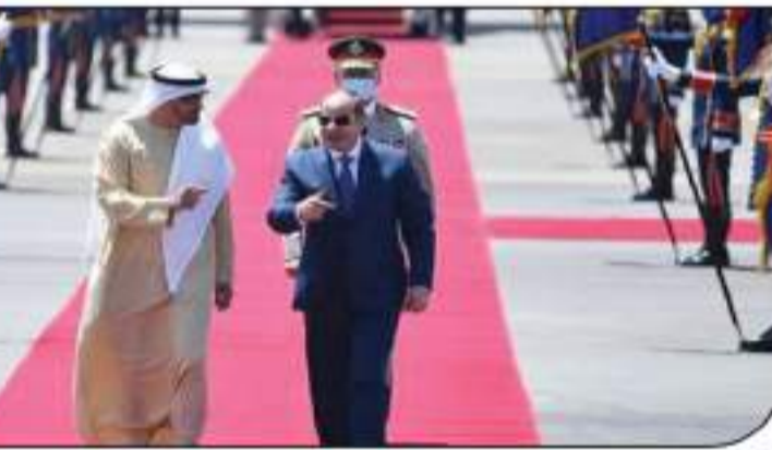
الرئيس السيسي مع رؤساء دولة الإمارات الذي وصلته مطار العلمين