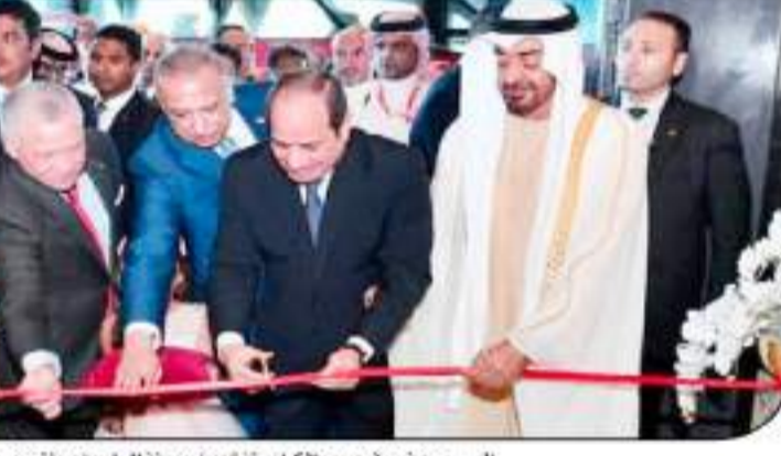
السيسي وضيوف مصر الكرام يشقون مدينة العلمين ومشروع ريجال هايلس

ان قمة جدة كانت يعني تدشين مرحلة جديدة من التنمية مع العالم أو أن نقول نحن أصحاب قرار، واستقبل في اعتقادي الآن قمة مكة وجدت هناك شراكات جديدة في الفترة الأخيرة في السنوات الأخيرة في هذا العام تحديدا استثمارات إن تليها ما يسمى انكر الوقت العربي أو الصلحة العربية أو يعني حين هذه رؤية العربية التي فرشت موطئها على القرى الكبرى يعني القرى الكبرى الآن أصبحت المنطقة ساحة لكه يعني فكرة كبرى، لكن التعلق يعني الربط بين جبة هناك أيضا يعني روسي التعلق، والرئيس المصري شاي نحن بنج سينور المنطقة الشهور القليل كل هذا يعكس إن المنطقة العربية أصبحت منطقة ذات مهم وأنها أهمية استراتيجية الهوة تمثل أو كتلة طينية لأن بعد حالة الانهيار على نظام الأقليم العربي استطاعت مصر أن تحافظ على هذا النظام، وإن بعد مرة أخرى الحيوية إلى فكرة ما يسمى العمل العربي المشترك لتسويق العربي الدول العربية لديها إمكانيات فيها موارد طرية وشهيرة، وبالتالي فكرة هذا التسويق هو وسير على صغارين يعني صغار ذو بعد الاقتصادي والتربيع السياسي والتربيع الاجتماعي وسواجبه التحديت ونهية الأزمات، الأرباب، الفكر المتطرف نسوية الإمارات العربية في ليبيا في اليمن في شبراها بما يحافظ على الدولة الوطنية العربية بما يحافظ على الحدود السياسية بما يدفع إلى تقبل أو التجمع الدول الخارجية المقلدة لهذه الأنماط أيضا في عهد السيسي.