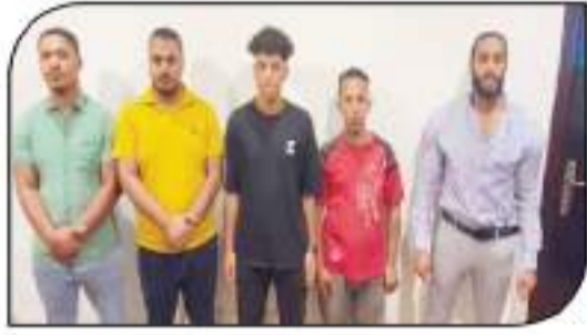
التكنولوجيا بتصوير الفيديو المخطط