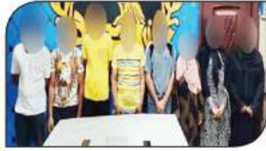
مصور فيديو لإعداد الانتعاش