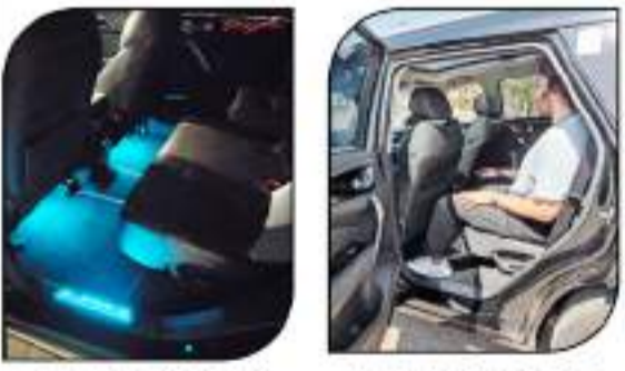
إضاءة ليلية للقواعد الخلفية

التجهيزات الداخلية: قد تكون من أهمها... • كساء جلدي عالي الجودة تم حياته بحبوت