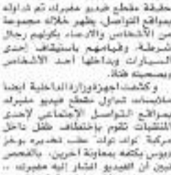
مصور فيديو المخدرات