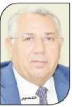
الوزير في حالة الفوق أو السوقة، وكلف وزير الزراعة عدسولي الصندوق بعرض الحالات النافذة المؤمن عليها فوراً من أجل

بمشاركة كل المحافظات البيطرية لتسيلا التحصين مع تكثيف الفواقل البيطرية للفحص وعلاج مواشي صغار المربين في القرى والنجوع، والشارب، القصب، إلى أن تم إعطاء أكثر من ٧ ملايين جرعة تحصين حتى الآن من خلال الحملة القومية لتحصين المواشي ضد الحمى القلاعية والوادي الصدغ والتي بدأت يوم ٢٤ يوليو الماضي في إطار المبادرة الرئاسية بحياة كريمة التي أطلقها الرئيس السيسي للرفع لتطوير التريف المصري ورفع مستوى معيشة المواطنين، وأكد وزير الزراعة أن حملة التحصين تجوب القرى والنجوع ومن بيت بيت وتشمل أيضا تزيين وتصيقل المواشي وكذلك التوعية بمنتجات الاشتراك في صندوق التأمين على الماشية، موضفا أن ذلك يستهدف حماية الثروة الحيوانية وتحقيق عائد وعامش ربح مناسب للمربين بمختلف المحافظات.