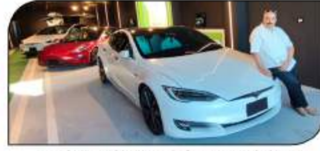
التميز أشرف كارم.. مع مجموعة سيارات تسلا بصالة عرض الشركة الجديدة