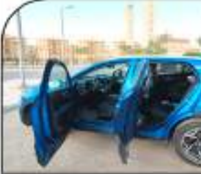
التناء ملحوظ لمصنعة الركاب