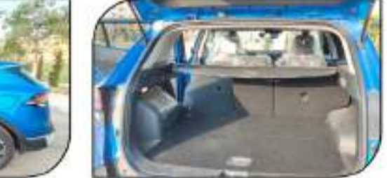
صندوق أمتعة خلفي كبير بسعة 641 لتراً