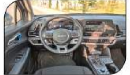
لوحة قيادة بالتميز متطور