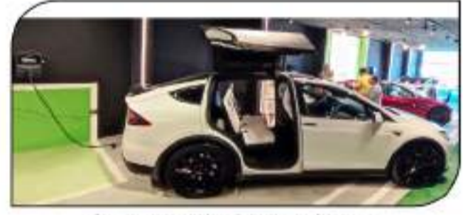
شهدت صالة عرض الشركات أحدث أساليب العرض الحديثة