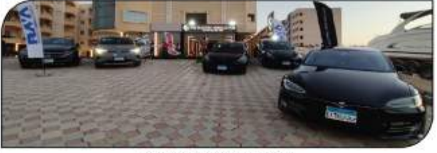
السيارات الكهربائية كالت في استقبال الجمهور

الشركة لافتتاح عدد من صالات العرض وفرق العمل المتخصصة في سيارات ALIEN-Z. وعلى أحدث نظم العرض العالمية وذلك بمطلة الشيخ زايد بالقاهرة. وذلك خلال الـ أشهر المقبلة والتي ستعكس جودة عرض الشركة الرئيسية. هذا وقد شهد افتتاح صالة عرض الشركة الجديدة حضور كبير من المهتمين وصالات السيارات الكهربائية في مصر (وعلى رأسهم صالات سيارات تسلا)، فيما شرف الافتتاح بحضور عدد متزايد من ممثلي الصحافة ووسائل التواصل الاجتماعي المتخصصة بالسيارات.. كما أضاف زين: أننا نعمل على التحضير