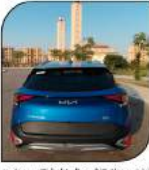
معرض وجهات النظر جمال خطوط التصميم وبوجهة