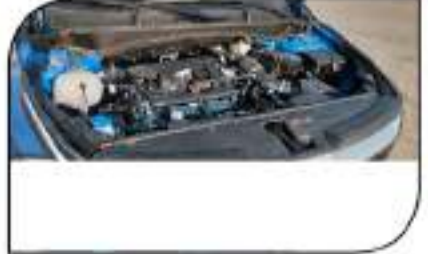
محرك نشط سعته 1.6 لتر ويستخرج 160 حصاناً