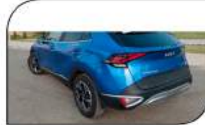
خطوط غير تقليدية بتصميم الجبهة الخلفية للسيارة