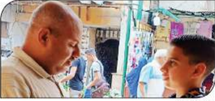
مصر السوق العربية يتحدث مع المواطنين

بالاعتماد على الطاقة المتجددة والنووية، والاعتماد على الصناعات التكنولوجية المتقدمة، أصبح من الضروري تطوير التعليم في مصر، ليس فقط لتلبية احتياجات سوق العمل، ولكن أيضاً لتوفير فرص عمل أفضل للمواطنين، ولتحسين جودة الحياة، ولتعزيز النمو الاقتصادي. ولتحقيق ذلك، يجب أن نركز على تطوير المناهج التعليمية، والتي يجب أن تكون قادرة على إعداد الخريجين لمواجهة التحديات العالمية، والتي تتطلب مهارات عالية في التفكير النقدي، وحل المشكلات، والعمل الجماعي، والتواصل، والابتكار، والقدرة على التعلم المستمر. ولتحقيق ذلك، يجب أن نركز على تطوير المناهج التعليمية، والتي يجب أن تكون قادرة على إعداد الخريجين لمواجهة التحديات العالمية، والتي تتطلب مهارات عالية في التفكير النقدي، وحل المشكلات، والعمل الجماعي، والتواصل، والابتكار، والقدرة على التعلم المستمر.