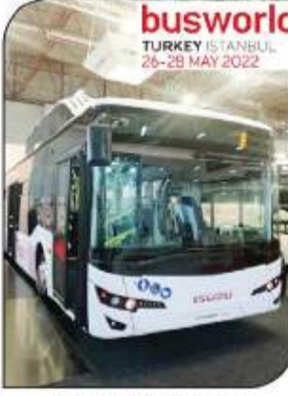
إيسوز سيون بيوت العامل بالغاز الطبيعي

تستعد شركة (HKF) تنظيم المعارض التركية لإطلاق الدورة الحادية عشر من معرض - busworld Istanbul - ٢٠٢٢ - الخمسين للحافلات وباصات نقل الركاب وستقامها وذلك بالفترة من ٢٦ إلى ٢٨ مايو ٢٠٢٢ بمركز إسطنبول للمعارض (ifm) والذي يفتي بالتعاون مع مجموعة (باص وورلد - busworld) المنظمة لتسعة معارض busworld الدولية حول العالم وللتنحصة من الباصات بأنواعها ومستلزماتها والتي تعد الأكبر عالمياً .. هذا ويتوقع أن يزيد عدد الشركات المشاركة عن أكثر من ٢٠٠ شركة عالمية كما يتوقع حضور المعرض أكثر من ١٠٠٠٠ زائر متخصص يتكون أكثر من ٨٥ دولة من حول العالم .. حيث سيشهد المعرض تقديم العديد من الطرازات