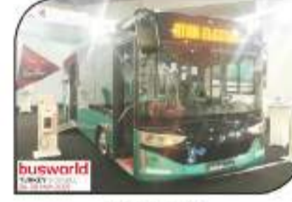
كارسان توكا إيكاترك