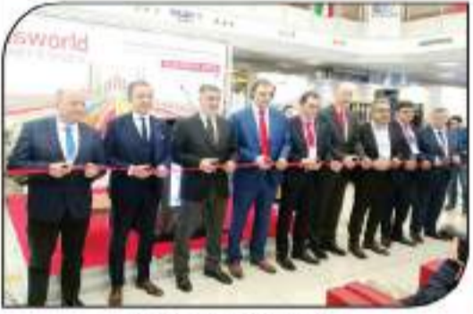
فص شريف افتتاح الدورة الأخيرة

الحاضرات والندوات التي ستأقش مستقبل هذه الصناعة العالمية الهامة وذلك تحت مظلة (التربية باص وورلد - Busworld Academy) وهو الأمر الذي يساهم بدوره في تطوير هذا القطاع عالمياً بالسوق التركية بصفة خاصة، وعالمياً بصفة عامة.