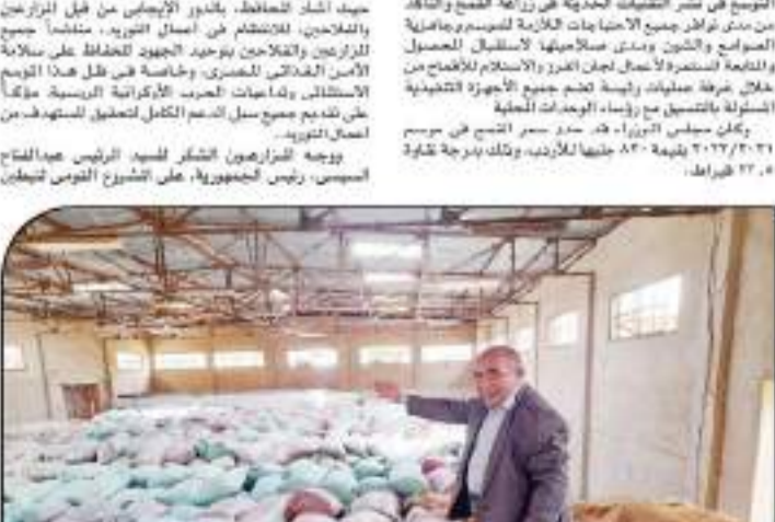
مزارعون إنشاء حماد القمح