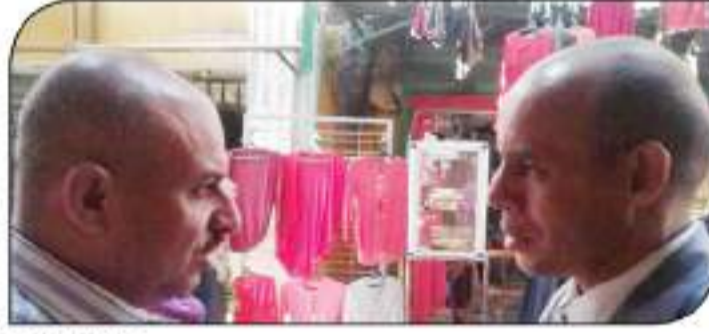
مصر السوق العربية يتحدث مع المواطنين

تعد المدارس التكنولوجية التطبيقية من أهم المؤسسات التعليمية التي تساهم في إعداد الخريجين لمواجهة التحديات العالمية، والتي تتطلب مهارات عالية في التفكير النقدي، وحل المشكلات، والعمل الجماعي، والتواصل، والابتكار، والقدرة على التعلم المستمر. ولتحقيق ذلك، يجب أن نركز على تطوير المناهج التعليمية، والتي يجب أن تكون قادرة على إعداد الخريجين لمواجهة التحديات العالمية، والتي تتطلب مهارات عالية في التفكير النقدي، وحل المشكلات، والعمل الجماعي، والتواصل، والابتكار، والقدرة على التعلم المستمر. ولتحقيق ذلك، يجب أن نركز على تطوير المناهج التعليمية، والتي يجب أن تكون قادرة على إعداد الخريجين لمواجهة التحديات العالمية، والتي تتطلب مهارات عالية في التفكير النقدي، وحل المشكلات، والعمل الجماعي، والتواصل، والابتكار، والقدرة على التعلم المستمر.