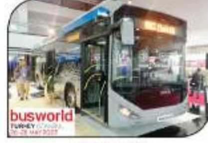
إوتوكار - كاتالوجا