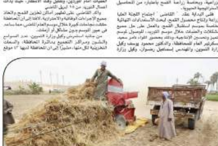
مزارعون إنشاء حماد القمح

تعد المدارس التكنولوجية التطبيقية من أهم المؤسسات التعليمية التي تساهم في إعداد الخريجين لمواجهة التحديات العالمية، والتي تتطلب مهارات عالية في التفكير النقدي، وحل المشكلات، والعمل الجماعي، والتواصل، والابتكار، والقدرة على التعلم المستمر. ولتحقيق ذلك، يجب أن نركز على تطوير المناهج التعليمية، والتي يجب أن تكون قادرة على إعداد الخريجين لمواجهة التحديات العالمية، والتي تتطلب مهارات عالية في التفكير النقدي، وحل المشكلات، والعمل الجماعي، والتواصل، والابتكار، والقدرة على التعلم المستمر.