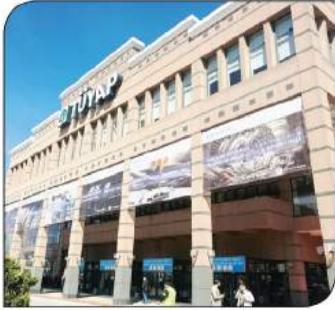
الدخل الرئيسي للمعرض

حققت شركة دايمر لشاحنات القابضة (Daimler Truck) بداية إيجابية للعام الجديد مع نمو في مبيعات الوحدات والإمدادات والأرباح قبل الفوائد والضرائب والاستهلاك والأستقاعاات، حيث تمكنت الشركة من زيادة مبيعات وحدات المجموعة بشكل كبير على أساس سنوي إلى ١٠٩.٠٠٠ وحدة في الربع الأول من عام ٢٠٢٢ بزيادة بلغت ٨٨ مقارنة بالربع الأول من عام ٢٠٢١ (١٠١.٠٠٠ وحدة). وعلى الرغم من اختلافات المعرض المستمر، تمكنت Daimler Truck من الاستفادة من حالة الطلب القوية في الربع الأول. وبدعم من مبيعات الوحدات القوية في قطاع شاحنات أمريكا الشمالية وهرسبندس-بنز، وتحسن صفات الأسعار والمساهمات الإيجابية من أعمال ما بعد البيع والسيارات المستعملة، فقد ارتفعت إيرادات المجموعة بنسبة ٢٧٪ لتصل إلى ١٠٠.٦ مليار يورو والربع الأول من عام ٢٠٢١ كانت ٩.٠ مليار يورو.