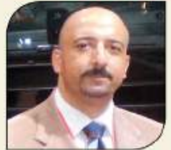
بقلم: أشرف كارر