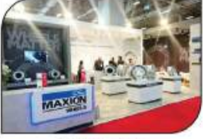
مجلات الباصات المعدنية