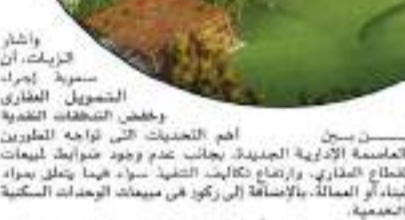
واشار شكري، ان

وأشاروا خلال استطلاع أجريته السوق العربية المشتركة للوصول إلى روشتة تطوير القطاع إلى أن التسهيلات البنكية وبنوك ومصرفية القطاع العقاري وتسهيل التمويل العقاري تعتبر أبرز المطالب التي تقدم بها المحطون إلى الحكومة لتخطي الأزمة الراهنة. مشددين على ضرورة التكاتف بين الحكومة والمطورين خلال الفترة المقبلة من أجل تخطي الظروف الراهنة التي يمر بها القطاع العقاري.