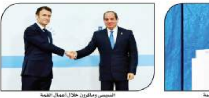
السيسي وماكرون خلال أعمال القمة