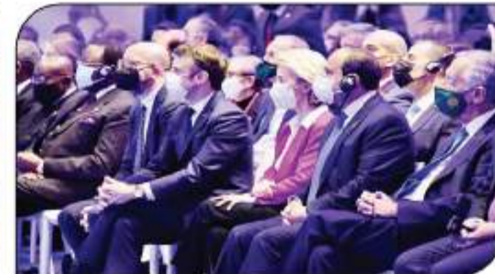
الرئيس السيسي خلال فعاليات القمة