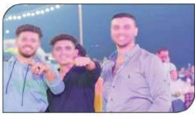
المحققون بالابتزاز بسنت