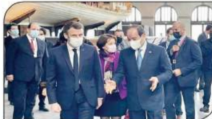
السيسي يلتقي الرئيس الفرنسي ماكرون في مدينة بريست