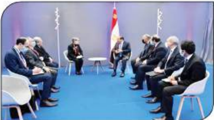
السيسي خلال لقائه برئيسة المفوضية الأوروبية