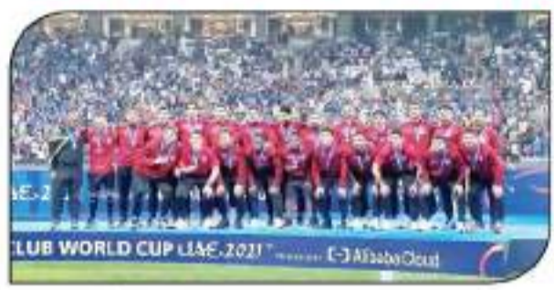
لحظة تتويج النادي الأهلي بالبرونزية

استطاع اللورد الأحمر تحطيم الأرقام القياسية في كأس العالم للأندية والتي أقيمت مؤخراً في دولة الإمارات العربية حيث فاز النادي الأهلي المصري على فريق الهلال السعودي في مباراة تحديد المركزين الثالث والرابع بأربعة أهداف دون رد ليصبح نادي العين الإفريقي بالبرونزية للعام الثاني على التوالي تحت قيادة حنية الجنوب أفريقي بيتسو موسيماني وتعتبر البرونزية الثالثة للأهلي في التتويج. وعلى الجانب الآخر فاز نادي تشيلسي الإنجليزي بطل أوروبا بالكأس إثر تغلبه بصعوبة بالغة في المباراة النهائية على نادي بايرن ميونخ الألماني بعدد أهداف في الوقت الإضافي للمباراة وقام لاسو تشيلسي الإنجليزي بعمل مع شرفه نجوم الأهل عند تسليم الميدالية البرونزية للعبة التتويج في مشهد حالي يدعو للفخر. أرقام قياسية للأهلي في مونديال الأندية: • وفيما يلي نستعرض الأرقام القياسية الجديدة التي حققها الأهلي خلال نسخة كأس العالم للأندية والتي اختتمت الأسبوع الماضي في دولة الإمارات. • من بين ٢١ فريقاً من مختلف القارات شارك في كأس العالم للأندية أصبح الأهلي ثالث أندية العالم تتويجاً بلقبه البرونزي في تاريخه. • وهو ما يمنح الأهلي لقبه الثالث كأفضل فريق من أفريقيا في تاريخه. • كما حصل على أربع ميداليات ذهبية، وبرتونزية واحدة. • وهو ما يمنح الأهلي لقبه الثالث كأفضل فريق من أفريقيا في تاريخه. • وهو ما يمنح الأهلي لقبه الثالث كأفضل فريق من أفريقيا في تاريخه. • وهو ما يمنح الأهلي لقبه الثالث كأفضل فريق من أفريقيا في تاريخه.