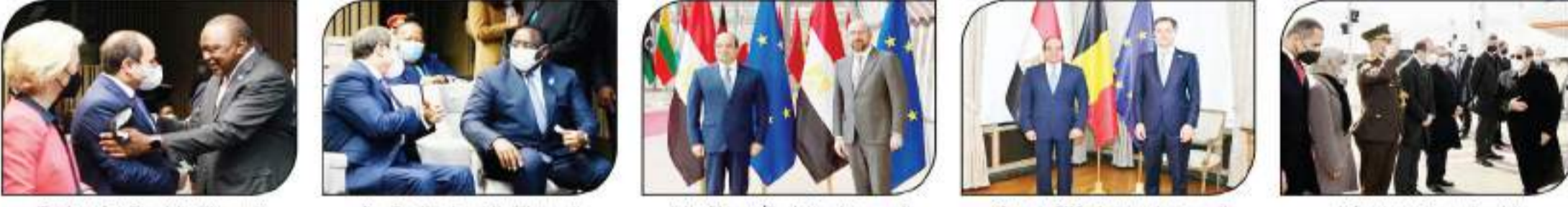
الرئيس السيسي لدى وصوله بروكسل