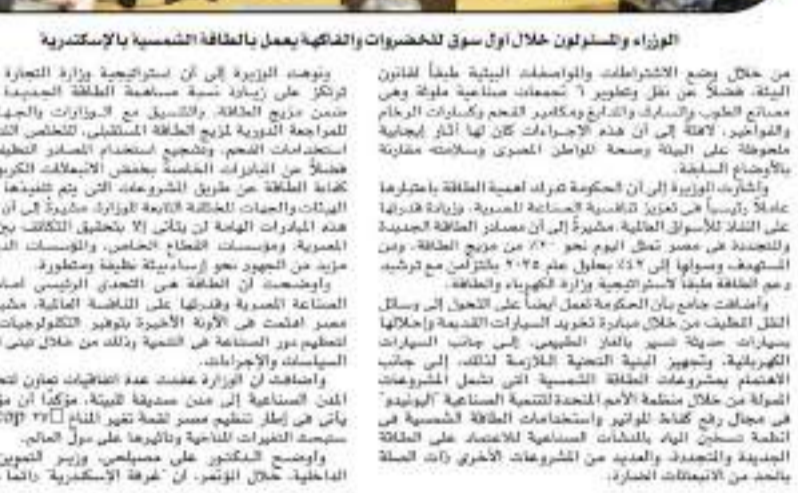
الوزراء والسفراء خلال أول سوق للخضراوات والفاكهة يعمل بالطاقة الشمسية بالإسكندرية