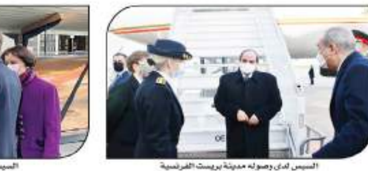
السيسي وماكرون في مدينة بريست