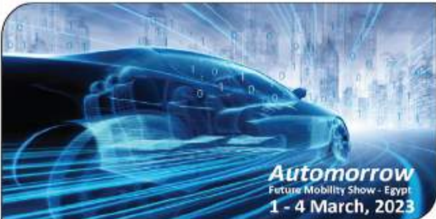
Automorrow Future Mobility Show - Egypt 1 - 4 March, 2023

تصميم تخيلى لجوستر المعرض التفوق، وهو ما سيهدم الرؤية الإيجابية لإطلاقها معرضها الجديد (Automorrow) والذي يتوقع له تحقيق نجاحات غير مسبوقة وخاصة مع ما يجعله من توجه نحو المستقبل.