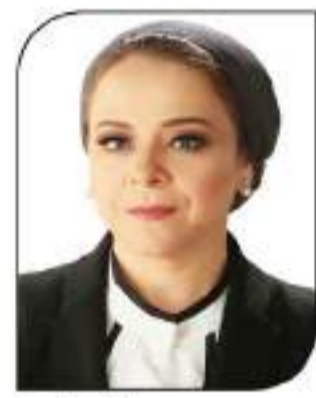
لهاد أبو القمصان

تلك ادعاء مزعوم من قبل ضحايا الابتزاز الإلكتروني، وهو ما دفعها إلى إبلاغ الشرطة عن جريمة الابتزاز الإلكتروني. وتعد هذه الجريمة من الجرائم الإلكترونية التي انتشرت في الآونة الأخيرة، وتتميز بالخطورة العالية على الضحايا، خاصةً عندما يتعلق الأمر بنشر صور مفبركة أو تهديدات بنشر معلومات شخصية. في سياق متصل، وجهت لهاد أبو القمصان، التي تتولى إدارة مركز التحقيقات، توجيهات صارمة للشرطة في التعامل مع هذه الجرائم، مؤكدة على أهمية التعاون بين الجهات المعنية لضمان سلامة الضحايا. وتعد هذه الجرائم من الجرائم الإلكترونية التي انتشرت في الآونة الأخيرة، وتتميز بالخطورة العالية على الضحايا، خاصةً عندما يتعلق الأمر بنشر صور مفبركة أو تهديدات بنشر معلومات شخصية.