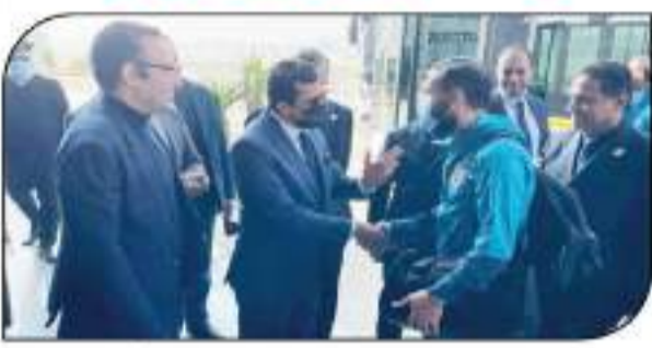
وزير الرياضة يستقبل بعثة الأهلي بالمطار