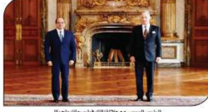
الرئيس السيسي مع جلالة الملك فيليب ملك بلجيكا