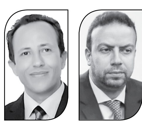
وليد جاب الله

فيقول المعايير العالمية للاحتياطات الدولية المطلوبة، كما ساعد في إعادة بناء أصول البنوك المصرية بالخارج وساعد في التصدي للخدمات الخارجية. وتوقع نائب محافظ البنك المركزي المصري، استمرار حالة الاستقرار والزيادة في حجم الاحتياطات الدولية نتيجة اتجاه البنك المركزي لسياسات نقدية ساعدت على إحداث كثير من الاستقرار وتحسين في تقييم الأوضاع الخارجية لمصر، وظهر ذلك في تقارير التصنيف الدولية للمصر من قبل مؤسسات التصنيف الدولية الأخرى.