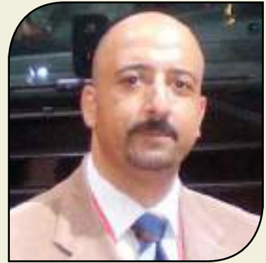
بقلم: أشرف كاره