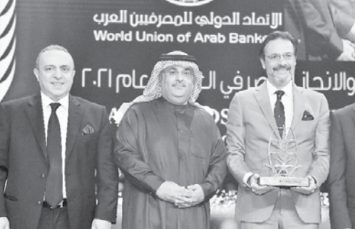
جوائز الريادة والابتكار الرقمي لعام ٢٠٢١

منح الاتحاد الدولي للمصرفيين العرب جائزة أفضل بنك عربي في الريادة والابتكار الرقمي لعام ٢٠٢١ للبنك الأهلي المصري، وذلك عن مشروع الوحدة المصرفية المتكاملة التي أطلقها البنك خلال العام الماضي، استم اسمها التجربة نياية عن البنك أمين مجموع رئيس مجموعة البنوك وذلك في احتفالية أقيمت بالمملكة الأردنية بعمروت.