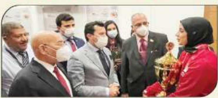
وإدارة على إنجازهم الرياضيين المهزومين بطولة العالم، متعباً لهم التوفيق في مسيرتهم الرياضية، بمواصلة التفائق والتفاح والفوز في مختلف المنافسات القارية، لفت الوزير إلى أن الرياضة المصرية تشهد تلوفاً

واتجاهات متتالية على مستوى جميع الميادين في كل البطولات الرياضية الدولية التي تشارك بها مصر، مشيراً إلى الدعم الكبير الذي يقدمه السيد الرئيس عبدالفتاح السيسي رئيس الجمهورية للرياضة المصرية، وكل الأبطال الرياضيين، والتي يساهم في تطوير ودعم الرياضيين لتحقيق مزيد من الإنجازات، أكد الدكتور أشرف سبيح على التامة الدورة لجهود الاتحادات الرياضية، والتنسيق معها واللجنة الأولمبية فيما يخص تهيئة الأجواء المحيطة باللاعبين وتوضيح المناخ المناسب لهم لتوفير البنية التحتية التدريبية المحددة لهم في إطار الاستعداد لخوض مختلف المنافسات الرياضية، بجانب العمل على توفير الدعم والريادة اللازمة للأبطال مصر الرياضيين.