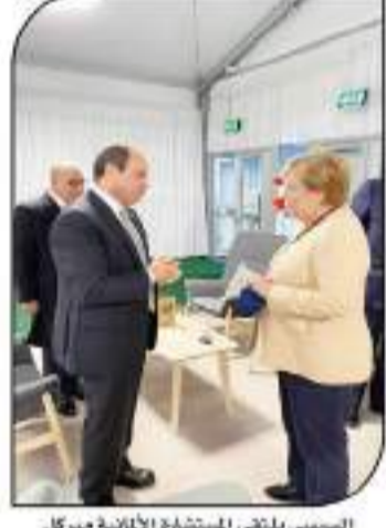
السيسي يلتقي المستشار الإماراتي ميركل