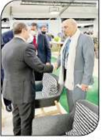
السيسي مع أمير الكويت