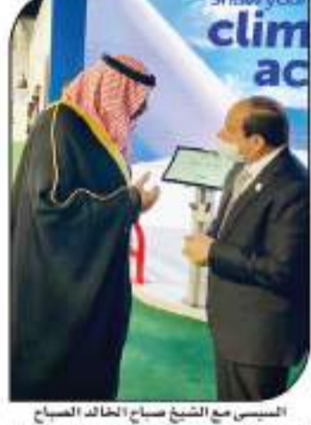
السيسي مع الشيخ صباح الخالد الصباح

وأشار إلى أن كلمة الرئيس السيسي، التي ألقاها في افتتاح قمة المناخ العالمية في جلاسكو، كانت بمثابة رسالة قوية للعالم، تؤكد على أهمية مصر في الوقت الحالي، خاصة في ظل التحديات التي تواجهها المنطقة والدول النامية، وذلك في ضوء الدور المهم الذي تقوم به مصر على المستويين الإقليمي والدولي في إطار مفاوضات المناخ.