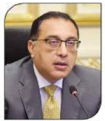
مصطفى مدبولى يتم التنشيط التدريجى للبنى الحكومية، واختيار الأنظمة الإلكترونية المختلفة لمدة 6 أشهر.

الرئيس وجه ببدء انتقال الموظفين تدريجياً إلى العاصمة الإدارية آخر ديسمبر كتب - وسيم كمال عقد الدكتور مصطفى مدبولى، رئيس الوزراء، اجتماعاً لمتابعة الموقف التنفيذي لمشروعات العاصمة الإدارية الجديدة، بحضور الدكتور حاسم المزار، وزير الإسكان والمرافق والمخاضات العمرانية، واللواء أحمد ركنى مابدين، رئيس شركة العاصمة الإدارية الجديدة، واللواء أحمد شحبة، مساعد رئيس الهيئة الهندسية للقوات المسلحة، والهندس عبدالمطلب عمارة، نائب رئيس هيئة المجتمعات العمرانية الجديدة، والهندس شريف الشربيني، رئيس جهاز العاصمة الإدارية، والقدم السيد علام، بالهيئة الهندسية للقوات المسلحة، رئيس الهيئة الهندسية للقوات المسلحة، والهندس عبدالمطلب عمارة، نائب رئيس هيئة المجتمعات العمرانية الجديدة، والهندس شريف الشربيني، رئيس جهاز العاصمة الإدارية، والقدم السيد علام، بالهيئة الهندسية للقوات المسلحة. وقال رئيس الوزراء إن الاجتماع يأتي لمتابعة توجيهات الرئيس عبدالفتاح السيسي، رئيس الجمهورية، بأن تبدأ الوزارة فى الانتقال التدريجى للبنى الحكومية بالعاصمة الإدارية الجديدة، نهاية شهر ديسمبر المقبل، بحيث