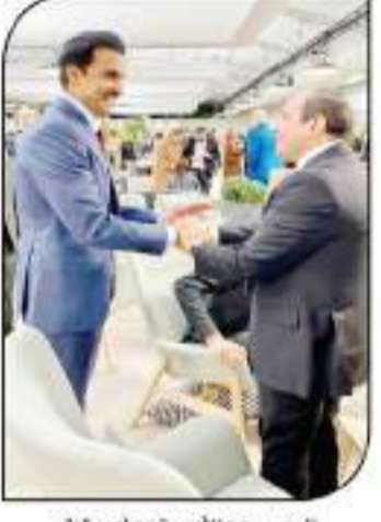
السيسي مع الأمير تميم أمير قطر

أكد خبراء اقتصاديون ومحللون سياسيون، أن كلمة الرئيس عبدالفتاح السيسي، التي ألقاها في افتتاح قمة المناخ العالمية في جلاسكو، كانت بمثابة رسالة قوية للعالم، تؤكد على أهمية مصر في الوقت الحالي، خاصة في ظل التحديات التي تواجهها المنطقة والدول النامية، وذلك في ضوء الدور المهم الذي تقوم به مصر على المستويين الإقليمي والدولي في إطار مفاوضات المناخ.