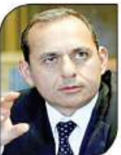
مشام عكاشة نيجة الإغلاق وتوقف النشاط ما أدى إلى تفاقم الأوضاع الصحية لشوهميا.

مشام عكاشة: تأثيرات كورونا الصعبة مستمرة وفى زيادة وتشكل أكبر التحديات كتب - عمرو بكر قال مشام عكاشة رئيس مجلس إدارة البنك الأهلي المصري إن تأثيرات كورونا الصعبة لا تزال مستمرة بل وتزداد وتضاعف ولا أحد يعلم متى يمكن أن تنتهى. وأشار عكاشة فى كلمته خلال مؤتمر البنك أن لوائح جائحة كورونا على الاقتصادات حول العالم، من أكبر التحديات التى تواجه الاقتصاد المصرى والقطاع المصرفى. وأكد عكاشة أن الوضع فى مصر يختلف عن بقى الدول فى ظل الحفاظ على حالة النشاط الاقتصادى وعدم العودة إلى الإغلاق والعمل على تحسين النشاط عبر حزمة مالية ضخمة، لافتا إلى أن عددا كبيرا من الدول واجهت ظروف اقتصادية صعبة