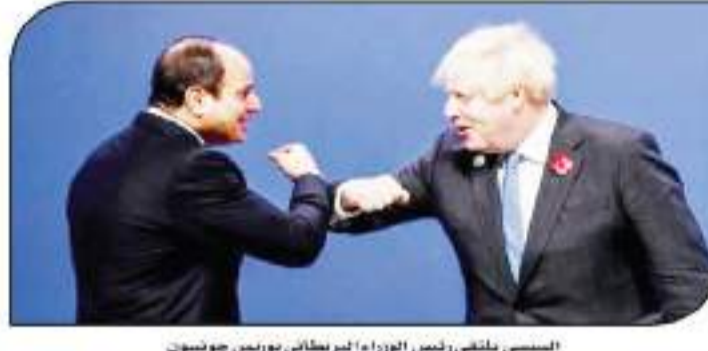
السيسي يلتقي رئيس الوزراء البريطاني بوريس جونسون