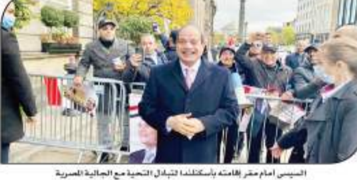
السيسي أمام مقر إقامة الملكة الملكة نورة مع العائلة المصرية