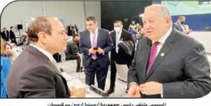
السيسي يلتقي رئيس جمهورية أرمينيا آرمن سركيسيان