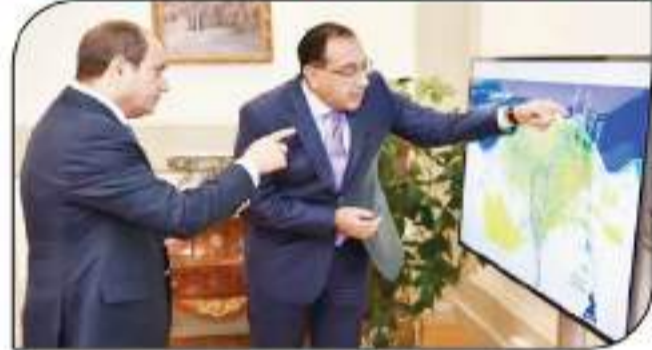
يبحث الرئيس عبد الفتاح السيسي مع الدكتور مصطفى مدبولى رئيس مجلس الوزراء، والدكتور حاسم المزار وزير الإسكان والمرافق والمخاضات العمرانية، عن مستجدات العمل فى مشروع كبرى الأقطاب فوق أرض السلام، سيبدأ فى محيط جيل موسى وسادات كاترين، حيث وجه السيد الرئيس بالاستمرار فى تسهيل التنشيط للمشروع لسفلا مع كافة تلك البقعة الخضراء من أرض مصر، وتطويرها لإنشائها وتطويرها من أرض على أعلى من الأرض، تشييداً لها فى الرؤية القومية التى تبين من كونها حاضنة للأديان المسيحية الثلاثة.

الرئيس يتابع تطوير منظومة المصارف فى الدلتا ومعالجة مياه الصرف الزراعى كتب - سعيد العربي اجتمع الرئيس عبدالفتاح السيسي الأربعاء الماضى مع الدكتور مصطفى مدبولى رئيس مجلس الوزراء، والدكتور حاسم المزار وزير الإسكان والمرافق والمخاضات العمرانية. وسرح السفير سام رشى المتحدث الرسمى باسم رئاسة الجمهورية بيان الاجتماع تناول استعراض الموقف التالى لعمل المشروعات القومية لوزارة الإسكان على مستوى الجمهورية، خاصة فيما يتعلق بالمساحة الأثرية والتراثية الجديدة، وشاغرة المرافق والمرافق والإسكان. وقد وجه الرئيس الحكومة بالبدء فى الانتقال الفعلى للمنشآت الحكومية الأثرية الجديدة اعتبارا من شهر ديسمبر القادم لتبدأ العمل فى المرحلة التجريبية لمدة 6 شهور، وذلك عقب انتهاء المرحلة التجريبية الحالية خلال منتصف الشهر المقبل. كما أطلع الرئيس على مستجدات العمل فى مشروع كبرى الأقطاب فوق أرض السلام، سيبدأ فى محيط جيل موسى وسادات كاترين، حيث وجه السيد الرئيس بالاستمرار فى تسهيل التنشيط للمشروع لسفلا مع كافة تلك البقعة الخضراء من أرض مصر، وتطويرها لإنشائها وتطويرها من أرض على أعلى من الأرض، تشييداً لها فى الرؤية القومية التى تبين من كونها حاضنة للأديان المسيحية الثلاثة. وقد شهد الاجتماع استعراض موقف المشروعات