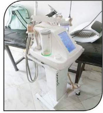
ضبط أجهزة تستخدم في الجلسات