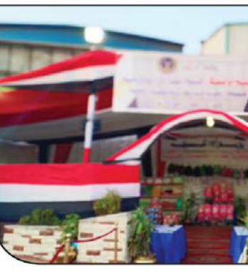
الموقع الرسمي لوزارة الداخلية

المجتمعية للمواطن من خلال توفير السلع والمستلزمات الأساسية، والاستجابة لمتطلباتهم في ضوء قرب موعد بداية العام الدراسي الجديد بما يحقق توطيد العلاقات الإيجابية مع المواطنين ويسهم في تحقيق مفهوم جودة العمل الأمي. كما اضطلع قطاع المشروعات والتنمية بوزارة الداخلية من خلال منظومة «أمان» التي تساهم في توفير السلع الأساسية التي تهم احتياجات المواطنين بهدف تحقيق التوازن والسيطرة على الأسعار، تجهيز (٢٢٠٠٠) شحنة مدرسية بدخلها المستلزمات والأدوات المدرسية لإهدائها لتلبية المدارس بـ (المنطق الأكثر احتياجًا والأولى بالرعاية) على مستوى الجمهورية بالتنسيق مع قطاعات الوزارة ومختلف مديريات الأمن، وذلك بدءًا من يوم ١٠ سبتمبر ٢٠٢١.