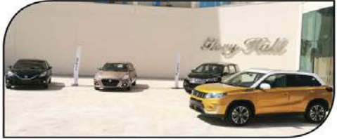
جانب من سيارات سوزوكي التي تم تقديمها بمنتج تيوليب ماجيستيك