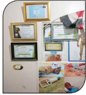
شهادات مزورة لأحد المعالجين