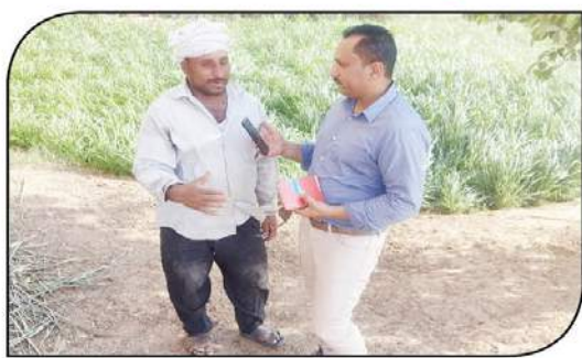
محررا السوق العربية يتحدثان مع المزارعين والمواطنين