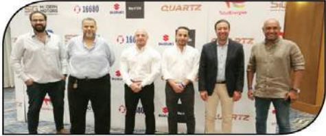
فريق عمل سوزوكي إيجيبت مستضيفاً ممثلي زيوت توتال