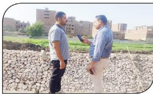
محررا السوق العربية يتحدثان مع المزارعين والمواطنين

وكذلك نظافة المياه غير ملوثة الغرض من تأهيل وتبطين الترع بمحافظة سوهاج هو الحفاظ على تقطة المياه وكذلك كفاءة على أماك الرى وصول المياه إلى نهاية الترع طبقا للتعليمات وبمسورة سهلة وسلمة والمائد الاقتصادي منها هو بعد الانتهاء من التأهيل والتبطين لا يتم تنظيف الترع كلما كانت مرة أو ثلاث مرات كما كانت من قبل وأن أكبر عملية تأهيل تتم في مدينة أخميم من حيث المساحة والتكلفة والنسبة لنا في رى أخميم الترع الوحيد داخل زمام الهندسة في ساقلة وأخميم سيتم تبطينها وأهليها والشروع الأهلى للتبطين والتأهيل الخاص للترع لأماك وزارة الرى تعتبر الأساسى في تحمل الماه اما فيما يخص التأهيل والتبطين والرى الحقلى هو خاص بالترع الكبيرة الرى تمتلكها وزارة الرى وهى التي تقوم بتوصيل الرى الحقلى بالساقى الصغيرة وخلال المرحلة القادمة سنقوم بالأهتمام لتلك المساقى والرى الحقلى ولكن في هذه