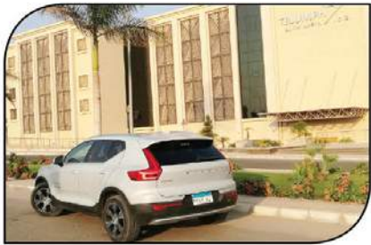
خطوط خلفية تؤكد بصمات سيارات فولفو وخاصة مع المصابيح الخلفية