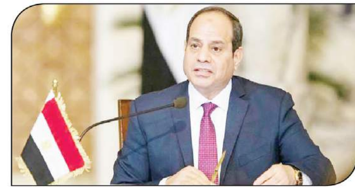
الرئيس عبدالفتاح السيسي

تشغيلها خلال أيام. وأوضح أن مشروع المحطة متعددة الأغراض بميناء الإسكندرية تم الانتهاء منه بنسبة ٧٥٪ والتي تقوم بتنفيذها مجموعة الغرابي للأعمال المتكاملة وشركة إيديكس الدولية للهندسة والمحاولات، ويقام المشروع على الأرصعة ٥٥- ٦٢ بميناء الإسكندرية بتكلفة ٥ مليارات جنيه. وكشف عن أن المشروع يصل طول أرصفة المحطة ٢٥٥٠ مترًا طوليًا وتشمل ساحات تداول نصف مليون مترًا وتستطيع استقبال من ٦-٧ سفن في نفس الوقت، وقادرة على تداول من ١٢ - ١٥ مليون طن بضائع سنويًا سيتم تقسيمها إلى ٣ محطات تداول حاويات - بضائع عامة - سيارات. وأوضح وزير النقل أنه يتم إنشاء محطات مماثلة في ميناء الدخيلة، إضافة إلى محطات بميناء السخنة، ومحطة تحيا مصر الخاصة بالحاويات بميناء دمياط، وتجد إقبالًا غير