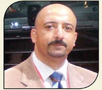
بقلم: أشرف كار