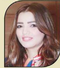
بقلم: سوزان جعفر