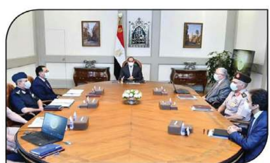
السيسى خلال اجتماعه مع رئيس الوزراء ووزير الزراعة الجديدة بإجمالى مساحة ٢,٢ مليون فدان، وتوفر مصادر المياه وذلك فى إطار الاستعداد لزراعات موسم المحاصيل الزراعية التى سيتم

الشتاء المقبل، كما تم عرض الدراسات الخاصة بمخطط زراعة النباتات العطرية والطبية التي تستخدم فى الصناعات الدوائية. وقد وجه الرئيس بقيام جهات الاختصاص بتكثيف حملات التوعية للمزارعين مع اقتراب موسم الزراعات الشتوية، وذلك بخصوص أفضل السبل والآليات الزراعية، وكذا استخدام أجود أنواع البذور، فضلاً عن التأكيد على فوائد وإيجابيات نظم السرى الحديثة والذكية، بما يساعد على ترشيد استخدام المياه ومضاعفة الإنتاج، وفتح آفاق التصنيع الزراعى، والتي من شأنها أن تساهم فى توفير العديد من فرص العمل، فضلاً عن تحقيق النمو الاقتصادى والتنمية المنشود.