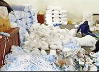
المخزن الذي تم ضبطه في القليوبية

تواصل الإدارة العامة لشروط الترميم والتجارة بالتنسيق مع إدرات وأقسام شرطة الترميم وشروطها الجغرافية بمديريات الأمن وقطاع الأمن العام، بتوجيه حملاتها الترميمية المكثفة لتسليم جرائم الشلل التجاري ومراقبة الأسواق وأسفرت الحملات عن ضبط (٣٨٩٠٠٠) عبوة كريم مسحضات جميل ومستلزمات طبية (كامية) جواتي - (سرجات) بدون مستندات «مجهولة المصدر» وغير مطابقة للمواصفات القياسية ذات الأثر البالغ للضرر على الصحة العامة. تمهيداً لتفريغها للبيوع والتداول بالأسواق بقصد الشلل والتدليس على جمهور المستهلكين وتحقيق أرباح بصورة غير مشروعة بحوزة المدير المسئول عن مخزن تجارة المستلزمات الطبية. وتم استحضار التجميل بدون ترخيص، وبمحافظة القليوبية. تم اتخاذ الإجراءات القانونية اللازمة، وجار عملها بادرته مركز شرطة طوخ وعدا من الدوائر والأقسام والمراكز بنطاق مديرية أمن القليوبية. أسفرت جهودها عن تحقيق العديد من النتائج الإيجابية أبرزها الاتي: ضبط ٢٦ قضية مخدرات.. ضبطت خلالها (كميات) من المواد والأقراص المخدرة المتوعدة. بحوزة ٢٨ متهمًا، ٦ منهم ملغ معلومات جنائية.