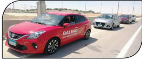
أثناء التجارب على طريق القطامية - الجلالة