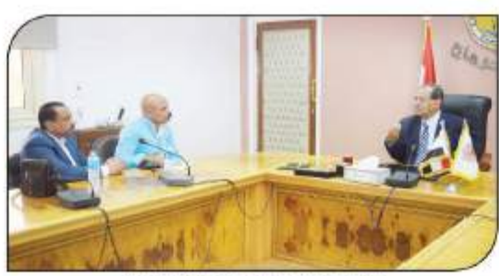
د. مصطفى عبد الخالق يتحدث لجمهور السوق العربية.

في البداية، فبمبادرة من جامعة سوهاج وبالتعاون مع وزارة التعليم العالي والبحث العلمي، تم تنظيم حفل استقبال للطلاب الجدد في مدينة سوهاج، وذلك بحضور عدد من المسؤولين الجامعيين والقيادات المحلية. وقد تم خلال هذا الحفل توجيه الترحيب للطلاب الجدد وتوضيح الإجراءات الاحترازية للحفاظ على سلامة الجميع. كما تم توزيع الكمامات وتعقيم أيديهم. وأكد الدكتور مصطفى عبد الخالق رئيس الجامعة على أهمية هذه الإجراءات في مواجهة فيروس كورونا، مؤكداً على التزام الجامعة بأعلى معايير السلامة.