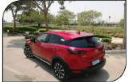
تفوقت مازدا على تصميم خطوط السيارة الخلفية

السرية الشهيرة، وهو الأمر نفسه الإيجابي في مساهمتها برفع القبول التنسي للسيارة، أما الكبح فجاء لشبه المثلثة وخاصة مع لغة توجيه عجلة القيادة الأربعة نظام أوتوماتيك، وهو ما يتغير به سلوك السيارة عند التاريد والقيادة في شتى أنواع التضاريس الواسعة والشيقة، في الوقت نفسه أثبتت فيه مازدا لـ (CX-3) قدرتها الفائقة العالية مع مجموعة عوامل الأمان والسلامة المعززة بها، بالإضافة لاستنها أداء مكثف هواجها على المسافات الطويلة والدرجات الحرارة الخارجية العالية والتي وصلت أشد تمرينتها إلى 44 درجة مئوية. التسويق والتنافسية: وضعت (جنس بي سيور أوتو) بين أيدينا الفئة الأعلى - المتاحة في مصر - من (CX-3) والتي حملت تسمية (Sport Safety) والتي جاءت مع سعر بلغ 450,000 ج.م، فيما جاءت أسعار الفئات الأخرى كما يلي: الأولى تحمل اسم (Luxury) بسعر 359,000 ج.م، والثانية تحمل اسم (Luxury Plus) بسعر 391,000 ج.م، والثالثة تحمل تسمية (Sport) بسعر بلغ 441,000 ج.م، فيما يزيد السعر بمتأدار 6,000 ج.م للسيارات القادمة مع الوان (Red Suit) و (Machine Grey) والذي شري أهما - نسبياً - وقدت منافسة في فئتها خاصة الحبيبة بسوق المصرية أمام قريباتها من السيارات مع كل من نيسان (جوك)، تويوتا (C-HR) و (DS 5) و (إس 3 كروس 27)، من خلال الاندماج الذي تم بين شركة (البيجوية) من قدرته من جودة تصنيع وسعر منافس بالسوق المصرية.