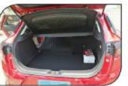
صنوق أمعة خلفي عمل وكثفة ممتدة التصميم نسبياً