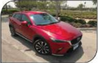
تصميم رياضي لخدمة السورلة