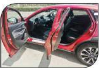
خان من اللامع فصيل المساحة التنسي الشاحنة الشاحنة الخلف

وبعض النظر عن خلف السيارة لأبصار الأشخاص بالمعرب عند الرور أمامهم - وهو ما يزيد احتجاز مائع السيارة بقيادة لها - فقد جاء انطباع قيادة مازدا (CX-3) ليكن وسفها بساطة شديدة (السيارة النموذجية للشباب) - ولكن مع مراعاة أن ركاب للوارة سيكونوا من فصار التامة أو الأطفال لنسوق الساعات المتوفرة لأزواجهم - فالأمر يبدأ بمدى تفاعل السائق والركاب مع البيئة الداخلية للسيارة (العرضة صوتياً) بمكثفة عن البيئة الخارجية معارفة على نظام الانشباع التتوق من BOSE، أما عن تعليق السيارة ومستوى تشاتها مع الطرق المتعبدة فهو بدريقة جيد جداً - وبخس النظر عن المطبات