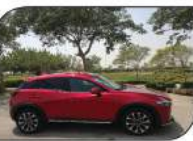
خطوط جانبية للسيارة تؤكد روح تصميم مازدا الرياضية