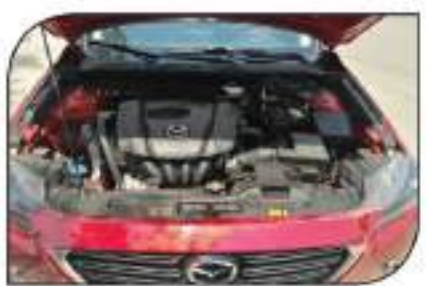
محركة 1.5 لتر بطوة 110 حصان قلنا ثلثنا ان المزيد من ذلك