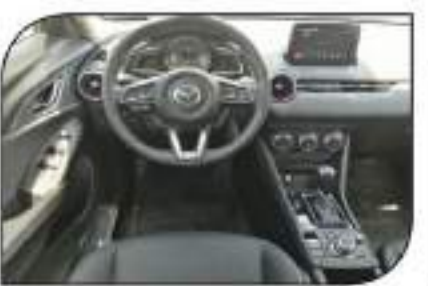
لوحه قيادة السيارة لتميز معاملاتها وتقلاتها