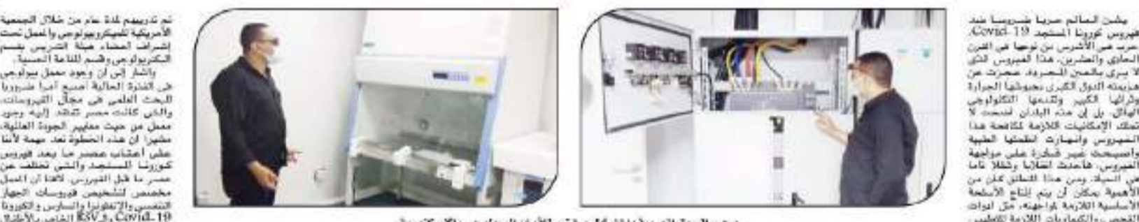
مخبر السوق العربية داخل أول مختبر للأمان البيولوجي بالإسكندرية