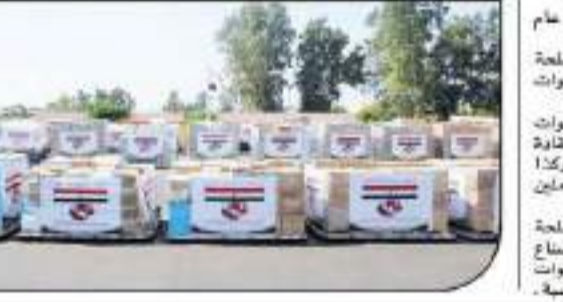
مساعدات طبية من مصر إلى تونس.

كشفت وزارة الهجرة وشؤون المصريين بالخارج زيارة وفد الشباب المصري واليوناني والقبرصي إلى قاعدة رأس التين البحرية بالإسكندرية، وذلك ضمن فعاليات مبادرة "شبابنا معاً"، والتي تهدف إلى تعزيز العلاقات بين الشباب من مختلف الدول العربية، وذلك في إطار تعزيز العلاقات الاستراتيجية بين الجانبين، وذلك في إطار تعزيز العلاقات الاستراتيجية بين الجانبين.