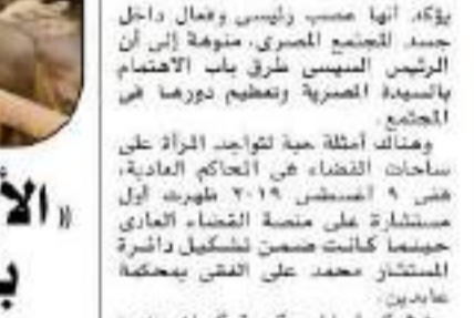
الاستشارية نجوى صادق