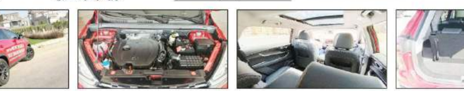
معدنية أمتعة خلفي يبدأ بـ 193 لترًا ليصل إلى 193 لترًا