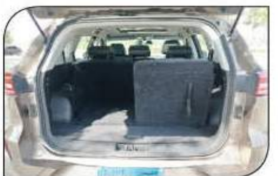
يتوفر لـجيتور ثلاثة صفوف من المقاعد