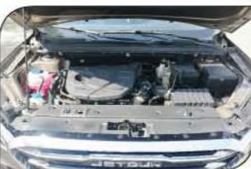
محرك اقتصادي عالي الأداء 1.6 لتر - تيربو