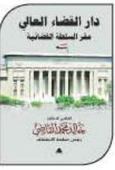
كل من هؤلاء المستشارين الكبار الذين يجب علينا تحديدهم والاقتداء بهم.

المعالي، والقضاء العسكري، أما الهيئات القضائية فهما التاية الإدارية وقضايا الدولة. ثم يعرض الكتاب لتأسيس دار القضاء العالي عام ١٩٢٧ وهو المبنى الذي يقع جغرافياً في وسط القاهرة، وقد تم بناؤه من تصميم معمارين فرنسيين ويخبر بالطراز البازيليك الروماني بأعمده الشاهقة وسالاه الواسعة وأبوابه الحديد، ومبانيه العالية التي تتزين بالرسومات الهندسية والزخارف الفنية الرائعة في الأسقف والسوالات، وداخل غرفه وممراته، واستعرض المبنى الشبه به في أمريكا وبريطانيا وفرنسا ومان. ويجول الكتاب داخل دار القضاء العالي - مقر السلطة القضائية ويضم ١٠ مقر محكمة التمييز ومجلس القضاء الأعلى، ورئيسة محكمة استئناف القاهرة، ومكتب النائب العام، كما كان مقراً للمحكمة الدستورية العليا حتى أواخر تسعينيات القرن الماضي، فضلاً عما يسهل يدار القضاء العالي من مقر تاني القضاء، وغاية المصالح، ومن خرج منه من وزراء العدل، ويعرض الكتاب المسير الناجية وسور رؤساء