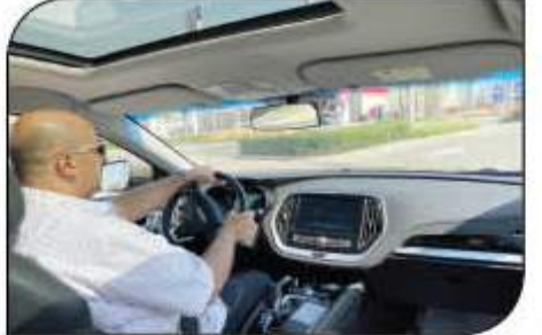
الزميل - أشرف كارم، أثناء التجربة