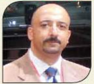
بقلم: أشرف كارم