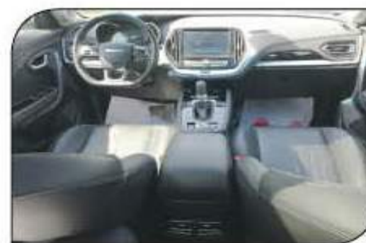
لوحة قيادة تجهيز بمعاييرها وتكاملها