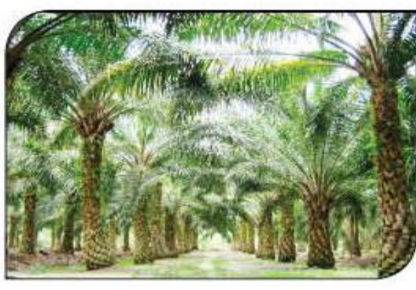
ريف مصر يعمل الآتي: تقديم الخشلات للمزارعين بسعر التنظفة (تشجيع المزارعين على الزراعة).

نخلة ممرية تده في إنتاج الثمار بعد ثلاث سنوات وتنتشر بدة ٢٥ سنة ولكن الثمار من صورة غنقو كبير يشتمل على حوالي ٢٠٠٠ شرة ومن لحم الثمار يتم استخراج زيت النخيل ومن النواة (البزر) يتم استخراج زيت نوى النخيل. وأشار «بيوي» إلى أن عملاً من ١٢٠ نخلة زيتون تغطي ٨٥٠ كجم زيت فيكون إجمالي الزيت المستخرج من ١٥٦ مليون نخلة زيت ١٠٠٠٠٠٠ (مليون ٩٢ ألف طن زيت زيتون). وإذا علمنا أن ١٦٠ نخلة تغطي ٥ طن زيت فيكون إجمالي زيت النخيل المتحصل عليه من ١٥٦ مليون نخلة يصل إلى ٤٨٧٥٠٠٠ (٤ ملايين ٨٧٥ ألف طن زيت نخيل) ويأخذ نخل ما نحصل عليه من زراعة أشجار الزيتون ونخيل الزيت يصل إلى خمسة ملايين و٩٢٧ ألف طن زيت زيتون وزيت نخيل. أي أن ما نحصل عليه من زراعة هذين المحصولين يغطي الاستهلاك المحلي وقدره مليون ومائتا ألف طن سنوياً ويبقى أربعة ملايين و٧٧٧ ألف طن للتصدير. وأضاف بأن هذا بالإضافة إلى إمكانية الاستعانة عن زراعة المحاصيل الزيتية الأخرى، والتي تقدر مساحتها بـ ٢٪ من مساحة الأرض المزروعة (٨,٦ مليون فدان). أي أن هناك حوالي ٢٥٠ الف فدان يمكن زراعتها بمحاصيل الحبوب بدلاً من محاصيل الزيت. وذلك تزيد من المساحة المحصولية من محاصيل الحبوب بنسبة الألف.