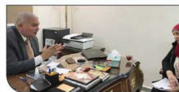
اللواء أيمن حلمي يتحدث لمحرة السوق العربية