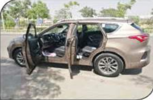
إتساع داخلي ملحوظ لمقصورة ركاب السيارة

● اقتتاد القسم الخلفي بالسيارة لوجود زجاج مظلل (هاميه) شأن العديد من السيارات الأخرى بنفس الفئة بالسوق المصرية.