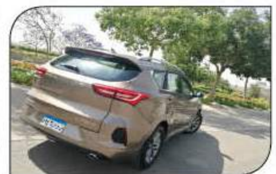
تصميم رياضي واضح لهدمة السيارة