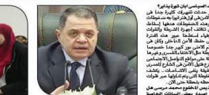
اللواء محمد إبراهيم