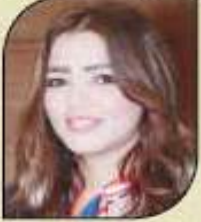
بقلم: سوزان جعفر

مصر صام أمام المنطقة أينما يكمن الخطر شاهدنا يا مصر بأن تكون فوق الوباء تحت التلال أمامنا أسود مخيفة الحق تجرى أمرك مصر ترحم السلام تبت الأمان ترس أوروبا شراها يقوى السماء يشق البحار والأهالي بيقي النهوض كلمات أحمد شوقي