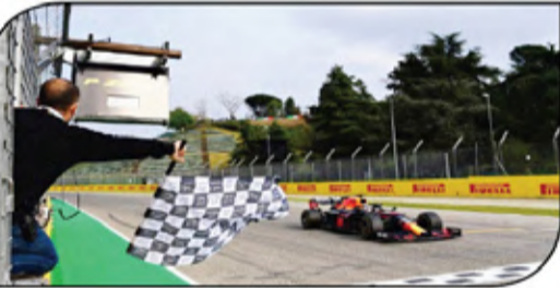
فيرستابن يقطع خط النهاية