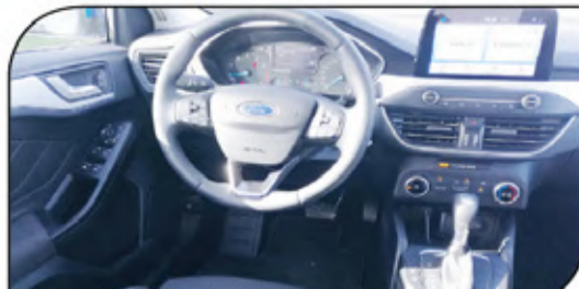
لوحة قيادة متكاملة التجهيزات وسهلة التعامل معها