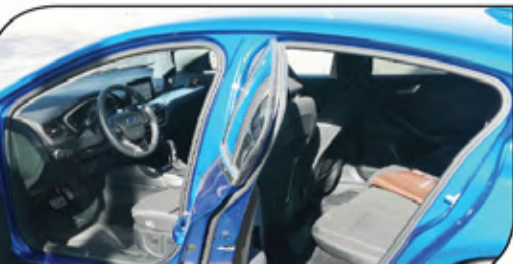
مقصورة ركاب رحيبة لركاب المقدمة والمؤخرة

وبالنسبة لمقصورة الركاب فقد جاءت مع مجموعة جيدة من