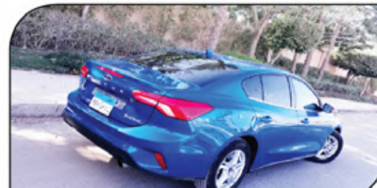
ازدادت خطوط فوكاس الخلفية رياضية عن الجيل السابق