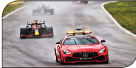
سيارة الأمان لعبت دوراً هاماً بجولة إيمولا هذا العام