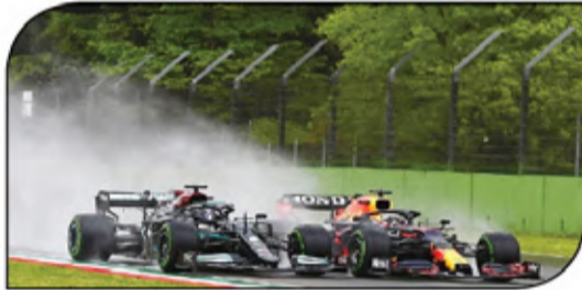
فيرستابن أثبت تنافسية واضحة يتفوقه على هاميلتون من اللفة الأولى للسباق