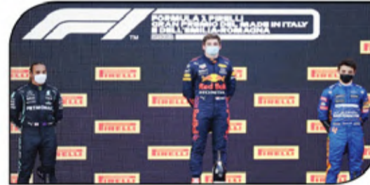
منصة تتويج الجولة الثانية