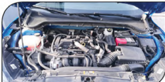
محرك ثلاثي الأسطوانات بدون تيربو ويستخرج ١٢٠ حصاناً