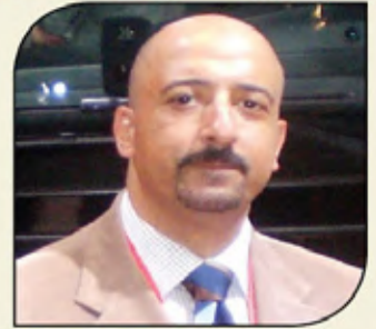
بقلم: أشرف كاره