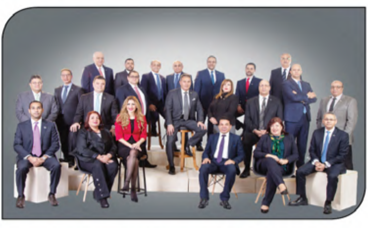
البنك المصري يحقق طفرة في معدلات نمو جميع قطاعات الأعمال ويقفز إجمالي أرباحه قبل الضرائب إلى 24 مليار جنيه مصري بمعدل نمو 40% مع سداد 13 مليار جنيه مصري للضرائب ليصل صافي الربح إلى 11 مليار جنيه بمعدل نمو بنحو 29%

كذلك أطلق بنك مصر أول بنك رقمي بالتعاون مع شركة اتوس الفرنسية هي مصر، والذي يعد المشروع الأول من نوعه في مصر، حيث تعاقب البنك مع شركة اتوس، أحد أكبر الشركات العالمية المتخصصة في مجال إنشاء البنوك الرقمية. وجدير بالذكر أن بنك مصر يعد من أكبر البنوك التي لها باع في مجال المسؤولية الاجتماعية ومن أكثر المؤسسات إدراكا للمسؤوليات البيئية والاجتماعية والإنسانية، وكماضفة الفسار، والمشاركة المجتمعية، مع فروعها الحركة التي تشع على عاتق المؤسسة وتتكامل مع معايير أدائها واستدامة أعمالها على المدى الطويل، وهو أول بنك مصري معكوك للبيئة يحصل على موافقة منظمة المعايير الدولية لتقرير الاستدامة (GRI) ويقوم بتقرير الأعمال بالتوافق مع مبادئ الاستدامة من خلال مراعاة الحوكمة وحقوق الإنسان، وكماضفة الفسار، والمشاركة المجتمعية، مع معايير معايير السلامة البيئية، هذا كما يتوافق البنك مع معايير الأمم المتحدة UN Global Compact للالتزام (المسؤولية الاجتماعية للمؤسسات)، هذا كما حرص البنك مؤخرا على الانضمام للمبادرة العالمية للتأهيل لبرنامج الأمم المتحدة للبيئة لإطلاق «البنك المصري المسؤول»، والتي تستهدف تحقيق التنمية المستدامة والمسؤولية الاجتماعية والبيئية للمؤسسات، وجدير بالذكر أن بنك مصر قام بإطلاق 1.5 مليار جنيه تبرعات في مجال التنمية المجتمعية لعام المالي 2020/2021.