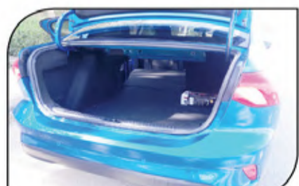
صندوق أمتعة خلفي بمساحة تحميل جيدة في فئة السيارة