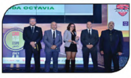
سكودا اوكتافيا تم اختيارها الأفضل بفئة السيدان من الصحافة المصرية