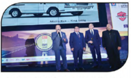
جانب من ضيوف ومكرمى الإحتفالية