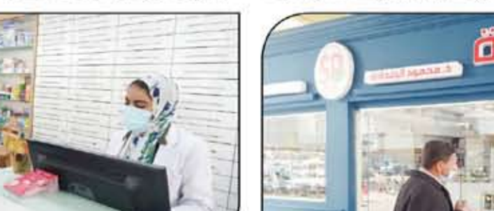
محور السوق العربية يتحدث مع الصيدلانية والمواطنين

تحقيق ساجد النوري - محمد أبورية - محمود مهران