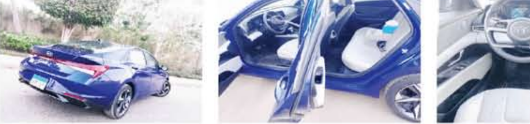
لوحة عدادات متطورة في فئتها ومتكاملة الإعدادات