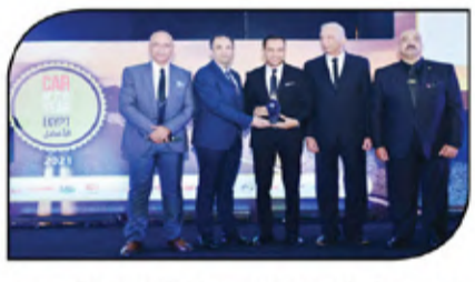
المصرية للسيارات توصل تصورها لأفضل موزع في مصر