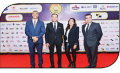
فريق المصرية وفريق المنصور وتعاون إيجابى مستمر