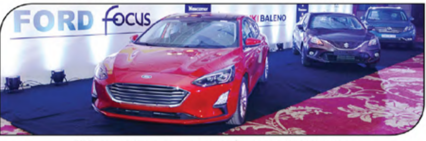
سيارات تعرض لأول مرة رسمياً - فورد فوكس، سوزوكي بالينو وإيجل 580

وفي فئة السيارات 7 راكب تنافست السيارة تويوتا هورتشنر الجائزة بنسبة أصوات بلغت 33.25% مع السيارة الصينية إيجل بنسبة أصوات بلغت 32.93% حيث قل الفارق بينهما عن 1%.