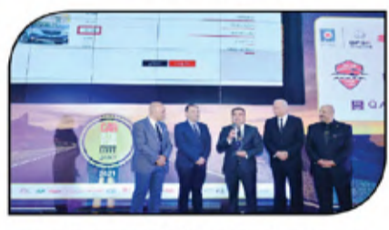
أوبل جرانولاند أفضل SUV باستفتاء الأفضل