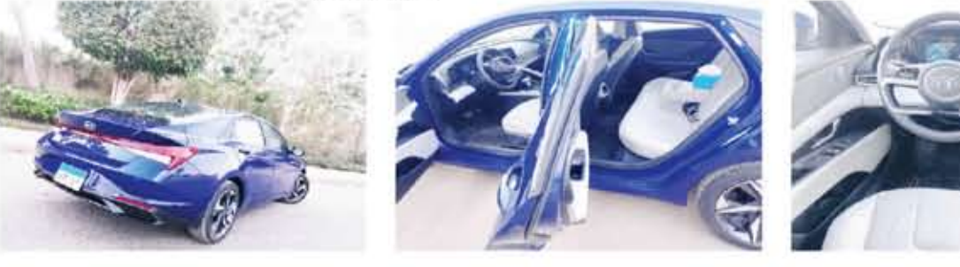
خطوط خلفية رياضية حادة واستثنائية

استخراج أقصى عزم له يبلغ 155 نيوتن متر/ 4850 د.د. وهو ما يؤكد مدى سلاسة تشغيل هذا المحرك على السرعات المتوسطة، وقد تصل هذا المحرك بمسندتي وساهم برفع مستوى ترفيهه على الطريق من جانب آخر، وفي الوقت نفسه الذي يملأ فيه النظام النسيب عالي الجودة من نوع (BOSE) مما يعطي جواً رائعاً للاستماع الداخلي كأحد علامات نجاح هذه الفئة (العائلية النشيطة)، كما دعمت للمسورة بجهاز تكييف أوتوماتيكي على الأواء ثنائي الجانبي بالأمام، بخلاف فتحات تكييف الخلف. الأمان والسلامة: تتميز (إيلانترا) بتميزها بالعديد من وسائل الأمان المعروفة لدى سيات هو الأمر العادي لدى سيارات الشركة من الأجيال الحديثة وخاصة مع تقييها المتقدم عززت نظام تحسس الركن بالخلف (Park Tronic) بوجود كاميرا خلفية، كما عززت بمجموعة من أنظمة الأمان الفاعلة شأن (EBD, ABS, ESP, HAC, EPB) التي تعمل على عزلة على نظام (Auto Hold) الذي يعمل على راحة الحرك ونائل الحركة عند التوقف التام وخاصة بالإشارات المرورية، وذلك بخلاف نظام تشبه عند هذا الأطنان لسودي الضغط المناسب لها.. وغيرها هذا بالإضافة لأنظمة الحماية من السرقة. الحرك والتدبية: وفرت هيونداي ل(إيلانترا) محرك اقتصادي سعة 1.6 لتر MPI يتسكن من استخراج طاقة حاصية تبلغ 126 حصاناً/ 6300 د.د. ويمكن هذا المحرك من