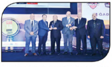
فريق جنرال موتورز مصر