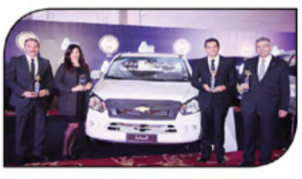
فريق جنرال موتورز مصر