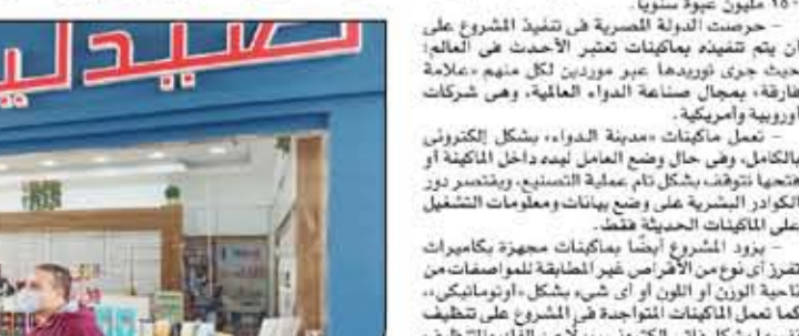
محور السوق العربية يتحدث مع الصيدلانية والمواطنين