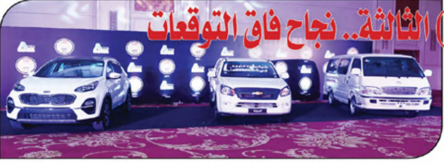
نماذج السيارات التي مثلت فئات قطاعات أميك

الركائز الأساسية لحل Car of the year Egypt - الأفضل، حيث شارك مجموع أصوات كلية هذا العام وصل إلى 185330 ألف صوت، والتي شملت عدة فئات كان منها: