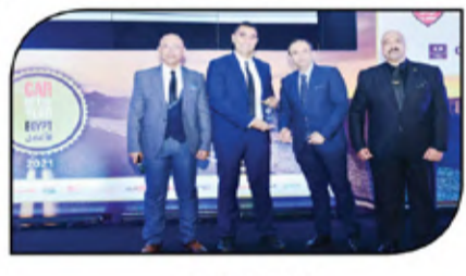
تكريم جيتور مصر