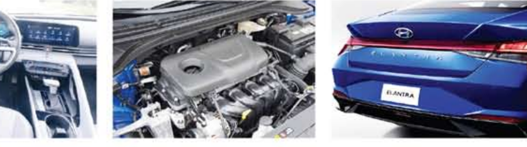
إضاءة خلفية مميزة للجيل الأحدث من إيلانترا