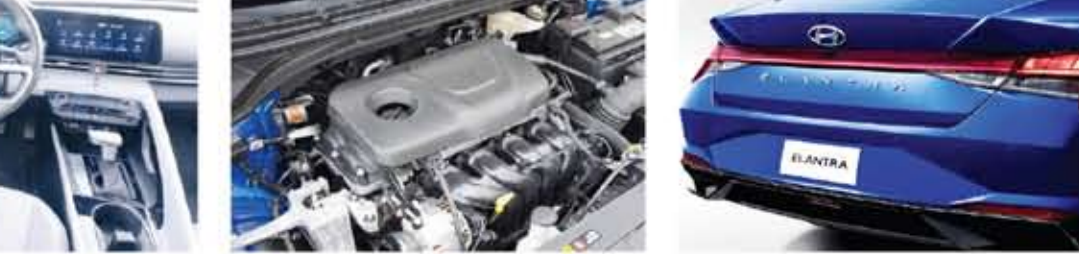
إضاءة خلفية مميزة للجيل الأحدث من إيلانترا