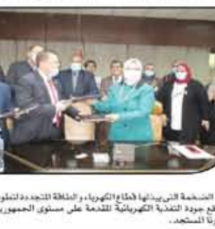
محطة محولات المنصورة لتغذية المتحف المصري الكبير