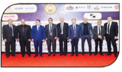
جانب من ضيوف ومكرمى الإحتفالية