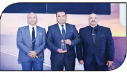
تكريم رابطة تجار مصر