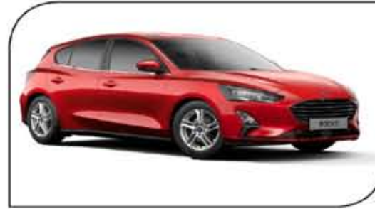
خطوط رياضية تبرز فوكاس هاتشباك