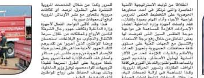
وتنسيق الإدارة العامة للمرور مع الأحياء لتوفير سيارات شطف مياه بالشرب من الأنفاق.