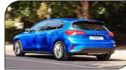
خطوط خلفية للفئة هاتشباك تتميز بعصريتها