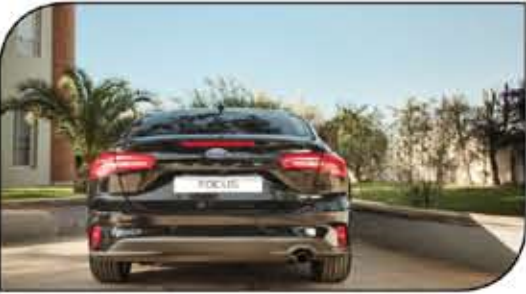
خطوط عصيرية لخلفية فوكاس سيدان

قامت شركة أوتو جميل وكيل فورد في مصر بتقديم الجيل الجديد كلياً من فورد فوكاس 2021 للسوق المصرية مؤخراً وذلك بعد غياب هذا الطراز الشهير من فورد لمدة عامين عن السوق المصري لأسباب تتعلق بالانتاج. ويأتي الجيل الجديد من فوكاس والمصنع في ألمانيا بأبعاد خارجية أكبر من الجيل السابق بشكل ملحوظ ومواصفات أمان أعلى في كل الفئات ومستوى غير مسبوق من التكنولوجيا والظخامة. فورد فوكاس الجديدة 1.5 .. بتصميم خارجي مبهج: اعتمدت فورد في تصنيع السيارة من الخارج على المزج بين الأناقة والظخامة من ناحية والديناميكية والشخصية الرياضية من ناحية أخرى لتتضمن فورد فوكاس 2021 الجديدة كلياً إلى قائمة المقارنة بفئات سعوية أعلى. ويمكن من الوهلة الأولى ملاحظة كبر حجم السيارة عن سابقتها في الطول والعرض والارتفاع بما يجعلها من الأكبر في فئتها وعززت التصميم الأيروديناميكي بستائر إلكترونية خلف الشبكة الأمامية تعمل أوتوماتيكياً في توجيه الهواء مما يقلل من مقاومة جسم السيارة للهواء في السرعات المختلفة وهو ما يساهم في تعظيم أداء السيارة على الطريق وفي استهلاك الوقود. كما حرصت فورد أيضاً على تحسين ارتفاع الخلفوس الأرضي بما يجعلها الأفضل في فئتها لتتناسب الطرق في مصر. ويتعكس الحجم الخارجي الجديد على الأبعاد الداخلية للسيارة بحيث جاءت فورد فوكاس 2021 بكابينة أوسع في جميع الاتجاهات بحيث زادت مساحة الركاب في الكراسي الأمامية بنسبة 35% كما زادت المساحة الخلفية بنسبة أكثر من 40% أيضاً تم تزويد السعة التخزينية لصندوق الأمتعة بنسبة 28% عن سابقتها. فورد فوكاس الجديدة بمحرك Dragon 1.5 TI-VCT، تجمع بين الثبات والوهرف في استهلاك الوقود بناقل حركة أوتوماتيكي سداسي السرعات،