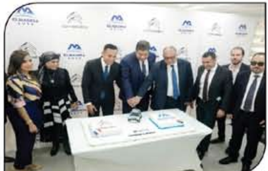
يادات المصرية والقصاروي يحتفلون بإفتتاح الفرع الجديد