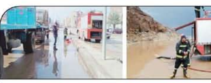
وتنسيق الإدارة العامة للمرور مع الأحياء لتوفير سيارات شطف مياه بالشرب من الأنفاق.