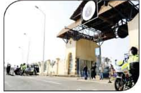
مقر الإقامة. وأكد الوزير ضرورة اتخاذ إجراءات أمنية غير تقليدية لإخراج تلك الفعالية بالمستوى الذي يتناسب ومكانة مصر ويمكن الوجه الحضاري لها أمام العالم.

أنهت أجهزة وزارة الداخلية استعداداتها اللازمة لتأمين فعاليات بطولة كأس العالم للرمية على الأطباق 2021. وتشمل الخطة الأمنية استنفارا أمنيا ورفع درجة الاستعداد من خلال الانتشار الأمني المكثف لرجال الشرطة والأجهزة الأمنية بمحيط مدينتي الرياض التي تشهد فعاليات البطولة بالإضافة لنشر الخدمات مرورية لتسيير الحركة المرورية بالطرق لتسهيل الحركة المرورية وتسهيل تحركات وفود الدول المشاركة خلال فعاليات البطولة. وتعد خطة التأمين لحماية المنشآت الهامة الحيوية وإحكام الرقابة من خلال عدد من الدوائر الأمنية ودعم الخدمات الأمنية بالمنطقة المحيطة بها. والدعم بقوات التدخل والانتشار السريع للتعامل الفوري مع جميع الوافدين الطارئة للحفاظ على الأمن والنظام. فأتى ذلك الإجراءات وسط تواجد مبدئيا من قبل الدوائر الأمنية والمستويات الإشرافية. لتلبية الترتيبات المشتركة في عمليات التأمين. للتأكد من جاهزيتها للاستعداد بالاهتمام الوكيلة إليها من قبل الجهات المختصة بالدولة. مؤسسة الجهود واستنفار كافة القوات لتوفير مناخ آمن لإقامة فعاليات البطولة. بما يساهم في إظهارها بالصورة الحضارية المشرفة التي تليق بالدولة المصرية وقد نجحت أجهزة وزارة الداخلية في تأمين فعاليات بطولة كأس العالم لكرة اليد 2021 من خلال خطة أمنية شاملة وتشمل الخطة الانتشار استنفارا أمنيا. ورفع درجة الاستعداد من خلال الانتشار الأمني المكثف بمحيط المنشآت والمناطق التي ستشهد فعاليات البطولة. وتسيير فرق أمنية وخدمات مرورية لتسيير الحركة المرورية بالطرق لتسهيل الحركة المرورية.