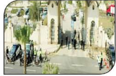
وتمتلك الشرطة المصرية خبرة واسعة في تأمين الأحداث العالمية، كما تم تدريب قوات الأمن على التعامل مع حالات الطوارئ.