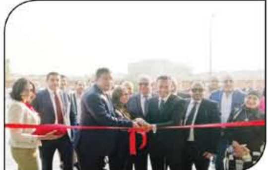
لحظة قص شريط الإفتتاح