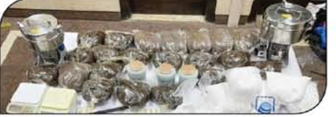
كافة بدو، فتم ضبطه أول مرة لسرقة لاحتلالها في تصنيع المواد المخدرة والذخائر كالمكان.