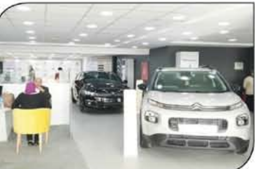
كافة الخدمات متاحة لعملاء الشركة