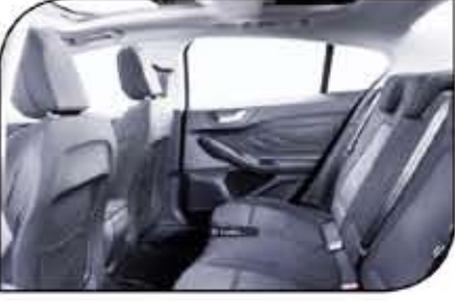
مساحات كبيرة لراحة ركاب المؤخرة