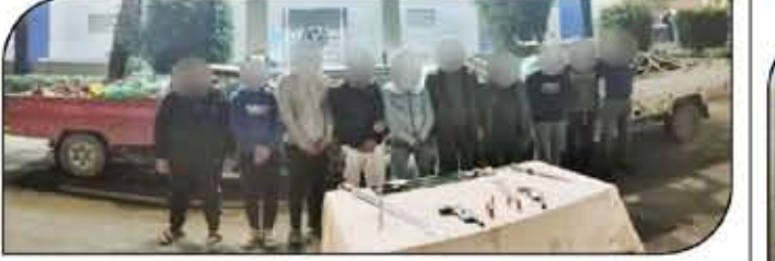
كافة بدو، فتم ضبطه أول مرة لسرقة لاحتلالها في تصنيع المواد المخدرة والذخائر كالمكان.