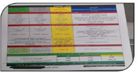
إحدى أوراق تعاقد المتعاقد