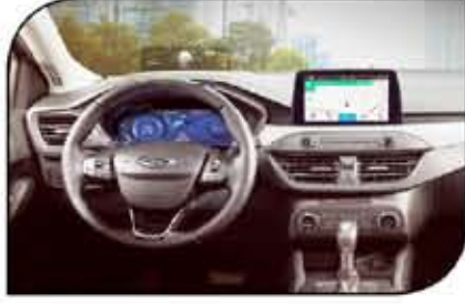
أكدت فوكاس الجديدة على حداثة وتطور تجهيزات القيادة

عالي الجودة شديد الوضوح والنقاء بأبعاد مجسمة ينبعث من خلال 10 سماعات مكبرة موزعة بشكل مثالي. كما جهزت الكابينة بأنظمة تكنولوجية مختلفة للمزيد من الراحة ولسهولة القيادة مثل فرامل يد كهربائية في جميع الفئات وعدادات ديجيتال للفئة الأعلى. 4 فئات سيدان وفئة هاتشباك لفوكاس الجديدة تناسب كافة متطلبات العملاء بسعر مناهس للغاية. تأتي فورد فوكاس 2021 بـ 4 فئات سيدان وفئة هاتشباك، الفئة الأولى وهي (Trend) بـ 345,000 ألف، والفئة الثانية