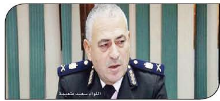
اللواء سعيد طعيمة

وقال اللواء سعيد طعيمة، عضو مجلس النواب ومدير إدارة المرور الأسبق إن قانون المرور الجديد لا يلجأ في حل أزمات المرور. مؤكداً أن الحل ليس في القانون، وإنما العيب في تطبيق القانون، مؤكداً أنه تم التمسك من دولة خليجية تتبع الأسلوب العنصر الحديث الذي يعتمد على العمل بشكل إلكتروني، بما في ذلك البشري والمواظون في هذه الدولة ملتزمون لأنها تطبق القانون الموجود بالفعل وكل شيء محسوب عليهم بسبب تطبيق نظام تكنولوجيا سارم، ومسرر أخذت شكل القانون وعززت عن تطبيقه هيدون نظام إلكتروني يشمل قاعدة بيانات شاملة هذا القانون لا شيء.