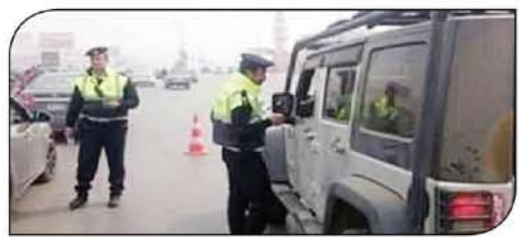
جنيه بدلا من ١٠٠٠ جنيه مخالفة سير عكس الاتجاه - عقوبة تجاوز السرعة المقررة على الطرق وعدم استخدام اللوحات المنعزلة المنسوجة من الزرور والسيربين فرامل

وقال اللواء سعيد طعيمة، عضو مجلس النواب ومدير إدارة المرور الأسبق إن قانون المرور الجديد لا يلجأ في حل أزمات المرور. مؤكداً أن الحل ليس في القانون، وإنما العيب في تطبيق القانون، مؤكداً أنه تم التمسك من دولة خليجية تتبع الأسلوب العنصر الحديث الذي يعتمد على العمل بشكل إلكتروني، بما في ذلك البشري والمواظون في هذه الدولة ملتزمون لأنها تطبق القانون الموجود بالفعل وكل شيء محسوب عليهم بسبب تطبيق نظام تكنولوجيا سارم، ومسرر أخذت شكل القانون وعززت عن تطبيقه هيدون نظام إلكتروني يشمل قاعدة بيانات شاملة هذا القانون لا شيء.