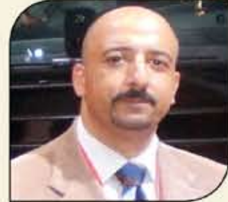
بقلم: أشرف كاره