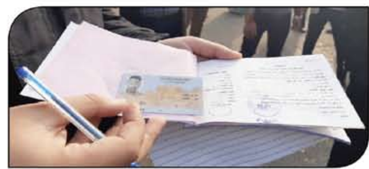
القاهرة - غرامة ٢٠٠٠ جنيه في مخالفة تركيب زجاج فاميه - ومخالفة الانضباط البيئي ومخالفة ترك السيارة صف ثان في الأماكن الممنوع بالانتشار بها - غرامة من