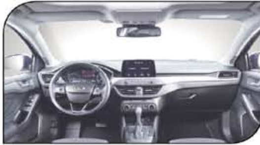
أعادة فورد تصميم لوحة عدادات السيارة بشكل أكبر عملاقية