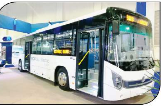
MCV C120 EV

6000 أوتوبيس سنوياً، وتتم العمليات الصناعية بمكونات محلية تتخطى 60% في بعض المنتجات والتي تستهدف تصدير ما يزيد على 60% منها. هذا، وتشرف MCV بأن يعمل بها أكثر من 5,000 عامل ومهندس، يدعمون بقوة كافة قطاعات عمل مجموعة MCV