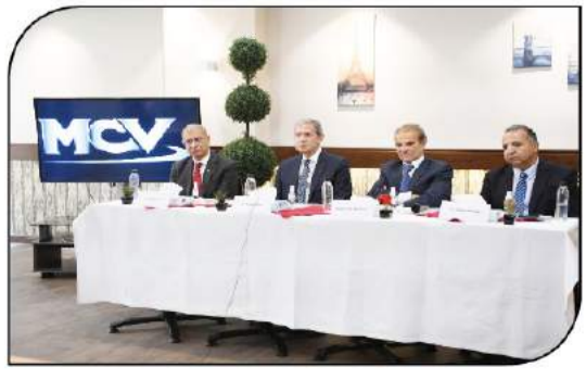
مئتمنة المؤتمر الصحفي