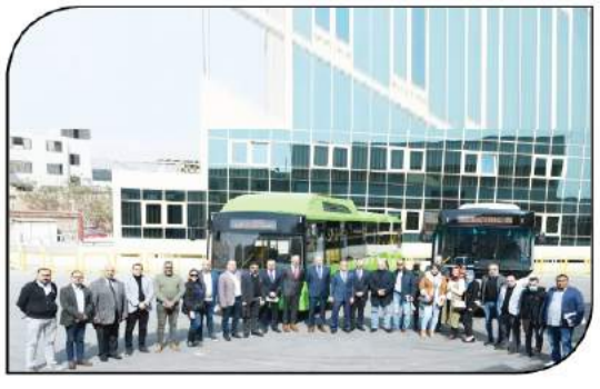
مجموعة الصحافيين وممثلى الإدارة العليا أمام أحدث أوتوبيسات الشركة