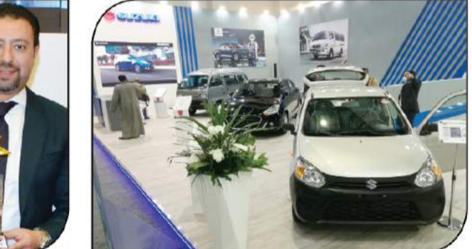
سوزوكي قدمت مجموعة سياراتها العاملة بالغاز الطبيعي