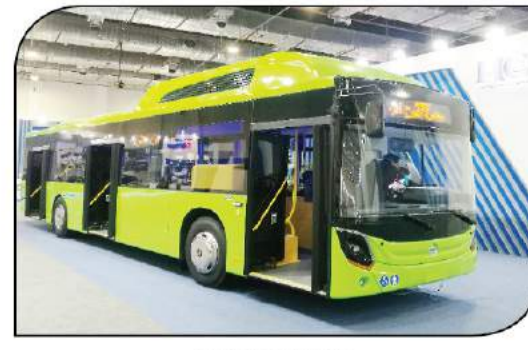
MCV C127 CNG