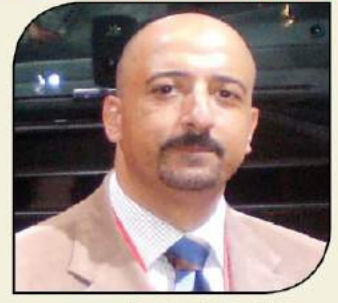
بقلم: أشرف كاره