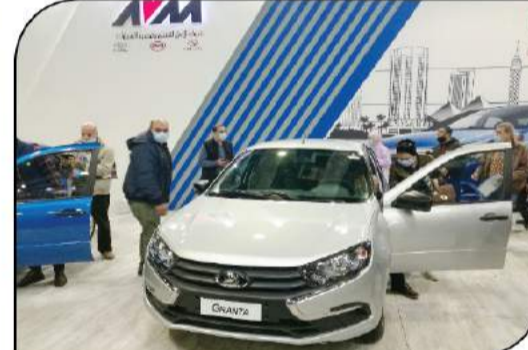
مجموعة الأمل قدمت لادا إلى جانب (بي واي دي) العالمتين بالغاز