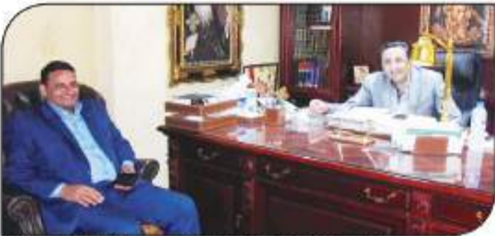
د. إيهاب رمزي يتحدث بحرة السوق العربية

في لقاء مع «الجمهورية» تحدث النائب عن عمله في المنيا، وعن خططه المستقبلية، وعن دوره في مجلس النواب، وعن أهم القضايا التي تهمه في المنيا، وعن أهم المشروعات التي ينفذها في المنيا، وعن أهم التحديات التي تواجهها المنيا، وعن أهم الحلول التي يبحث عنها في المنيا، وعن أهم التوصيات التي يقدمها في المنيا، وعن أهم المقترحات التي يقدمها في المنيا، وعن أهم الأدوار التي تؤديها في المنيا، وعن أهم المسؤوليات التي تقع على عاتقها في المنيا، وعن أهم التحديات التي تواجهها في المنيا، وعن أهم الحلول التي يبحث عنها في المنيا، وعن أهم التوصيات التي يقدمها في المنيا، وعن أهم المقترحات التي يقدمها في المنيا، وعن أهم الأدوار التي تؤديها في المنيا، وعن أهم المسؤوليات التي تقع على عاتقها في المنيا.