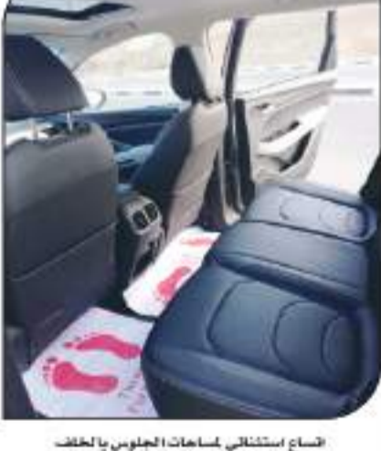
الساح استثنائي لمساحات الجلوس بالخلف

أن أول ما يجذب اهتمام المتطلع على (CAPTIVA) هو حجمها لتقوم بخطوط (شيفروليه) الحديثة مع خطوطها التصميمية الرياضية الجادة خاصة مع القدمة وعطاء المحرك علاوة على التسويق الخشني للسيارة ورافقتها التغطية التي تؤكد من عضلاتها رياضية التصميم ومع ملاحظة ارتفاع السيارة عن الأرض من عرض يبلغ (١٨٥) سم وهو ما أثر في سلاستها- خاصة أمام عملائها ضمن نفس الفئة- وأيضاً مع مراعاة بناها على قاعدة عجلات تبلغ ٢٧٥٠ مم، فيما جاء طول السيارة الإجمالي بمقياس 4٧٥٠ مم، بينما بلغ عرضها الإجمالي 1٨٥٠ مم، وارتفاعها بمقياس 1٧٦٠ مم، ومن مساحة التحميل لصندوق الأمتعة الخلفي للسيارة تبلغ ٢٥٠ لترًا متكاملاً والتي تعد من الأكبر في فئتها. مع مراعاة إمكانية زيادة مساحة التحميل عند ملئ القدم الخلفي للقطعة بنسبة ٥٠٦٠ لتصل مساحة التحميل إلى ١٠٩٦ لتر. ومن مقدمة السيارة فقد يكون أهم ما يجذبها للتلصيح الأمامية المتكاملة المشروط مع شبكة التوراة الأمامية المتيرة بالتصميم الرياضي الضخم المتجمعة مع الصادم الأمامي للسيارة والتي من دعنها بمصباحي الضباب المستقلين في جاني القدمة للجزء الخلفي، وتتألف خطوط السيارة الجانبية معبرة عن الاندافية في الجمع بين الشكل شبه المستدق والعضبي، والخطوط الرياضية وهو ما أكد عبقريه التصميم، ومن الجدير بالذكر مع ملاحظة مميزات مرصدة مع إطارات بطيخ 215/60 R17 (وهو ما كان لامل أن يزيد تقاسم ال- 1٨ و ١٩ بوصة ليتوافق مع تصميم السيارة الضخم، وبما لا يتعارض مع نظام تعليق السيارة بنس (الوقت) يؤكد من الروح الرياضية للسيارة. أما خطوط السيارة الخلفية فتأثرت تقديرياً نسبياً، حيث يأتي الجناح العلوي الداعم للسيارة والذي يحمل مصباح التوقف