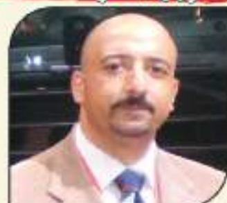
بقلم: أشرف كاره