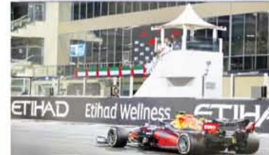
فيرستابن على خط النهاية