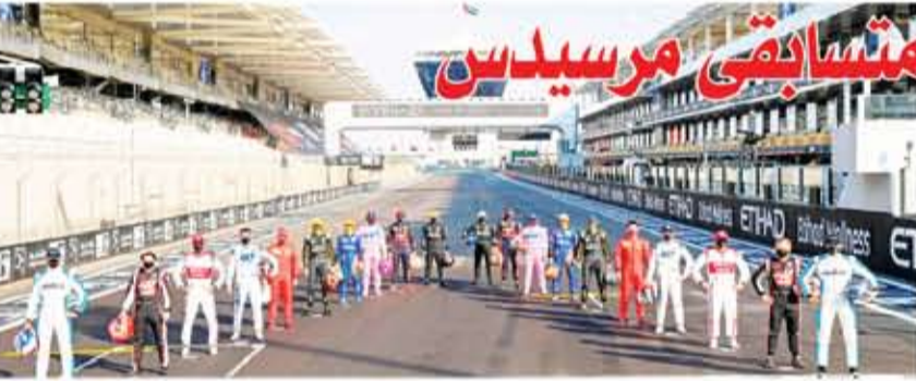
لقطة تذكارية لكافة المتسابقين بنهاية البطولة

نوريس خامساً وسابن سادساً. ومع ختام هذه الجولة، أسدل الستار على موسم استثنائي للفورمولا 1 شمل عدد 17 جولة وسجل خلاله حصول فريق مرسيدس على لقبه العالمي السابع على التوالي، وكذا مساواة هاميلتون لأسطورة الفورمولا 1 (مايكل شوماخر) بفوزه بلقبه السابع أيضاً.