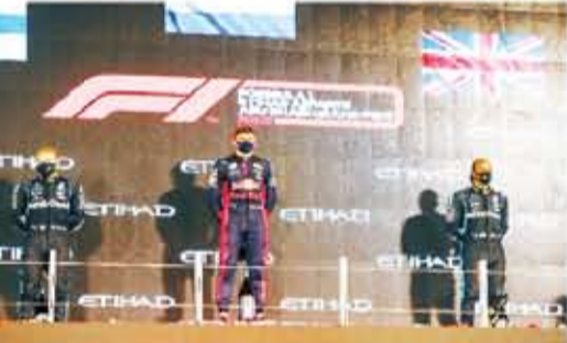
منصة فوز جولة أبوظبي