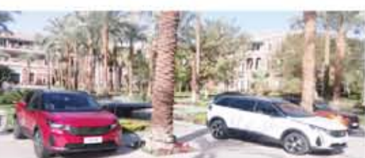
3008 & 5008 كانتا نجمتا رحلة بيجو