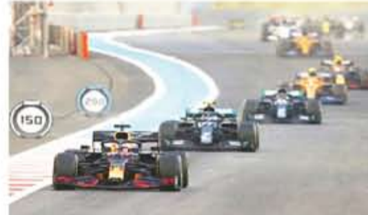
تصدر فيرستابن السباق بكافة لغاته