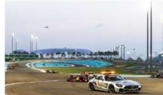
سيارة الأمان تدخلت بعد تعطل سيارة بيريز