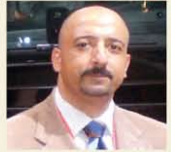
بقلم: أشرف كاره

لا شك أن الاستثمار الإيجابي بقطاع التسويق - خاصة في أوقات الأزمات - إنما يتم عن إدارة واعية وذات منظور مستقبلي نحو تحقيق العديد من النجاحات المنشودة.. كان ذلك بسماطة شديدة الطابع العام عن الرحلة التاريخية إلى مدينة أسوان الساحرة والتي نظمها شركة "مانسكو" - وهي تحالف مجموعة المصور للسيارات المصرية مع سكوب الإماراتية - وكلاء سيارات "بيجو" بالسوق المصرية. حيث كان عنوان الرحلة الاحتفال بمرور 210 أعوام على تأسيس شركة بيجو العالمية. علاوة على إطلاق الطرازات الجديدة المطورة لكل من 3008 & 5008 مع تصميماتها الثورية الجديدة التي تشمل بخطوطها المستوحاة من روح أسد بيجو. وذلك بخلاف استكمال تجربة 2008 سريعاً التي تم إطلاقها بالسوق المصري منذ ما يقرب من أسبوعين ماضيين. ولكن وجهة نظري اليوم لن تنصب على عملية تقديم تلك السيارات وفكرة الاحتفال بمرور 210 أعوام على تأسيس بيجو بذلك الطريق التاريخية ويأخذ أقدم الفنادق على أرض مصر (Old Cataract)، ولكن مستغرق لفكرة مبروريات الاستثمار التسويقي الإيجابية بمثل هذه الأوقات من الأزمات. فلا يخفى على أحد مقدار التداعيات السلبية من جراء جائحة كورونا (كوفيد-19) على كافة