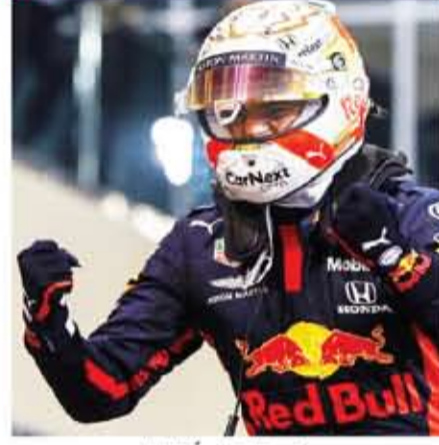
فيرستابن فرحاً بالفوز

التجارب الحرة والتأهيلات، عاد ماكس فيرستابن من جولة المنسخر (البحرين) قبل الأخيرة بموسم 2020 والتي خرج منها خالي الوفاض.. أكثر إصراراً على تحقيق إنجاز ختامى للبطولة ولتفريقه (ريد بول) بعد السيطرة التامة التي شهدتها الموسم من جانب فريق مرسيدس. فيما بكسر شوكة الفريق الألماني بداية بالتجارب الحرة الأولى التي تصدرها متوغاً بكل من بوتاس (مرسيدس) وأوكون (رينو)، فيما جاء ثالثاً بالتجارب الحرة الثانية خلف كل من عضوي فريق مرسيدس مع بوتاس وهاميلتون على التوالي.. خاصة مع ظهور أداء الأخير (هاميلتون) دون متساوية الجهود بعد عودته من (استراحة كورونا الطبية) بالأسبوع السابق، وليعاود فيرستابن تصدره للتجارب الحرة الثالثة ومن خلفه كل