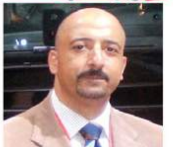
بقلم: أشرف كار