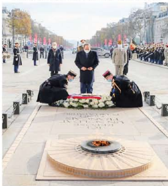
السيسى يضع إكليل من الزهور على قبر الجندي المجهول بميدان قوس النصر بالعاصمة باريس

وهي نفس السياق قال اللواء يحيى كدواني، عضو لجنة الدفاع والأمن القومي بمجلس النواب، إن زيارة الرئيس عبدالفتاح السيسي لفرنسا جاءت لتلبية لدعوة من نظيره الفرنسي، إيمانول ماكرون، وتطرقت للعديد من المشكلات والتحديات التي تواجه البلدين.