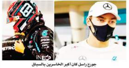
جورج راسل كان أكبر الخاسرين بالسباق

بينما انطلق سيرجيو بيريز في المركز الثامن. شهدت بداية السباق انطلاق راسيل بقوة ليقتحم على بوتاس، فيما شهد المثنى الرابع من اللفة الأولى حادثة تصادم بين كل من بيريز (رايسينج بوينت) ولوكير (هيراز) أدى لخروج الأخير من السباق، فيما اضطر هيرستين لتناوبها وهو ما أدى بها للاستخدام بالمحط الجانبي إلى جانب لوكير، ومن ثم خسارته سباقه (أيضاً) بلفة الأولى. ومع شتابة السباق وتدخل سيارة الأمان للمرة الأولى تابع راسيل تصدره للسباق، فيما تراجع بيريز للمركز الـ18 بسبب اضطراره لاستبدال إطاراته التي تضررت من حادثة مع لوكير. استمر السباق حتى اضطرار دخول سيارة الأمان للمرة الثانية إثر اصطدام (أكين) بالمحط الجانبي مع انصاف لفة السباق التي تبلغ ٨٧ لفة، وهو ما نتج عنه انسداداً كلاً من سباق مرسيدس لتغيير الإطارات للمرة الثانية، وهو ما تسبب عنه سوء تنظيم واضح من أعضاء فريق تسبب بانعكاس تركيب إطارات سيارات المتسابقين لبعضهم، ليعاود الفريق بنفس الوقت إعادة تركيب نفس الإطارات لبوتاس، فيما طالب الفريق من راسيل العودة لتركيب الإطارات الصحيحة - ولتراجع كلاً المتسابقين في المركز بعد أن كانا متصدرين له.