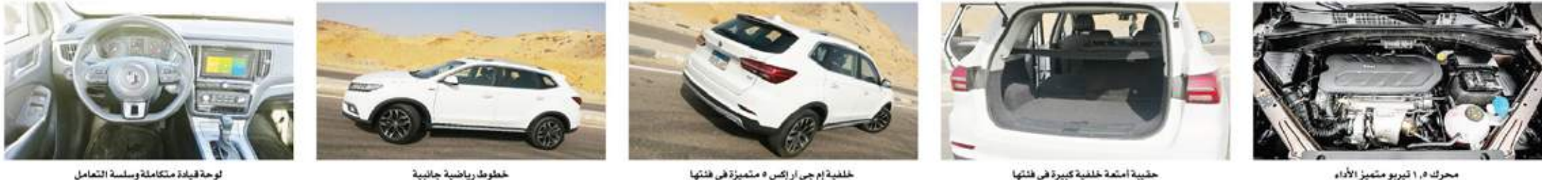
لوحة قيادة متكاملة وسلسة التعامل خطوط رياضية جانبية خلفية إم جي ر اكس ٥ متميزة في فئتها حلبة أعمدة خلفية كبيرة في فئتها محرك 1.٥ تيربو متميز الأداء

تجربة سريعة / أشرف كار قدمت (RX5) بالسوق المصرية مع النصف الثاني من عام 2018، وذلك بعد حصول مجموعة المنصور للسيارات على حق وكالتها بالسوق المصرية.. وما زالت تواصل (RX5) نجاحاتها بالسوق من خلال تحقيق مبيعات ملحوظة في وقتها. التصميم والأبعاد: أول ما يجذب اهتمام المتطلع على (RX5) هو حملها لظهور وخطوط (MG) الحديثة مع خطوطها التصميمية الرياضية الحادة وخاصة مع الصندوق الخلفي للسيارة ورفارها المنتفخة التي تؤكد عضلاتها رياضية التصميم، ومع ملاحظة فرق ارتفاع السيارة عن الأرض (الطول) يرتفع يقرب من 190 مم وهو ما أثر في عملانيتها - خاصة أمام منافسيها ضمن نفس اللفة - مع مراعاة بنائها على قاعدة عجلات تبلغ 2,700 مم، فيما جاء طول السيارة الإجمالي بقياس 4,545 مم، بينما بلغ عرضها الإجمالي 1,855 مم، فيما جاء ارتفاعها بقياس 1,719 مم مع ضئيل التحميل العلوية، وعن مساحة التحميل الخلفية للسيارة تبلغ 595 لتر مكعب قابلة للزيادة عند طي المقعد الخلفي المقسم بنسبة 40:60 والتي تعد إحدى أكبر مساحات التحميل لثل هذه اللفة من السيارات. وعن مقدمة ثانياً خلف بوتاس، فيما جاء الأمامية رياضية التصميم وشبكة التهوية الأمامية المتميزة بالتصميم الرياضي الضخم المدمجة مع الصادم الأمامي للسيارة والتي تم دعمها بمصباحي الضباب السفليين على جانبي المقدمة المدعومين بأضواء القيادة النهارية، فيما يأتي الجناح العلوي المدعوم للسيارة والذي يعمل مصباح التوقف الوهاج ليكمل من معايير السلامة بالسيارة.. ولتأتي خطوط