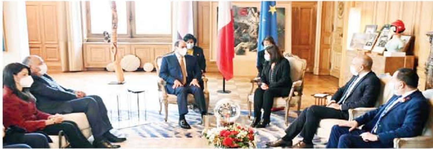
الرئيس السيسي خلال استقباله السيدة أن هيدالجو عمدة باريس في مقر عمودية باريس

تواجه المنطقة العربية. وشرحت مصر موقفها الثابت ورؤيتها للتحول بما يضمن تحقيق الأمن والاستقرار لدول المنطقة. وأكد كدواني، في بيانه، أن الزيارة جلت نتائج إيجابية مبررة على الجانب الاقتصادي بين البلدين، وتحقيق مصالح مشتركة بين السوقين المصرية والفرنسية، ما يدعم في النهاية التبادل التجاري ويزيد من تنافسية المنتجات المصرية في الأسواق العالمية، ويفتح آفاقاً اقتصادية واستثمارية جذابة تشتمل على تأسيس المشروعات القومية الكبرى التي تقوم بها القيادة السياسية في مصر.