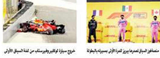
مشاهير السباق تعبرها بيريز للمرة الأولى بسيرته بالبطولة

تقرير - أشرف كار سباق البحرين الثاني لهذا الموسم خلال عطلة نهاية الأسبوع الماضية والذي حمل تسمية (الصخير). جاء استثنائياً بأحداثه الدراماتيكية وخاصة مع ما قدمه المتسابق الياباني (جورج راسيل) من أداء رائع والذي تم اعتباره من هزيم وليامز ليقود لصالح مرسيدس - بحكم أنه من متسابقين أكاديمية مرسيدس للفورمولا - حيث جاءت الاستعارة هذه ليشغل مقعد هاميلتون الذي أصيب بفيروس كورونا بعد جولة البحرين الأولى (المضنية)، فيما قدم سيرجيو بيريز متسابقاً من راسيل أداء استثنائياً من أهله للفوز بالسباق وتسجيل أول فوز له منذ بدء المسابق لما يقرب من 1٠ سنوات.