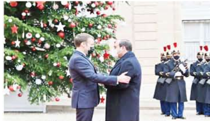
استقبال الرئيس الفرنسي ماكرون للرئيس السيسي بقصر الإليزيه

« إننا نواجه تحديات مشتركة في جميع المجالات، السياسية والعسكرية والاقتصادية والثقافية كما يجرى التشاور والتنسيق بيننا بصورة منتظمة ودورية إزاء مختلف القضايا محل الاهتمام المتبادل إقليمياً ودولياً.