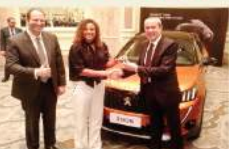
ميار شريف تتسلم مفتاح ٢٠٠٨ من خالد يوسف ومحمد شيحا

شهد فندق فورسيزونز جارتون سيتي حفل توقيع لاعبة التنس المصرية العريقة ميار شريف عقد اولها مسؤوليها تحمل علامة ييجو واستيارها السيارة الرياضية الجديدة. جاء ذلك، من منطلق أن علامة ييجو هي الراسخ الرسمي لمطولة رولان غاروس الخاصة برياضة التنس، والتي شهدت البطولة مؤخرا تكافؤ لاعبة المصرية العالمية ميار شريف ووسولها الناشئة البطولة، باعتبارها أول لاعبة تنس مصرية تحقق مثل هذا الانجاز. التحظى بمزيد من تشجيع الهنئين هذه الرياضة، بكل البطولات التي تشارك بها لاعبة التنس المصرية ميار شريف، والتي قدرت بترتيبها الدولي لكافة منقمة متخطية ٢٠٠ مركز واحدة، لتتصدر إلى طليحة الأبطال المصريين الذين