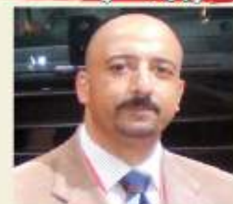
يقلم: أشرف كاره