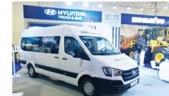
ميكروباص هيونداي سولاتي العامل بالغاز