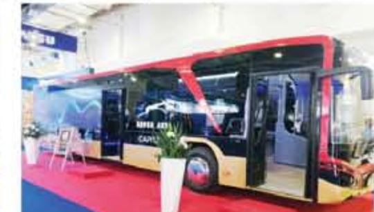
باص سوبر جيت العامل بالغاز والرسمي للعاصمة الإدارية