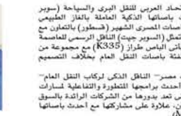
باص سوبر جيت العامل بالغاز والرسمي للعاصمة الإدارية