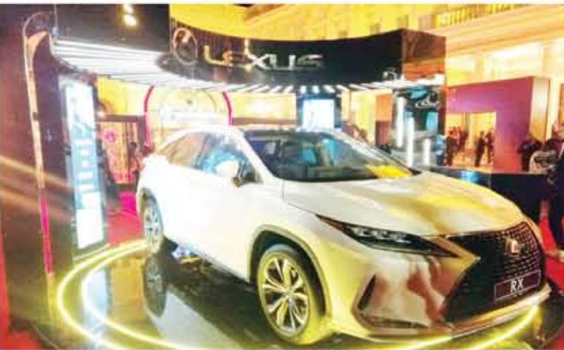
ليكزس آر إكس - فخامة رياضية فوق العادة

المغير التكيف بالإضافة إلى Sport S و Sport S+.