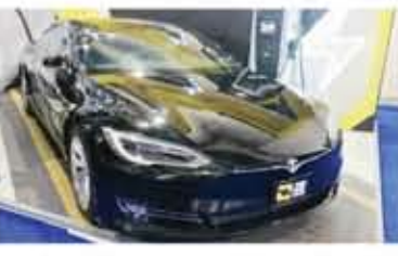
شركات محطات شحن الكهرباء تواجدت بقوة في المعرض