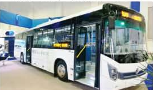
إم إس في قدمت باصها الكهربائي للنقل العام