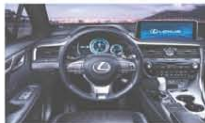
فخامة ورياضية التصميم الداخلي