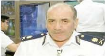
اللواء محمود عبد الرزاق