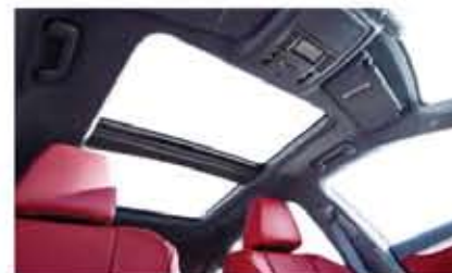
سقف بانورامي قابل للتحكم