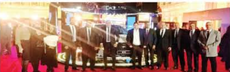
مجموعة الصحفيين المدعوين للحفل مع ممثلي إدارة التسويق بالشركة

أعلى معايير الثبات والتحكم في القيادة جاءت ليكزس Lexus RX بهدف تعزيز ديناميكية