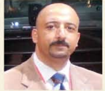
بقلم: أشرف كار