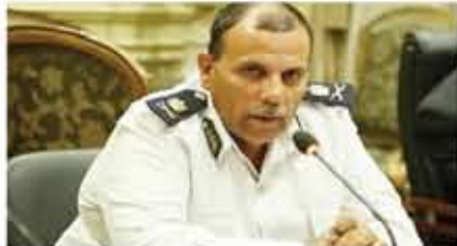
اللواء هاني جرجس

أشرف الجندي مدير أمن القاهرة، كما قامت الإدارة العامة للمرور بتوفير عدد من سيارات الإغاثة المرورية تم توزيعها على جميع أقسام الطرق، تقوم بمساعدة قائدي