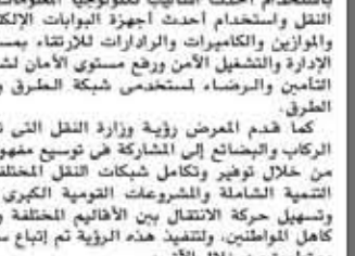
مواصلات مصر الرائدة بالأنظمة النقل الذكي، شاركت بدورها في المعرض