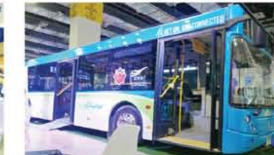
مواصلات مصر الرائدة بالأنظمة النقل الذكي، شاركت بدورها في المعرض