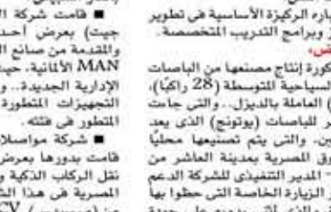
ميكروباص هيونداي سولاتي العامل بالغاز