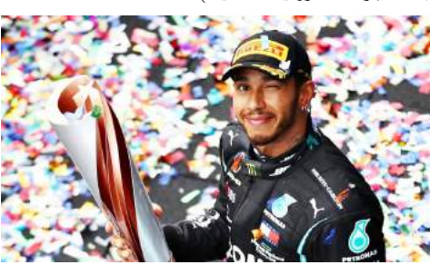
هاميلتون يحتفل بلقبه العالمي السابع بجولة إسطنبول