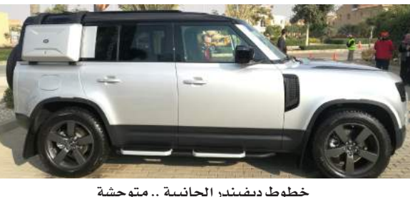
خطوط ديفيندر الجانبية.. متوحشة