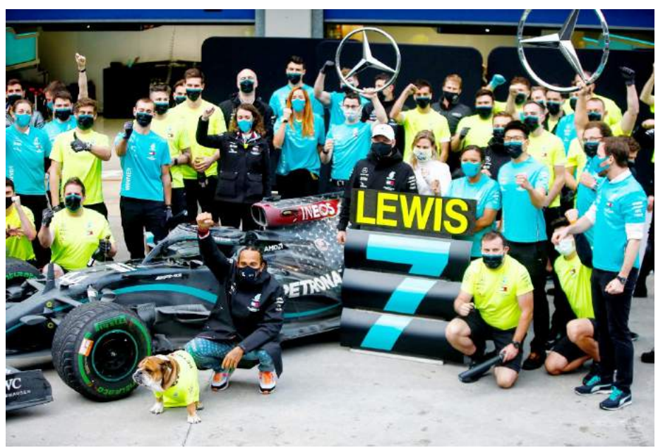
فريق مرسيدس يحتفل بلقب هاميلتون العالمي السابع

مع تبدل المعطيات وإتساق الرياح بما لا تشتهي سفن مرسيدس)، جاءت نتائج التجارب النجدة الأولى لصالح فيرستيان (ريد بول) أولاً، متبوعاً بزيميه بالفيكر أليكس تونر، ثم متسابق فريق فيراري (شارل كولبير). فيما جاءت التجارب الحرة الثانية ليوم الجمعة مع تصدق فيرستيان للمرة الثانية بنفس اليوم، ثم لوكير ثانياً، فيما حل بوتاس (مرسيدس) ثالثاً. ومع تجارب يوم السبت الحرة، أدى حصول الأملار إلى تزايد حالة سوء الحلية ومن ثم تراجع تماسك السيارات عليها انتهت هذه التجارب الحرة فوكير ماكنس فيرستيان أولاً في أداء استثنائي على الحلية المبللة، تبعه لوكير ثانياً.. فيما حل البون ثالثاً. ومع التجارب التأهيلية ليوم السبت، استمرت المفاجآت بسبب استمرار الأملار التأهيلية الأول، فيما توقفت بكلا القسمين الثاني والثالث مع بقاء سطح الحلية مبللة بالماء، وانتهت بقسمها الثالث بمفاجأة لانس ستروال (رايسينج بوينت) بتصدرة مركز الانطلاق الأول مسبق الأحد، تبعه ماكنس فيرستيان ثانياً، ثم سبرجو بويوز (رايسينج بوينت) ثالثاً، تبعهم البون رابحاً، ثم ريكاردو (رينو) خامساً، والفاجا- هاميلتون (مرسيدس) سادساً، ثم هوكاردو (رينو) سابعاً، متبوعاً بركبي راكوتن (الفاروسيو) ثامناً، ومن بعدهم بوتاس (مرسيدس) تاسعاً، وبمركز الانطلاق العاشر جوفانزى (الفاروسيو). أما عضو فريق فيراري فلم يتسكنا من تحقيق أفضل من مركزي الانطلاق الثاني عشر والرابع عشر لكل من فيتيل ثم لوكير على التوالي، إلا أنهما انطلقا من المركز الحادي عشر والثاني عشر بسبب الجزاءات التي فرضت على عضو فريق ماكلارين بتأخير إحدى جولات الفورميلا 1 عليها).