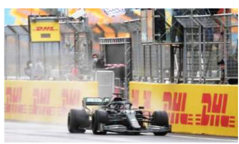
هاميلتون أولاً على خط النهاية