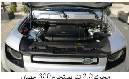
محرك 2.0 لتر يستخرج 300 حصان