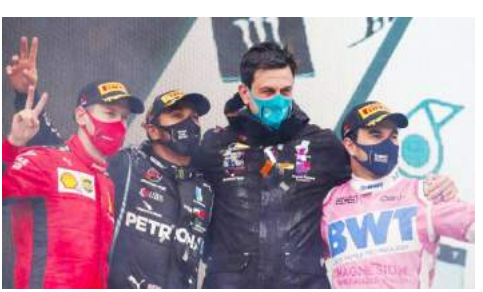
منصة تويج إسطنبول 2020