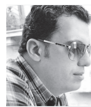
بقلمه: أحمد إسماعيل

الأيام مثل الشباب، التي أصبحت من هذا الانحراف الأخلاقي والترهيفي، لا بد أن يكون لديهم دون ديبلوماسية، هو أن غالبية هذا الجيل يعانى من سطحية، أثناء خطر على الوطن، توافرت له وسائل الداع لم تكن متاحة لأجيال سابقة قضت نصف عمرها بين القتاتين الأولى والثانية، والنصف الآخر في مشقة البحث عن الذات والعمل وبناء أسرة، جيل الحرام الأعظم منه لم يبق معنى الحرام لتكشف عظماءه، ولم تعد الأسرة المصرية قادرة على فرض هيمنتها على هذا الجيل، الذي أصبح يملك العالم بين يديه من خلال الهاتف المحمول، الذي يمتدح كل شيء ويبحر به في جميع المجالات الفنون والرياضة والمواقع الأباحية.