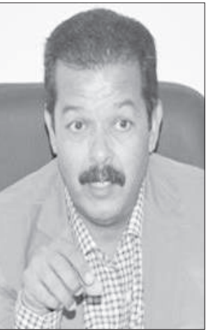
اللواء جمال رشاد

في ظل بدء إعادة تشغيل المنشآت بنسب تشغيل ٢٥٪، وفقاً لتقرير رئاسة مجلس الوزراء، كخطوة لعودة الحياة لطبيعتها، يظل السؤال الذي يراود المواطنين كيفية تحقيق رقابة محكمة، للحفاظ على أرواح المواطنين والعاملين في تلك المنشآت، حتى انتهاء أزمة فيروس كوفيد-1٩؛ لذا، كشفت السوق العربية عن خلال تصريحات المسؤولين، عن كيفية الرقابة على المنشآت والمطاعم والإجراءات المتخذة لرفع المخالفين.