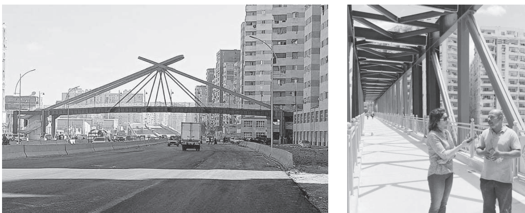
مشروع محور المحمودية في مدينة النثر، الذي يربطها بمحور مصر الجديدة.

أعلن المهندس محمد زكريا، رئيس الهيئة العامة لنقل الركاب والنقل الحضري، عن تسمية المحمودية والذي أطلق عليه «شريان الأمل»، وأكد أن الهيئة العامة للنقل بالإسكندرية، تنطلق ١٥ أوتيسا كورنيشا، مكتب الهواء، وسبع ٩٠ راكبا، ويصل بمحرك كوربا، ٣٠٠ وات، وسرعته القصوى ٨٠ كيلومتر/الساعة. كما أنه جرى تقسيم الأوتيسات الكورنيشا للعمل على خطوط محور المحمودية. وأشار إلى أن الخط الأول يبدأ من مدينة بشارت الخبير ١ و٢ بركموز مرورا بسبعة وصولا إلى محطة السيوف بالعبودية، والخط الثاني يخدم محطات في بشارت الخبير - بالويو - وكالة وشيخ زايد - حيدر السعيد - سيوف، لافتا إلى أن الخط الثالث يخدم ١٦ محطة يبدأ من بشارت الخبير إلى العوالي.