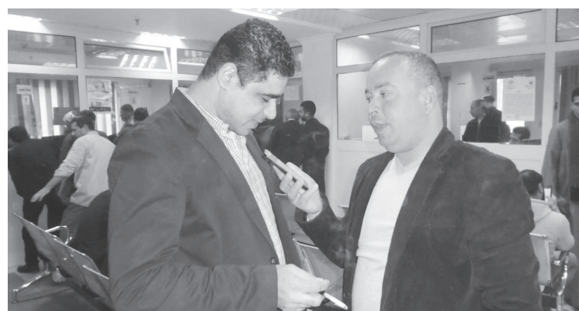
محرم السوق العربية يتحدثان مع المواطنين