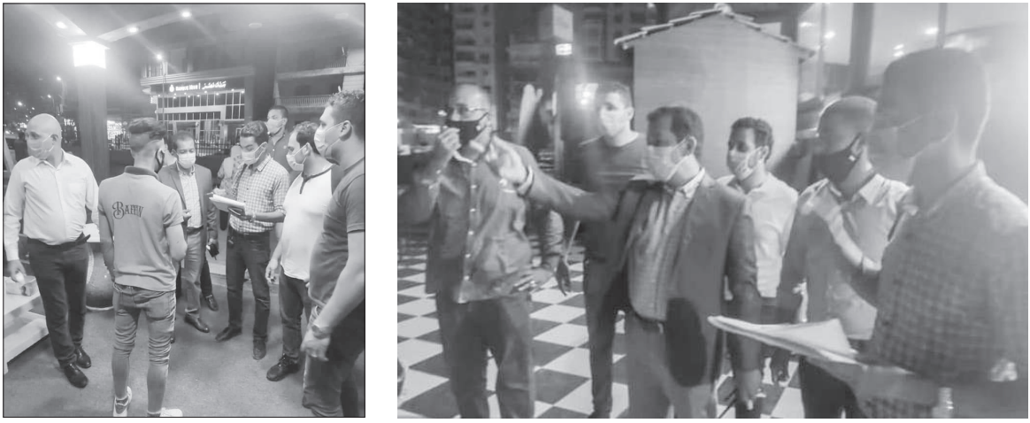
أثناء حملات المركزية للسياحة على المطاعم والمقاهي

وتؤكد مسافات آمنة وارتداء الكمامات، مشيراً إلى استجابة البعض ورفض البعض الآخر متعللين بأن المكان مفتوح، مؤكداً استمرار وديمومة التوعية والرقابة، ومتابعياً انتهاء الأزمة.