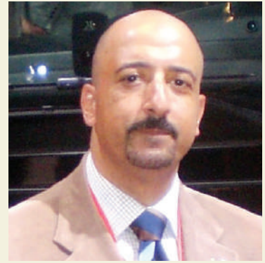
بقلم: أشرف كاره

لا أحد ينكر على الدولة المصرية ما تشهده من تطور بيئتها التحتية والتنمية المتميزة بأساليب إدارتها وسن قوانين إيجابية جديدة تصب جميعها بمصلحة المواطن وتبشر بمستقبل باهر لهذا البلد الكبير. الأمر الذي لاحظناه بالعديد من القطاعات المختلفة سواء التعليمية، الصحية، الصناعية، التجارية، الإسكان والتعليم، وبالطبع الطرق والمواصلات.. وحتى البيئة. ولكن بطبيعة الحال، وكما تعودنا في هذه الزاوية نتحدث عن شؤون وشجون السيارات والقطاعات المرتبطة بها، فقد كان لزاماً علينا العمل على المساهمة بإضافة الأفكار والرؤى لهذه الأعمال الطبيعية التي يتم القيام بها على أرض مصر، وكانت «رؤيتي للتوأمة» أن يتم ذلك في صورة إرسال بعض الفرق الرياضية لأعضاء الحكومة المصرية المؤقتة: