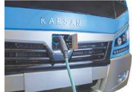
سهولة شحن مايكروباص جيست

المايكروباص الأول ، وخاصة على طرقات أسطنبول المزدهمة - وذلك بخلاف تواجد بقاء بالعديد من دول العالم ، أما عن الفئة الكهربائية منه فهي تمثل رؤية الشركة المستقبلية للمنافسة العالمية ، وهو الأمر الذي نتمنى وصوله إلى سوقنا المصري ... حتى ولو كان هو من سيمثل رؤية الحكومة القادمة بإحلال سيارات المايكروباص بسيارات مايكروباص يتميز بمرونة تشغيله وعدم تسبب قانديه في تعطيل حركة المرور بسبب سهولة صعود ونزول الركاب .