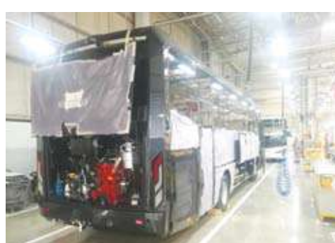
بقسم تركيب التجهيزات الميكانيكية لباصات

الداخلية لعمل الباصات على فترات زمنية طويلة. إدارة البحوث والتطوير: ويتميز هذا المبنى المستقل من مباني المصنع والذي تم بنائه عام 1986 بالقسم المتخصص بتصميم الأجزاء الميكانيكية وليلصل في النهاية عام 2016 مع قسم الأجسام الخارجية وكبائن الركاب بعد التطوير الشامل لكافة أقسامه، ومن خلال إستعراض المهندس المختص الذي صاحبنا بزيارة هذا المبنى ولخطوات الإعداد لتقديم باصات جديدة .. أشار أن مشروع الباص الجديد قد يستغرق فترة تتراوح بين العامين والثلاثة أعوام ، فيما يستغرق عمل التطوير