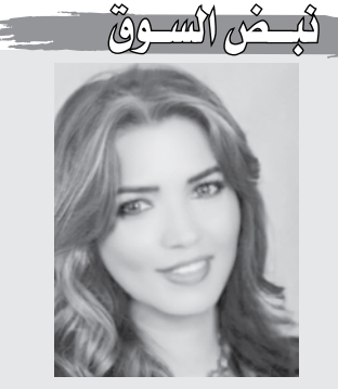
قلم : سوزان جعفر