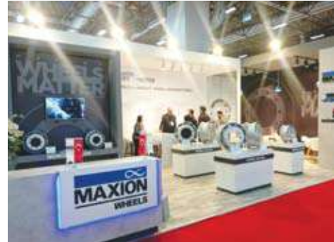
عجلات الباصات المعدنية