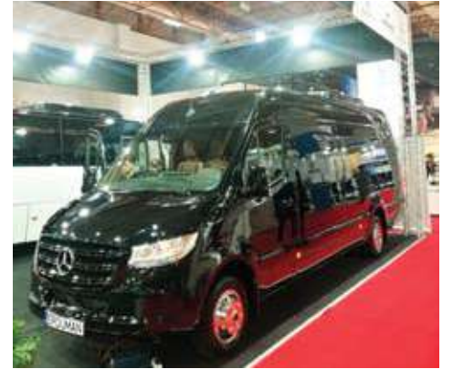
تعديلات على سبرينتر مرسيدس