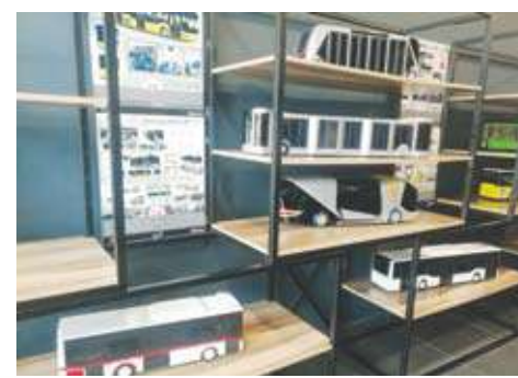
من داخل متحف تصاميم قسم البحوث والتطوير

على باص قائم بمجموعة من التعديلات وجوانب متباينة من التطوير لفترة زمنية قد تصل إلى عام ونصف. ومع نهاية زيارتنا السريعة للأقسام الرئيسية يخطط إنتاج المصنع ، تم تعريفنا ببعض الجوانب التاريخية عن إنتاج المصنع سواء للشاحنات أو السيارات التاريخية القديمة التي كانت تنتج بأقسام المصنع سابقاً ، وهو ما خلق فرصة لكافة ممثلي الصحافة المدعويين للإلتقاط الصور التذكارية والتعرف على بعض الملامح التاريخية لأعمال الشركة بالسوق التركية.