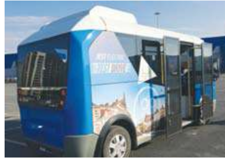
خطوط خلفية إستثنائية لـ المايكروباص جيست