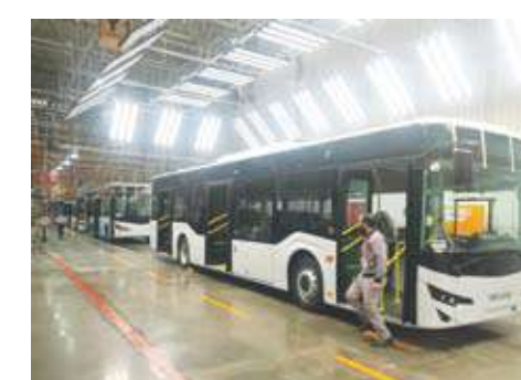
بنهاية خط إنتاج الباصات