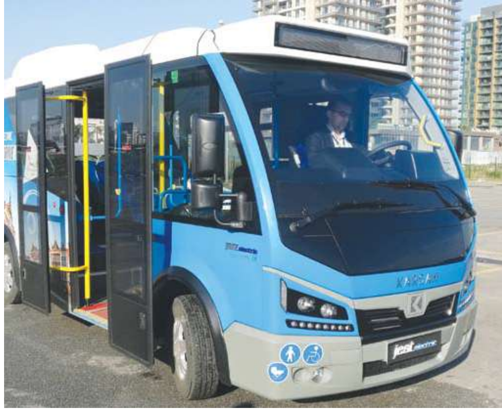
تصميم متميز للمقدمة