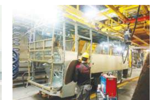
داخل قسم الهيكل