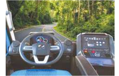
لوحة قيادة متميزة