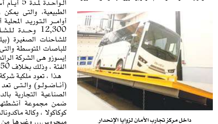
داخل مركز تجارب الأمان لزوايا الإحدار