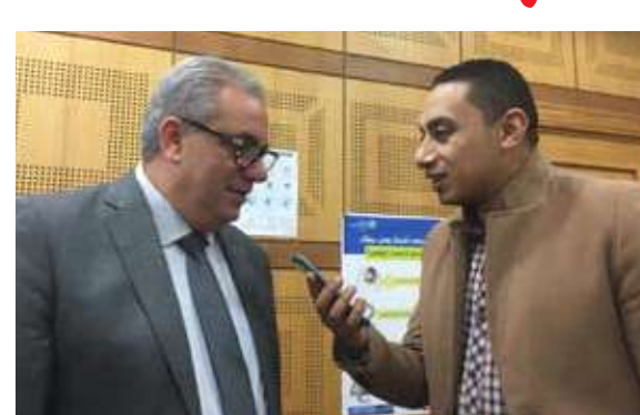
الدكتور جون جابور يتحدث لمحرم السوق العربية

مكافحة العدوى والسيطرة عليها، وتوفير معدات الحماية الشخصية PPEs، ووسائل إيصال تلك المعلومات للتوعية، ولتفت جابور إلى أن هناك استجابة للجهود المحلية بمصر من خلال تفعيل خطة الطوارئ وتدريب مقدمى الرعاية الصحية وفرق الاستجابة السريعة، وأكد أن أهم الرسائل التي تريد أن توصلها المنظمة للعالم تتمحور في إنشاء ليات تنسيق مناسبة للأنشطة المعنية بفيروس كورونا، فضلاً على إعداد خرائط لتوصيف قدرات الشاهب والاستجابة الحالية، وتعزيز الترصد في نقاط الدخول إلى البلدان والمراقب الصحية وإجراء تقييمات لمخاطر الفيروس في كل دولة، وأوضح جابور أن معدل الإصابة بالفيروس منهم 78% من الحالات تتراوح أعمارهم من 10-20 عاماً، 75% ذكور، 78% إناث، ومعدل الإصابة بالفيروس هناك 78% حالات خفيفة، 11% حالات وخيمة، و7% حالات حرجية ونصح المواطنين باتباع الطرق الوقائية لفيروس كورونا التي أعلنتها عنها وزارة الصحة فلابد من غسل الأيدي جيداً، والابتعاد عن الشخص بمسافة متر على الأقل.