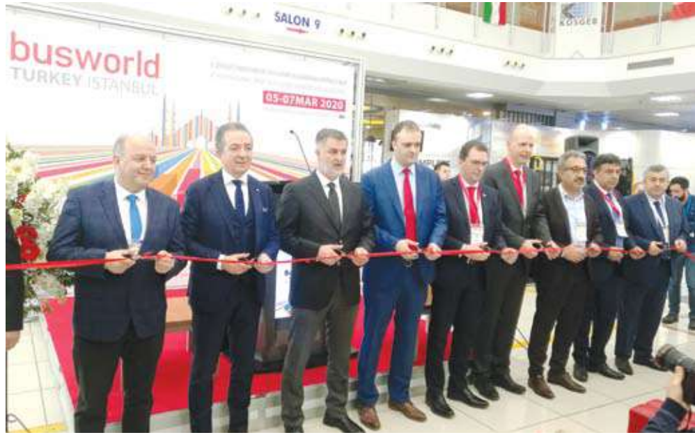
قص شريط افتتاح المعرض