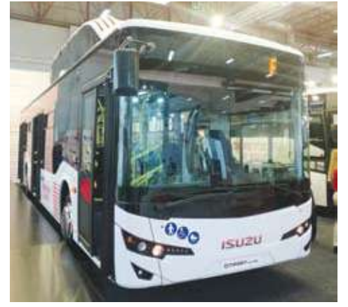
إيسوزو سبتي بورت العامل بالغاز الطبيعي