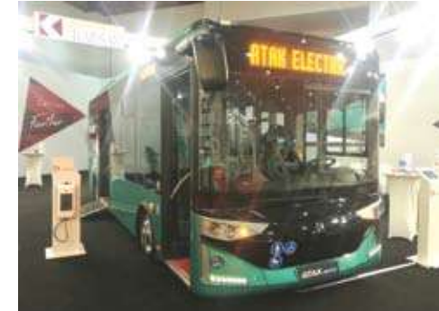
كارسان أتاك إيكترنا