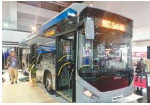
أوتوكار - كنت إيكترنا

العجلات قام بإطلاق منظومة جديدة من محاور العجلات الخاصة بالباصات الكهربائية توى أنظمة تبريد مدمجة ، الأمر الذى سيساهم بقوة فى رفع أداءها ، وخاصة أن أهم ما قد تشكو منه المركبات الكهربائية بشكل عام والباصات بشكل خاص هى منظومة التبريد للأجزاء المحركة وخاصة مع عدم وجود أنظمة تبريد مائية تقليدية بها ، وإعتمادها كلياً على تبريد الهواء.