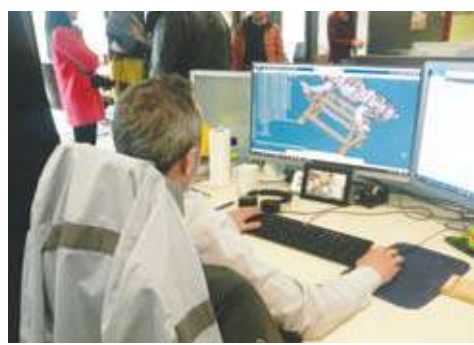
داخل قسم التصميم الهندسي