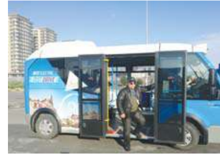
سهولة الصعود والنزول لـ المايكروباص جيست