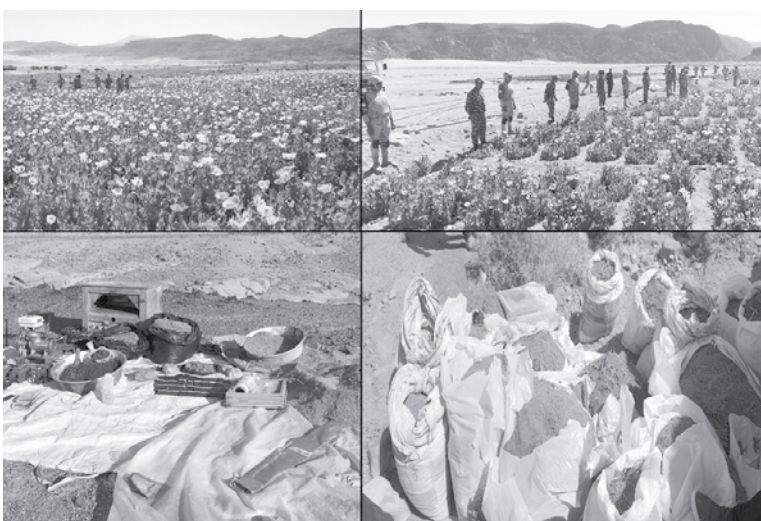
وتدمير عدد (٤٢) مزرعة لنبات البانجو بإجمالي مساحة (٢٢) فدان ، و عدد (٤١٦) فدان كما تم ضبط (٢٨) طن و نصف من

مادة البانجو المخدرة و عدد (٥٥٤) كيلوجرام لبثور البانجو وضبط (٤٠٨) كيلو جرام من بذور الخشخاش و (٤٩) كيلو جرام من مادة الحشيش المخدرة (٤٧٩) كيلوجرام من بوذرة الحشيش المخدرة ، ضبط ٦ مصنع لصناعة وتوزيع الحشيش يحتوى على (٤) ميزان حساس لقياس أوزان المواد المخدرة ، و (٧) مكبس حشيش ، و (٧٧) فورمه حشيش و (٤١) كيلو جرام شمع و (٤) ماكينة فرم حشيش ، وضبط دراجة نارية بدون لوحات معدنية تستخدم في أعمال النقل بين المهريين . يأتي ذلك بالتزامن مع أحكام السيطرة لقوات حرس الحدود على كافة الاتجاهات الإستراتيجية للدولة مما أسفر عن ضبط كميات هائلة من العقاقير والمواد المخدرة وأحياط دخولها إلى مصر ، وما يعثله ذلك من تهديد بالغ الخطورة على أمن وسلامة أبناء الشعب المصري .