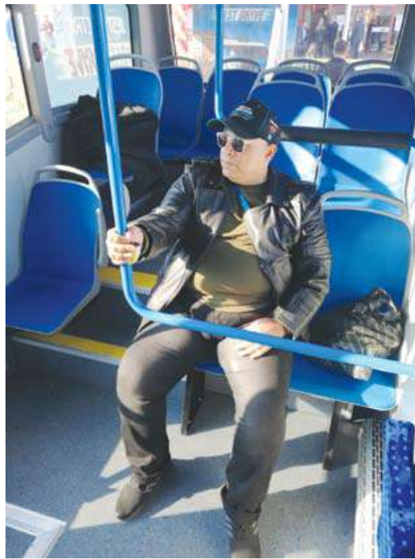
راحة تامة لركاب جيست

المايكروباص الأول ، وخاصة على طرقات أسطنبول المزدهمة - وذلك بخلاف تواجد بقاء بالعديد من دول العالم ، أما عن الفئة الكهربائية منه فهي تمثل رؤية الشركة المستقبلية للمنافسة العالمية ، وهو الأمر الذي نتمنى وصوله إلى سوقنا المصري ... حتى ولو كان هو من سيمثل رؤية الحكومة القادمة بإحلال سيارات المايكروباص بسيارات مايكروباص يتميز بمرونة تشغيله وعدم تسبب قانديه في تعطيل حركة المرور بسبب سهولة صعود ونزول الركاب .