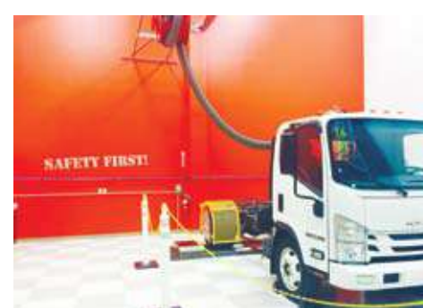
داخل قسم الفحص النهائي للشاحنات