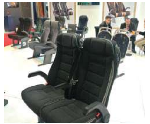
حضور قوى لشركات تصنيع مقاعد الباصات