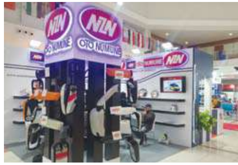
نشاط ملحوظ لشركات تصنيع المعدات شأن مرابا الباصات