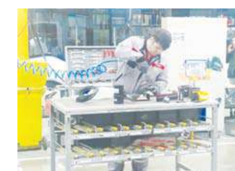
داخل قسم التجهيزات لكبائن الركاب