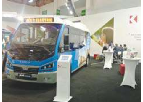
كارسان جيست إيكترنا

• OTOKAR ، الصانع الأكبر والأقدم للباصات فى تركيا وخاصة للفتة المتوسطة (Midi-bus) التى تتصدر مبيعات الشركة منها ما يزيد عن 35% من حجم السوق المحلى بخلاف أسواق التصدير ، حيث عرضت الشركة مجموعة من أحدث طرازاتها التى تركز أغلبيتها على قطاع نقل الركاب العام، والتي كان على رأسها (Kent Electra) المخصص لاستخدامات النقل العام والعامل بالكهرباء بالكامل ، علاوة على مجموعة (Navigo) الشهيرة والمتعددة الأحجام للإستخدامات السياحية.