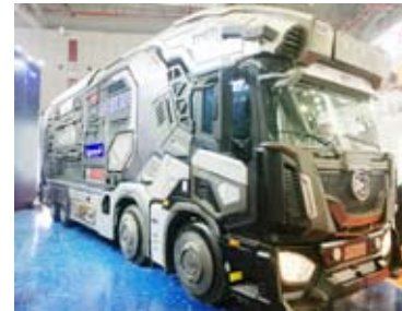
رؤية مستقبلية لشاحنات الخدمة المتكاملة