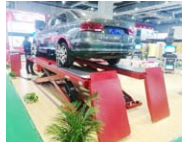
أحدث أنظمة معدات الرفع المخصصة لمراكز الخدمة