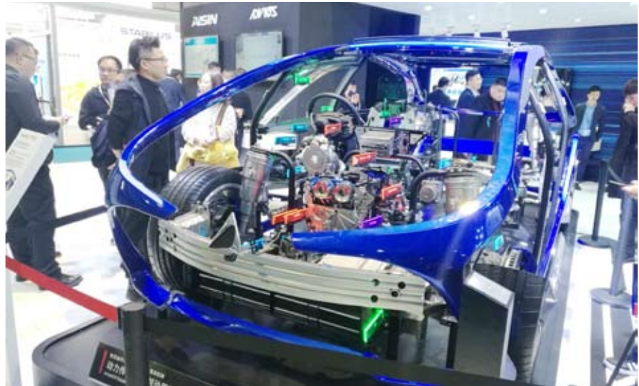
أحدث التكنولوجيات قدمتها إيشن