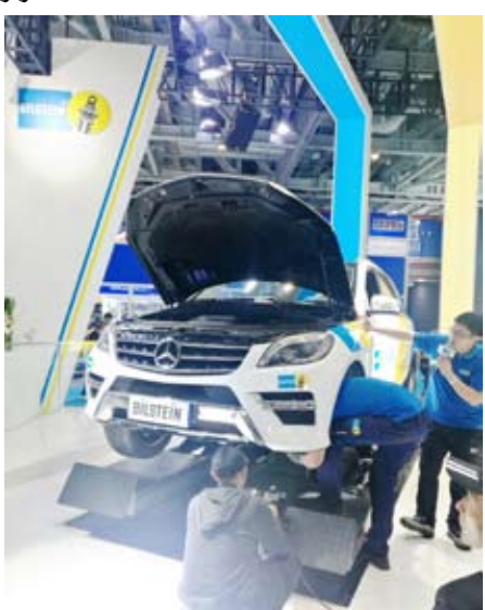
برامج عملية للإصلاح من بلشتاين المتخصصة بال تعليق المتطورة