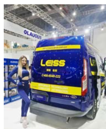
شاحنات خدمات الطوارئ السريعة