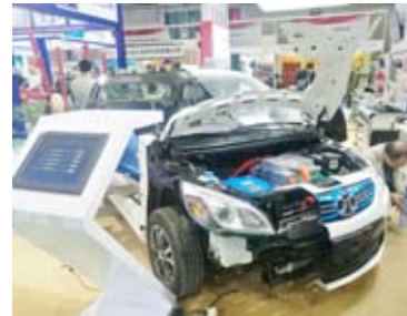
نشاط ملحوظ لشركات تحويل السيارات إلى عمالة بمحركات كهربائية