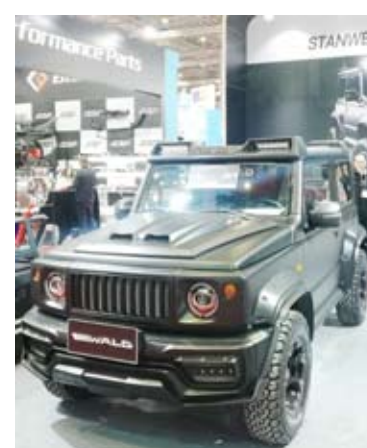
شركة والد للتعليل قامت بتعليق سووك جيسن إى مرسيس جركل