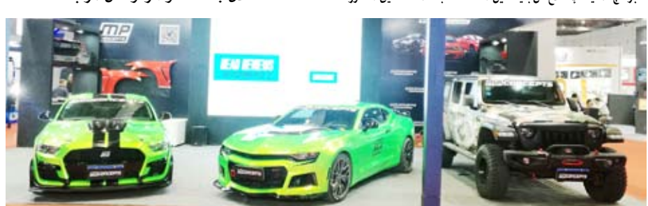
حضور فوي لشركات التعديل الأمريكية

أيام المعرض.. ناقش خلالها عدة محاور أهمها الرؤية المستقبلية لصناعة السيارات ومركبات نقل الركاب ومدى تواصلها إلكترونياً مع بعضها البعض دون تدخل بشري من خلال برامج الذكاء الاصطناعي وبرامج تسيير المركبات من دون سائق (Autonomous)، علاوة على الرؤية المستقبلية لشركات تصنيع السيارات خاصة مع التحول السريع نحو السيارات الكهربائية، وذلك إلى جانب دور التكتلات الصناعية في صناعة السيارات المستقبل.. سواء بالأسواق العالمية بشكل عام أو بالسوق الصينية بشكل خاص. وقد كان من أهم نتائج الأبحاث التي تم استعراضها خلال جلسات المؤتمر، تحول اهتمامات العملاء (سواء ركوب السيارات خاصة أو نقل ركاب عامة) وليس امتلاكها، حيث تزايدت اهتمامات الشباب بصفة خاصة- بالوسائل التكنولوجية الحديثة بمقابل انخفاض اهتمامهم بامتلاك سيارة خاصة.. خاصة مع تطور وسائل نقل الركاب بأنواعها، أو حتى إمكانية ركوب سيارات الركوب الخاصة بأنظمة التاجير المختلفة أو بأنظمة الاستخدام بالبطاقات المدفوعة مسبقاً (موبيل وشيل). حيث تمكن حامل بطاقة عضويتها من استخدام سياراتها من أي نقطة من نقاط الركوب أو المواقع المخصصة والتنقل بها كما يشاء ليعيدها لأقرب نقطة من وجهته ويقوم بركنها بدوره مجدداً ليتمكن راكب آخر وعضو بهذا البرنامج من