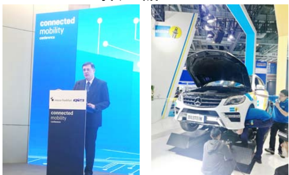
خلال جلسات مؤتمر تواصل المركبات