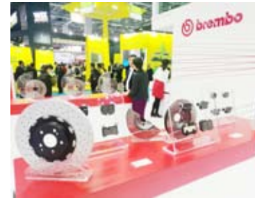
أحدث أنظمة الكبح من بيريمبو العالمية