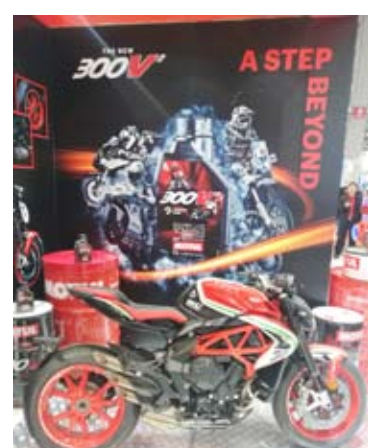
زيت موتور الرضا أشهر سباقات الجارية من بولندا