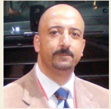
بقلم: أشرف كاره