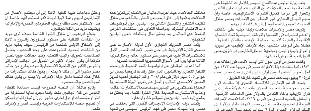
الرئيس السيسى مع نظيره الإماراتى الشيخ محمد بن زايد آل نهيان