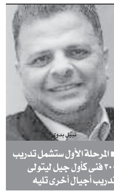
المرحلة الأولى ستشمل تدريب ٢٠٠ فنى كأول جيل لتبولى تدريب أجيال أخرى تليه

٢٢ فنى تجميع معدات، و٤٨ فنى صيانة معدات، و٦٠ فنى خراطة معادن، و٣٦ فنى ايحات كهربيانية، و٣٦ فنى ايحات ميكانيكية، و٤٨ فنى تركيبات. وأضاف بأن فكرة تدريب فنيين جاءت استبدالاً لعملية استيراد المعدات وخطوط الإنتاج، والتي ستبدأ بالتعريف بالرسوم الهيكلة للماكينة وكيفية تجميعها، موضحاً بأن المتدربين هم من سيقومون بتجميع الماكينات، كجيل أول يقوم بتدريب أجيال أخرى تليه. وأوضح بدوى بأن أنواع ماكينات وخطوط الإنتاج التي سيتم تجميعها فى مصر بواسطة الخبراء الأندونيسيين، يصل عددها إلى ١٢ نوعاً، وهي كالتالى: ١- ماكينات التفتيز MILLING MACHINES ويستخدم هذا النوع من ماكينات CNC قواطع دوارة لقطع مواد مختلفة من المواد المصنعة، وتعتمد عملية القطع على بعد الأمر لتحديد العمق، والاتجاه وزاوية القطع، والقطع فى هذه الماكينة أصبحت أكثر دقة؛ نظراً لاستخدام التكنولوجيا وإدخال الحاسب