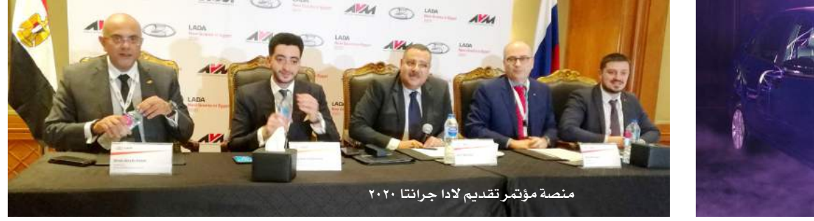
منصة مؤتمر تقديم لادا جرانتا ٢٠٢٠