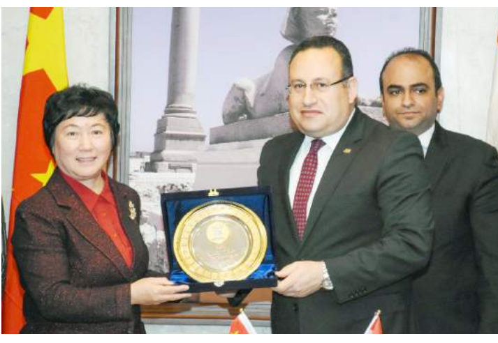
محافظ الإسكندرية ونائب رئيس مجلس إدارة مقاطعة هاينان الصينية