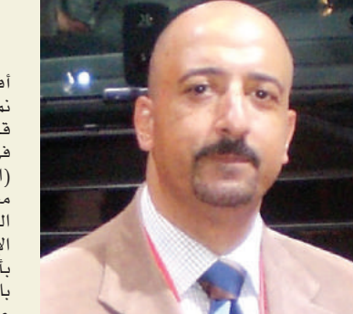
بقلم: أشرف كاره