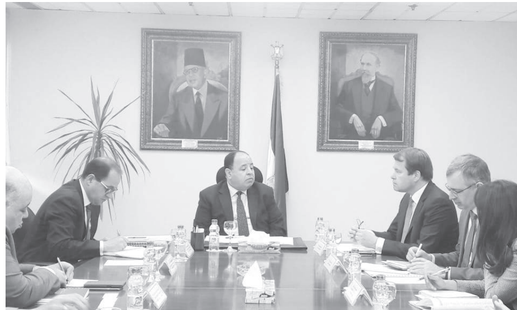
وزير المالية خلال الاجتماع

وأكد وزير المالية أن هذه النتائج من ثمار برنامج إصلاح الاقتصاد المصري حيث استطعنا تحسين الأوضاع الاقتصادية رغم كل التحديات التي واجهتها الحكومة المصرية، لافتاً إلى إدراك الدولة لوجود المزيد من التحديات التي يجب مواجهتها، وفي هذا السند تعمل وزارة المالية وفق خطة استراتيجية تهدف إلى تطوير وتحسين كفاءة مصلحتي الضرائب المصرية والضرائب العقارية وإيضاً مصلحة الجمارك وتسهيل وتوحيد جميع الإجراءات وتطبيق نظام الميكنة وهو ما سيسهم في جذب