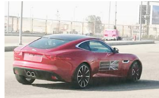
تجربة مسار متعرج والإجراف ساخنة مع سائق جاجوار المحترف على اف تايب