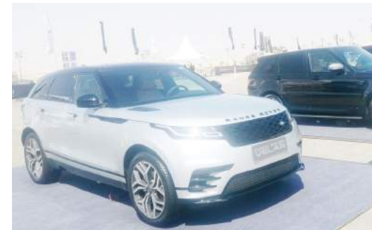
جانب من مجموعة سيارات لاندروفر - رينجروفر