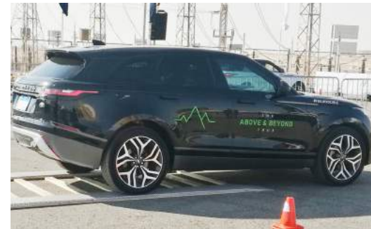
تجربة استخدام الكاميرات عند الرجوع للخلف مع فيلاو