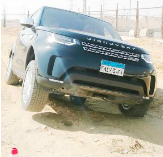
تجربة ديسكوهرى على الطرق شبه الصحراوية غير الممهدة

الراكب الأساسى مع رياضة الشركة (F-Type) للسيارات وخاصة مع مدى ما توفره هذه التقنيات من أداء آمن للوقت مع الإجراف (Drift) وهو ما أكد على مدى رياضة السيارة... وبالطبع مع قائدها المحترف.