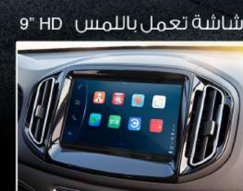
شاشة تعمل باللمس HD 9"