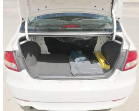
صندوق أمتعة خلص على التحميل