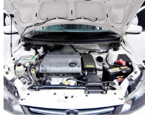
محرك سعة ١,٢ لتر اقتصادي، ولكن مطلوب تحديثه