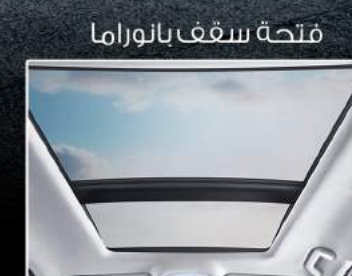
فتحة سقف بانوراما