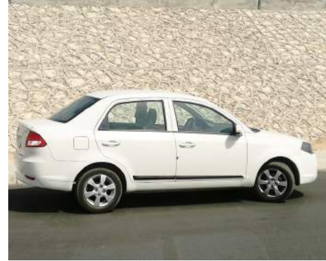
خطوط جانبية للسيارة تعبر عن فئة الاقتصادية السيارة