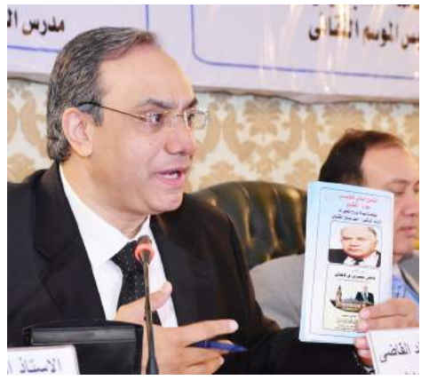
المستشار الدكتور خالد القاضي