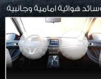
وسائد هوائية امامية وجانبية