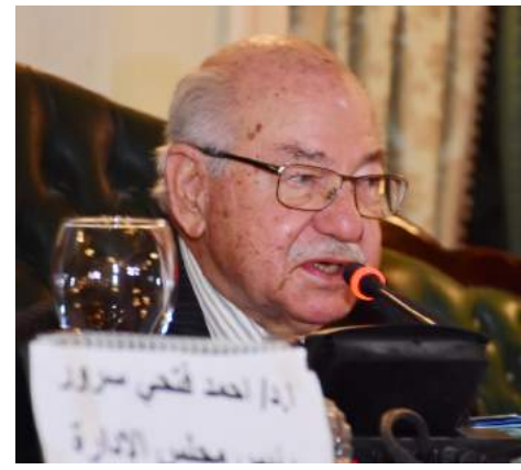
المستشار الدكتور محمود فهمي