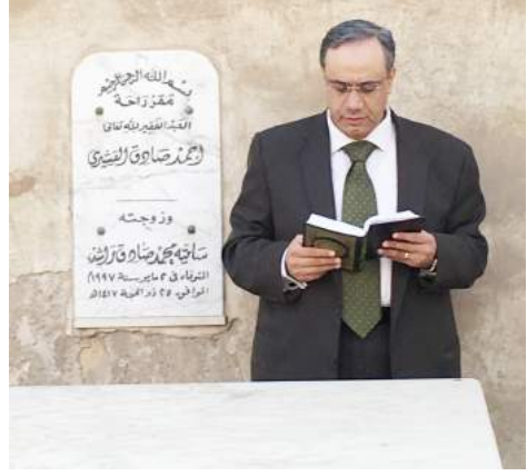
القاضي يقرأ آيات من القرآن على قبر القشيري