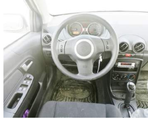
لوحة قيادة بسيطة وعملائية