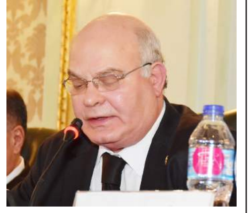
المستشار الدكتور شوقي عفيفي