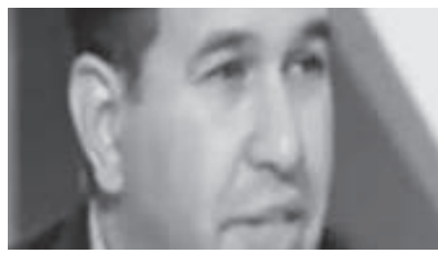
تحليل فني لسهم «أبو قير للأسمدة» وأهم نقاط الدعم والمقاومة

أظهر صافي إيرادات أبو قير للأسمدة ارتفاع صافى الأرباح بنسبة ٤١، ٣٣٪ وذلك في خلال أول ٩ أشهر من العام المالي الجاري، وعلى أساس سنوي، حيث إنها سجلت صافي أرباح بلغت ٢،٥٩ مليار جنيه منذ بداية يوليو ٢٠١٨ وحتى نهاية مارس ٢٠١٩، مقابل ١،٩٤ مليار جنيه خلال نفس الفترة من العام المالي الماضي، وأرجعت أبو قير للأسمدة تلك الارتفاعات في الأرباح إلى سياسة التجديد والإحلال، وهو ما أدى إلى استمرارية تشغيل التصنيع بطاقة تعمدى ٧١٠٠ وذلك دون التأثير على برامج الصيانة المحسنة، وبالإضافة لتحسين أسعار منتجات التصدير خلال الفترة، والمواد الأولية من الشركات التي تساهم فيها، بالإضافة لزيادة الإيرادات.