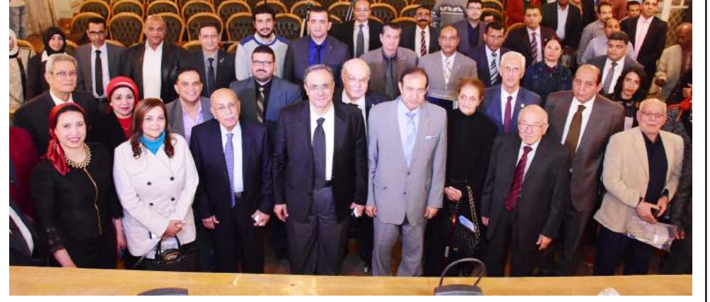
صورة جماعية للمشاركين بعد الندوة