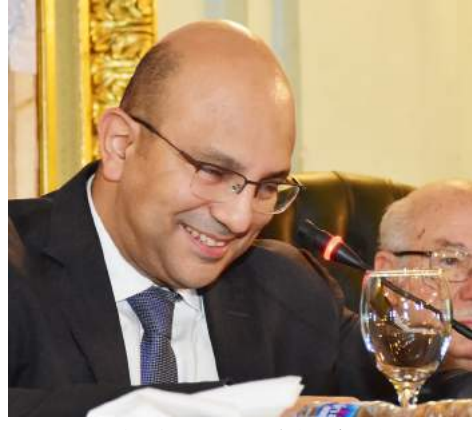
المستشار الدكتور إسماعيل سليم