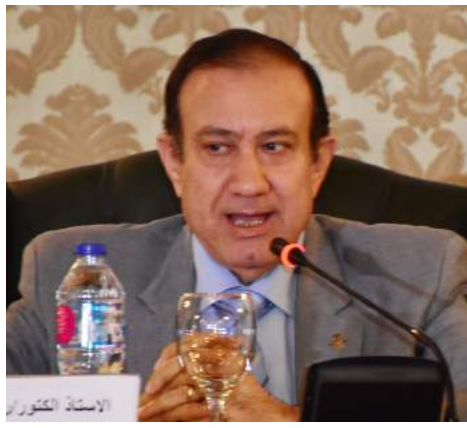
الأستاذ الدكتور راجح رتيب