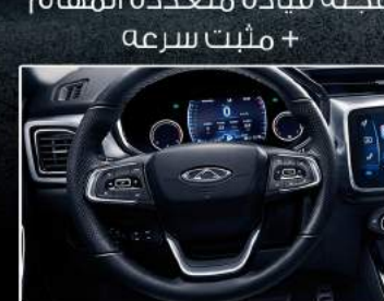
عجلة قيادة متعددة المهام + مثبت سرعة