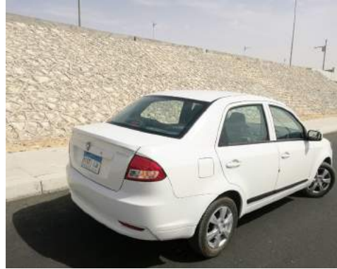
تصميم متحفظ لخلفية السيارة