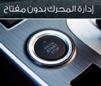
إدارة المحرك بدون مفتاح